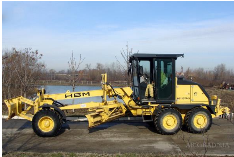
Slika 2.4. grejder