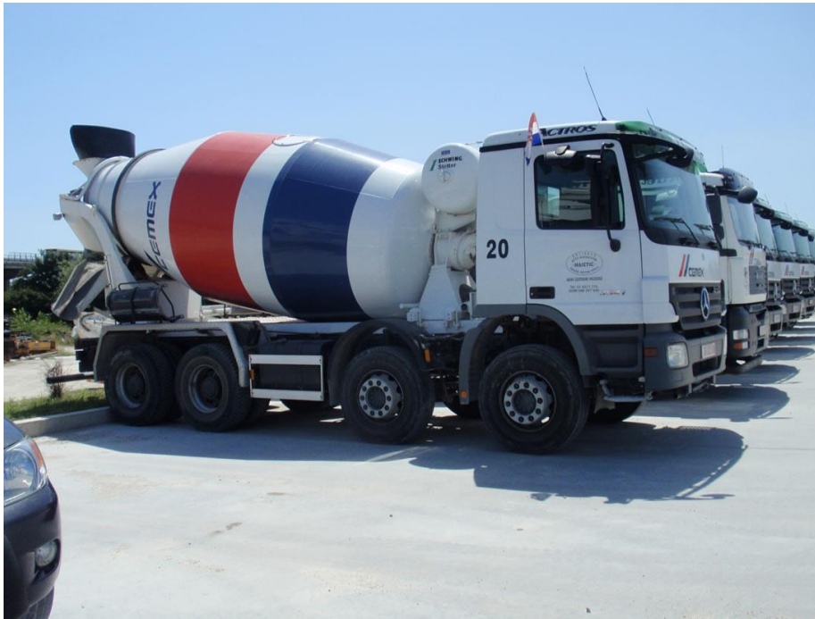
Slika 2.6. automiješalica