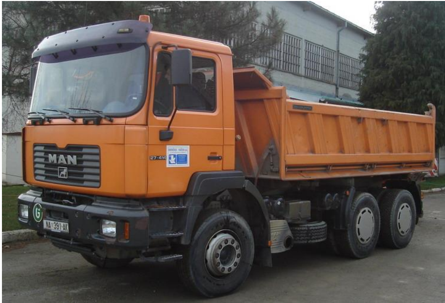
Slika 1.3. kamion MAN