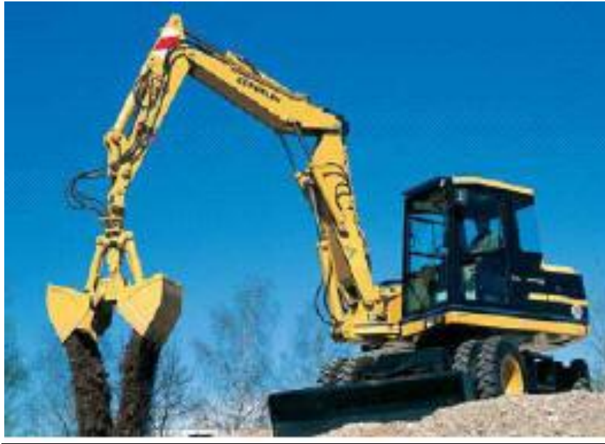
Slika 2.2. jaružalo sa zahvatnom lopatom