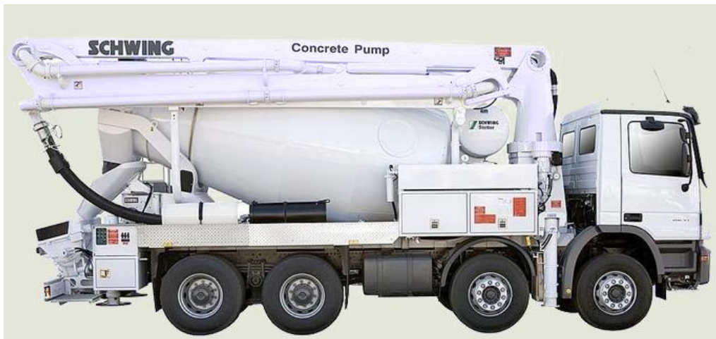
Slika 2.7. crpka za beton