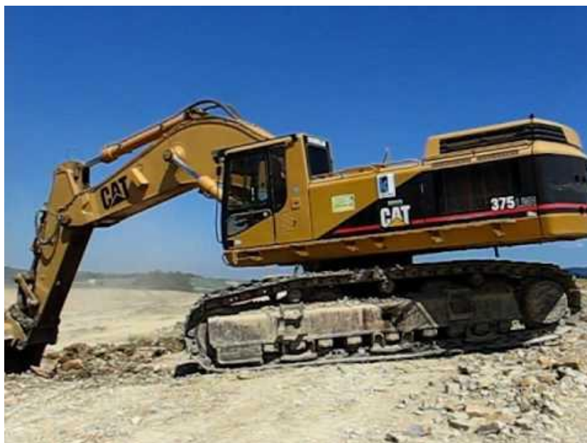
Slika 1.1. Bager Caterpillar 375 LME