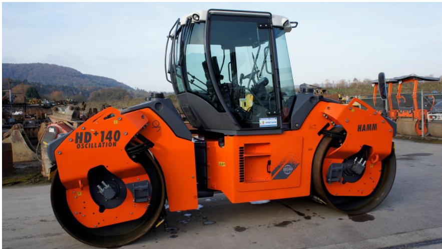
Slika 1.8. Valjak