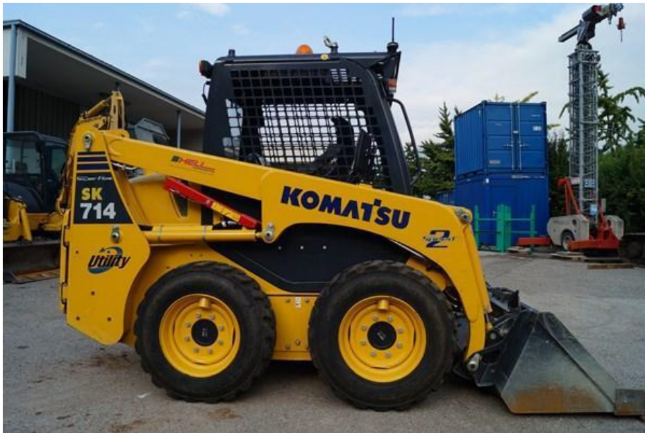
Slika 1.6. Mini utovarivač