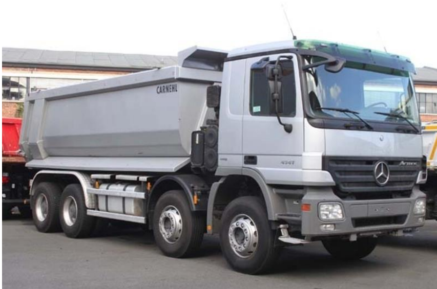
Slika 1.2. kiper damper