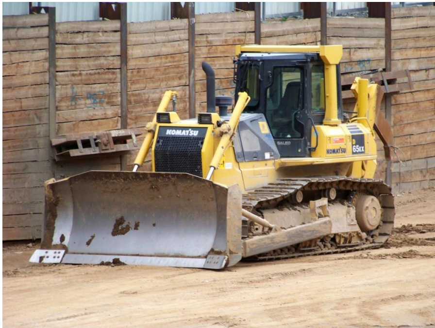
Slika 1.5. Buldozer