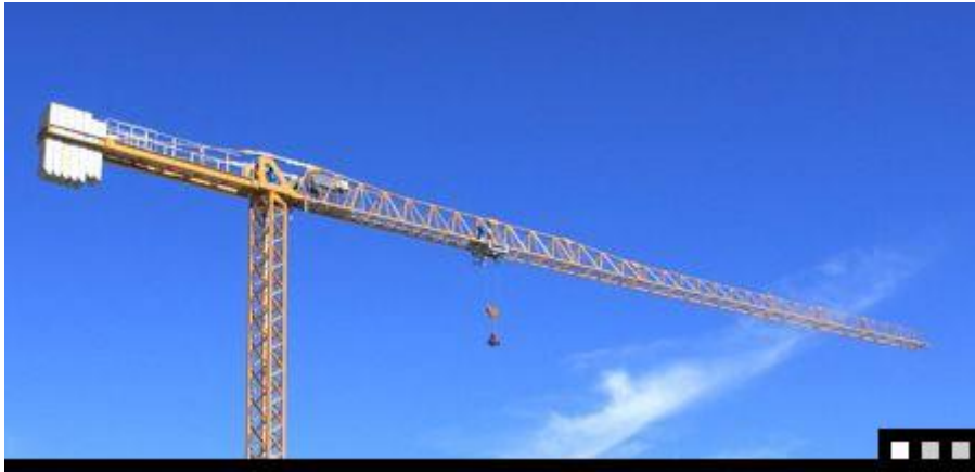
Slika 2.3. dizalica