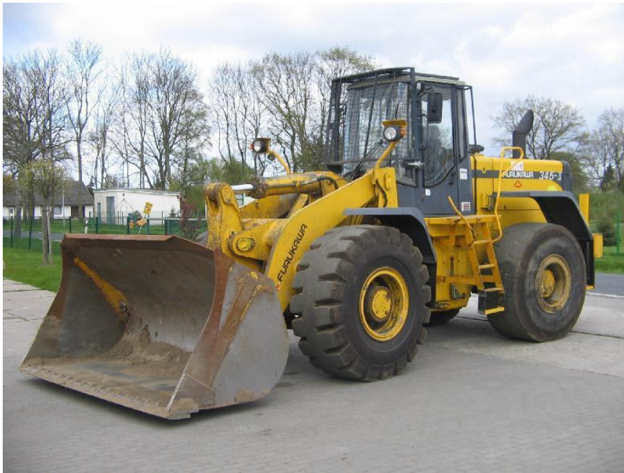
Slika 1.7. Utovarivač