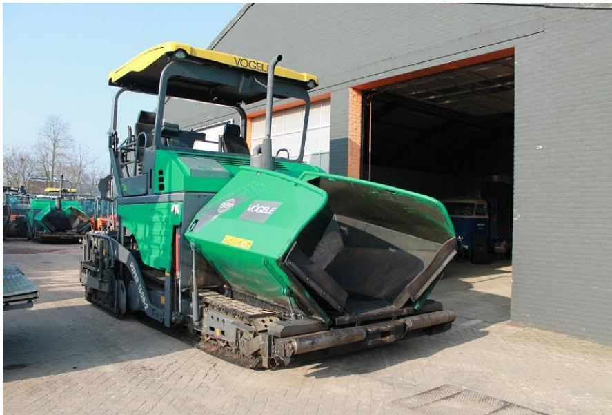
Slika 1.9. Finiđer