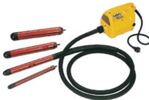
Slika 2.5. pervibrator