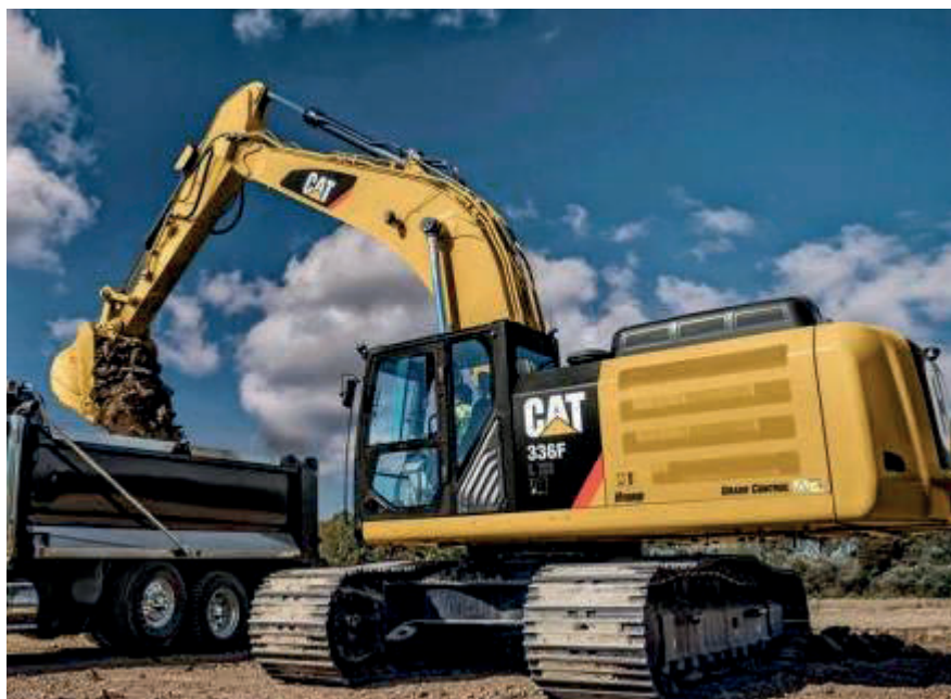
Slika 15. Caterpillar 336 F [15]

Karakteristike jaružala CAT 336 F (Slika 15.):