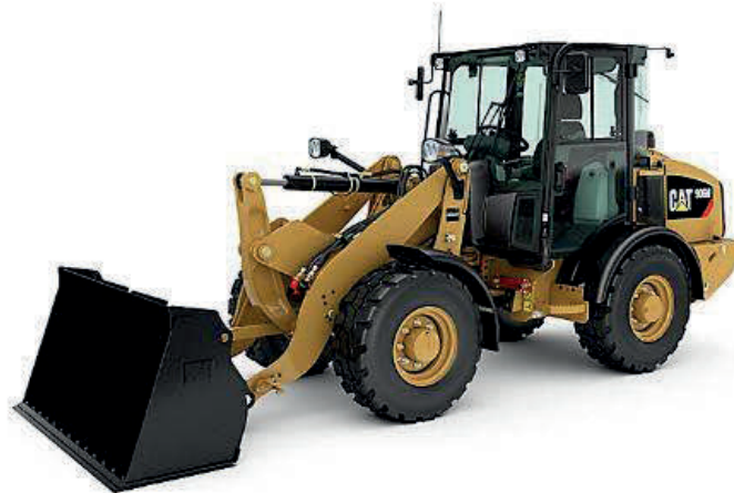
Slika 11. Utovarivač CAT 906M [11]