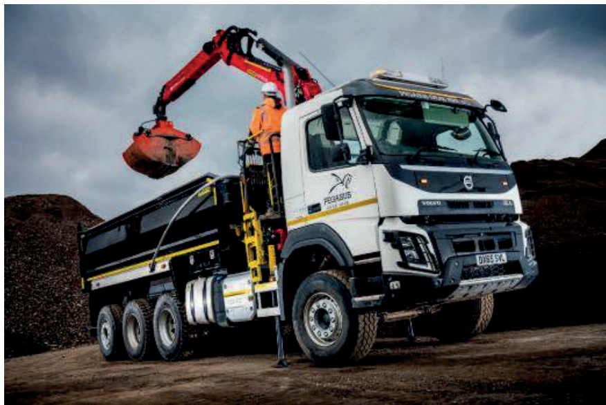
Slika 12. Kamion kiper VOLVO FHI 2 [12]

Karakteristike kamiona kiperera VOLVO FHI 2: