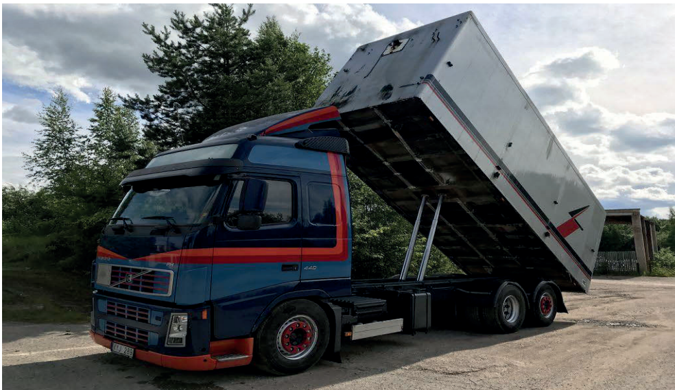
Slika 16. Kamion kiper VOLVO FHI 2 [16]

Ukupna količina materijala za dovoz; Q_{\text{materijala}} = 1168,56 \text{ m}^3