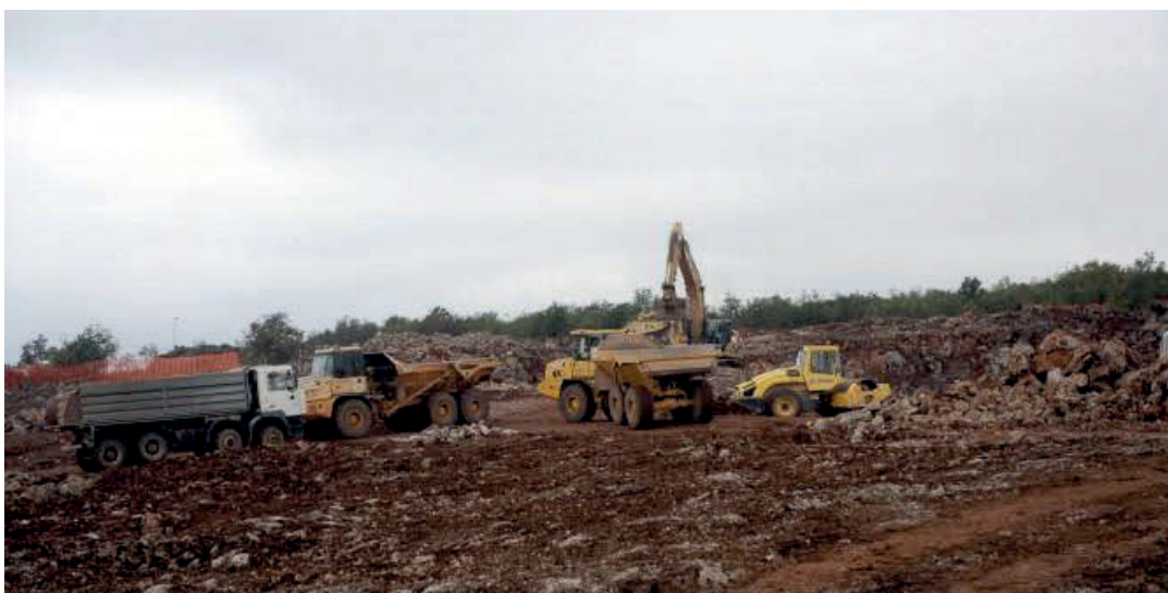
Slika 6. Primjer usklađenosti zemljanih radova [6]