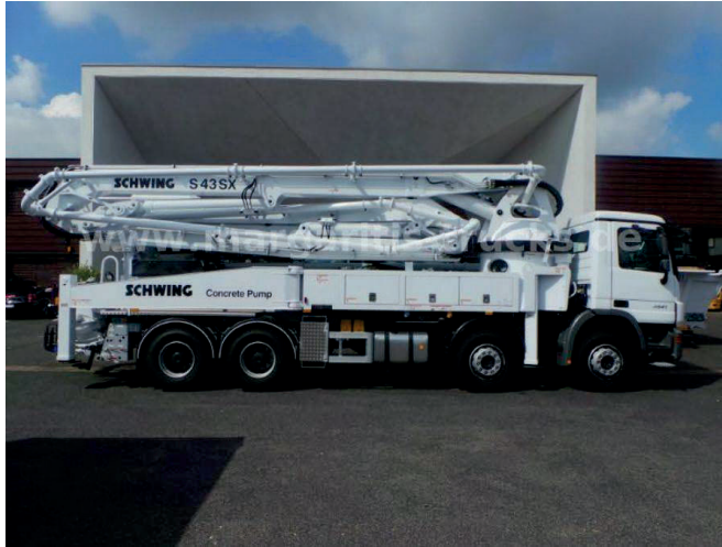
Slika 19. Mercedes Benz 3541B [19]

Karakteristike crpke Mercedes Benz 3541 (Slika 19.)