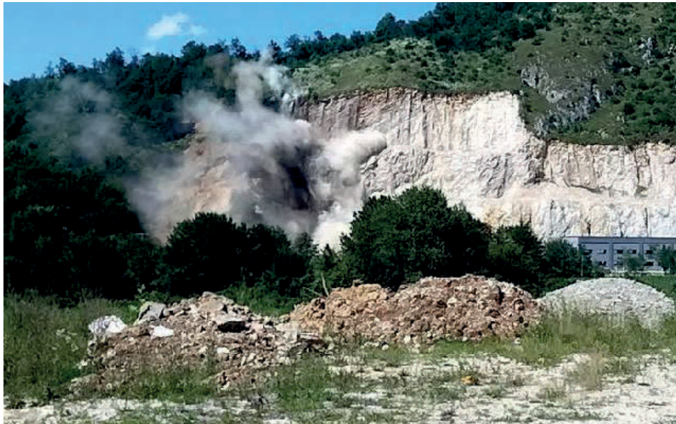
Slika. 10. Miniranje čvrste stijene [10]