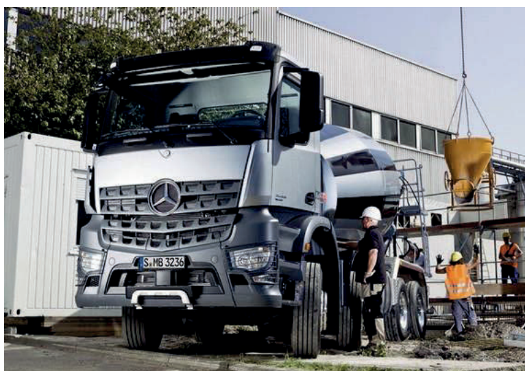
Slika 18. Mercedes Benz 3235 [18]

Karakteristike Mercedes Benz 3235 (Slika 18.):