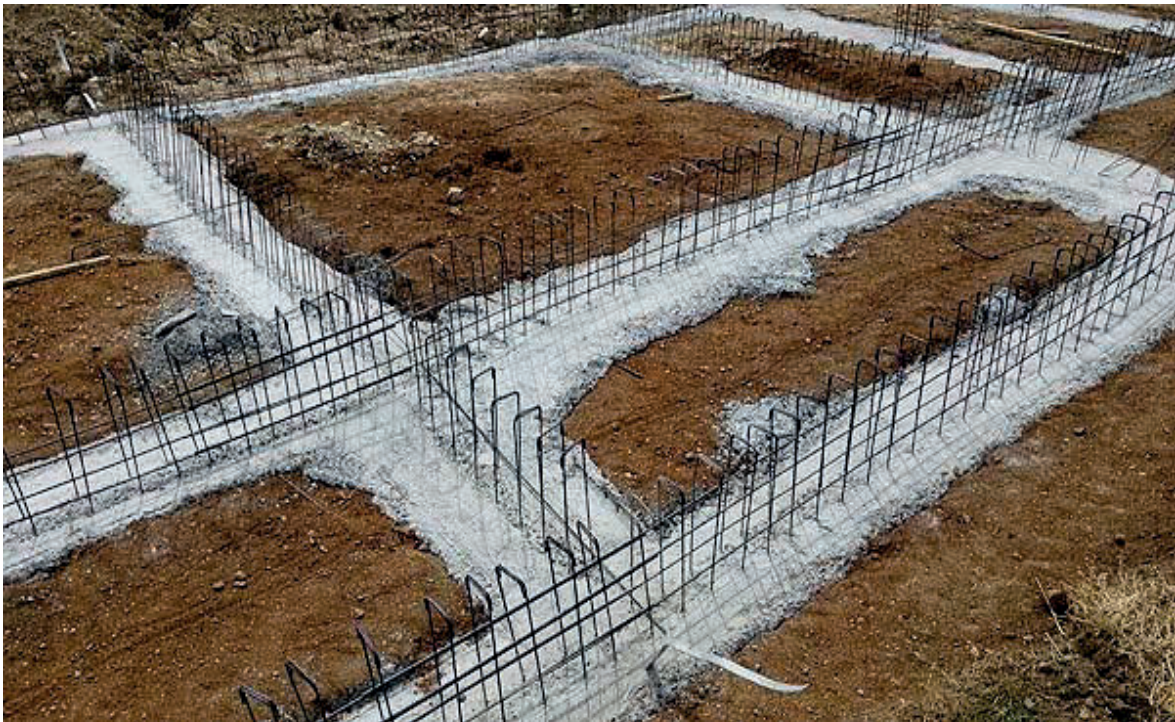
Slika 21. Izgled gotovih trakastih temelja [21]

Zaključak: Potrebno nam je 1 betonska pumpa, 3 automiješalice i 16 pervibratora kako bi dobili najbolji učinak iskoristivosti radnog vremena i strojeva.