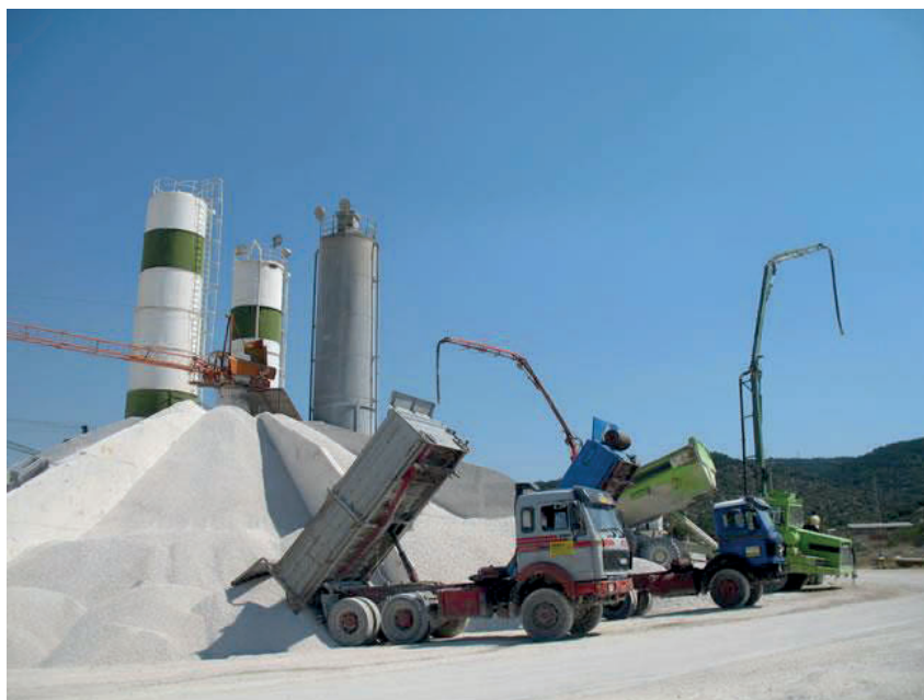
Slika 17. Betonara [17]