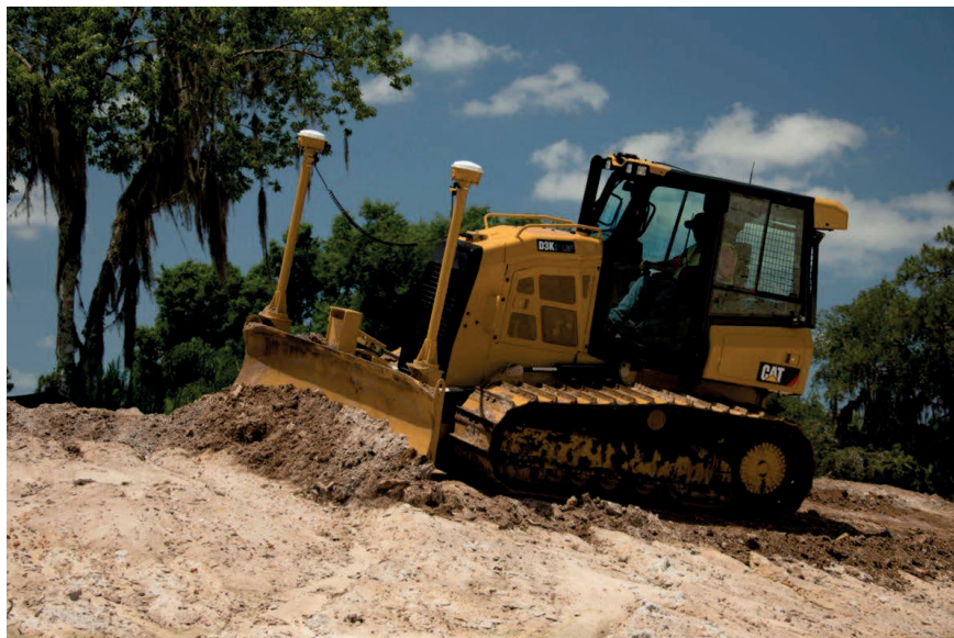
Slika 7. Buldozer CAT D3K2 [7]

Karakteristike dozera CAT D3K2 (Slika 5.):