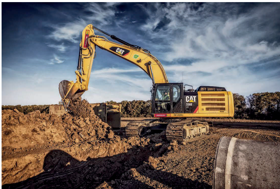
Slika 13. Iskop materijala jaružalom CAT 336 EL [13]

Iskop volumena u sraslom stanju od 1800\ m^3 se izvodi pomoću jaružala CAT 336 EL (Slika 11.) čija je zapremnina 1.5\ m^3 .