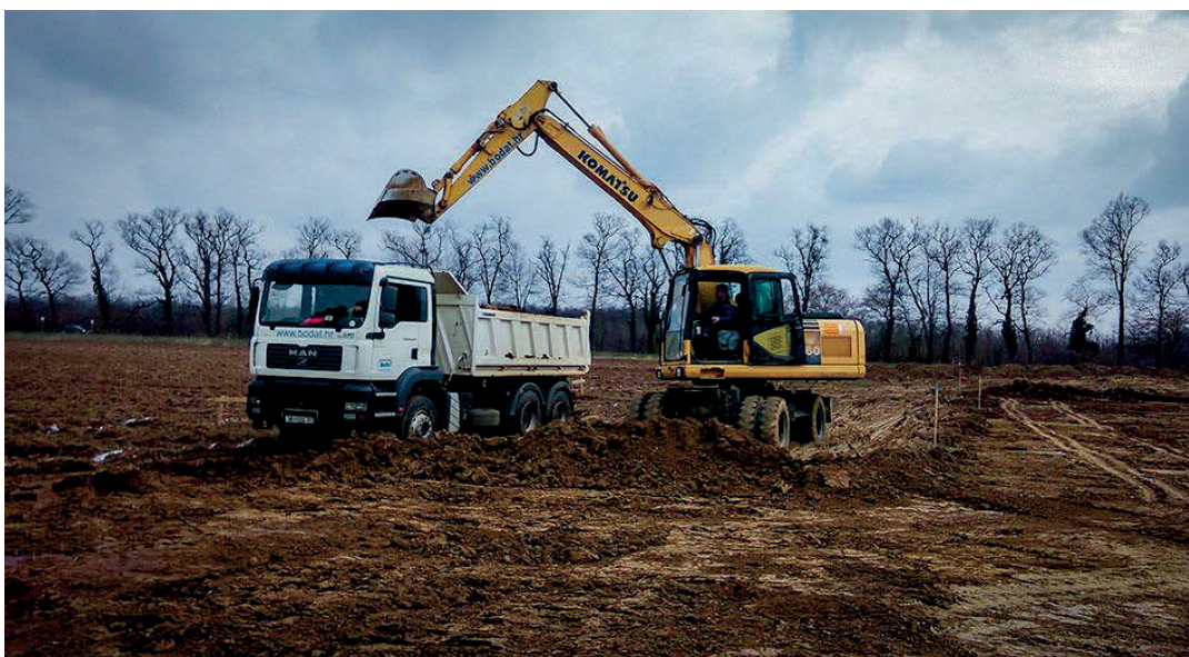
Slika 4. Usklađenost rada kamiona kiperu i jaružala [4]