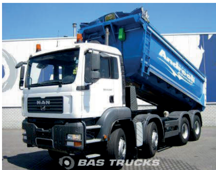
Slika 9. Kamion(kipper) MAN TAG 8×4 [9]

Skinuti materijal sa terena se pomoću utovarivača ukrcaje u kamion kiper MAN TAG (Slika 7.), te kamion kiper odvozi materijal na gradski deponij udaljen 2 km od gradilišta.