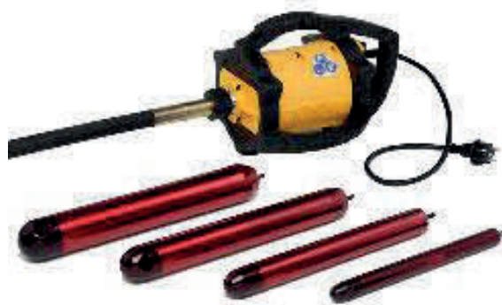
Slika 20. Pervibrator AMVU AX 58 [20]

Karakteristike pervibratora AMVU AX 58 (Slika 20.)