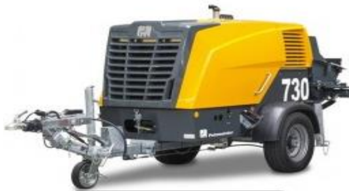
Slika 4.9 Pumpa za beton Putzmeister P730