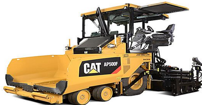
Slika 4.8 Finišer