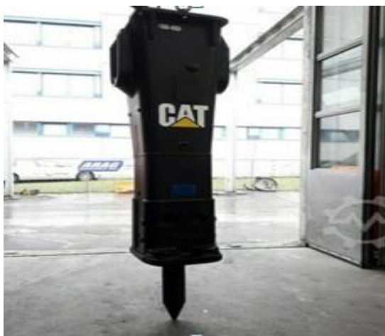
Slika 4.10. Pneumatski čekić,Caterpillar