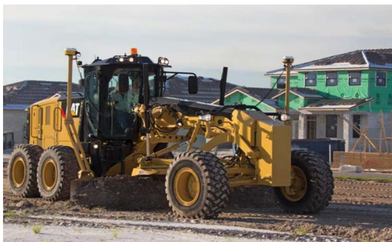
Slika 4.6 Grejder