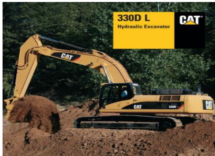
Slika 4.4 Jaružalo Cat 330 D L