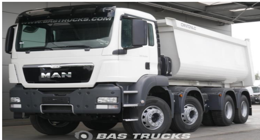
Slika 4.3 Kamion MAN TGS