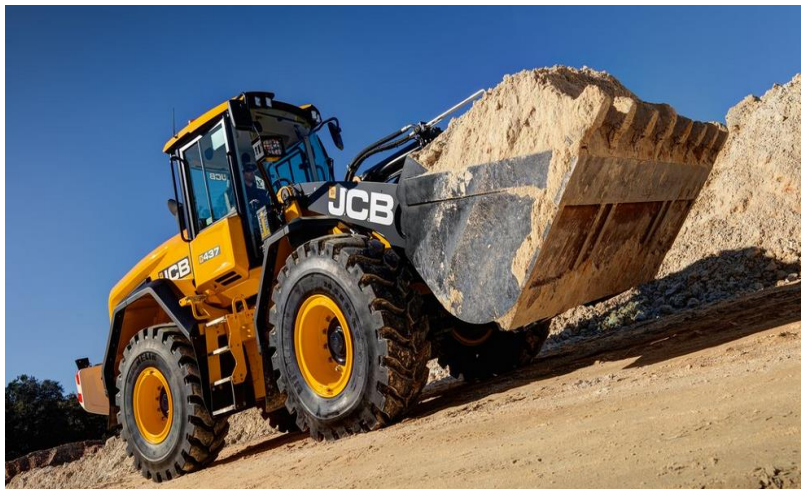
Slika 4.2 Utovarivač Cat 930K