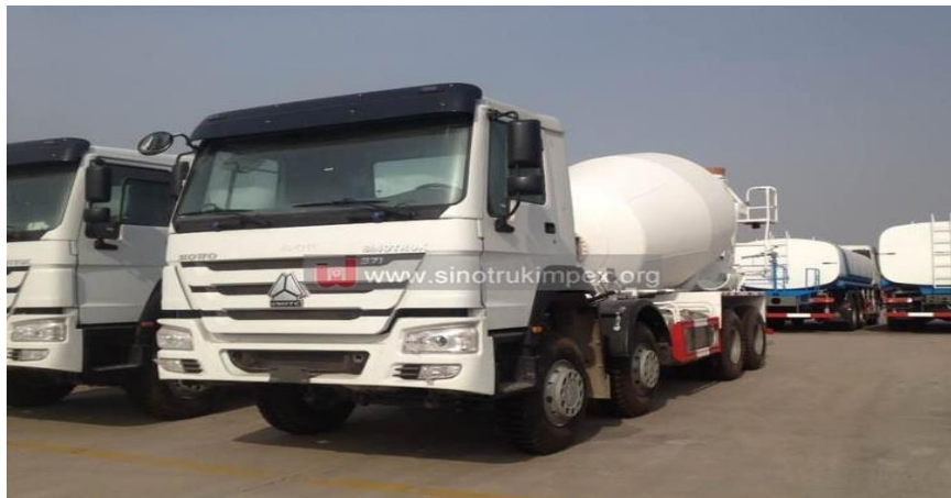
Slika 4.5 Kamion sa mješalicom za beton, Sinotruck serija HOWO