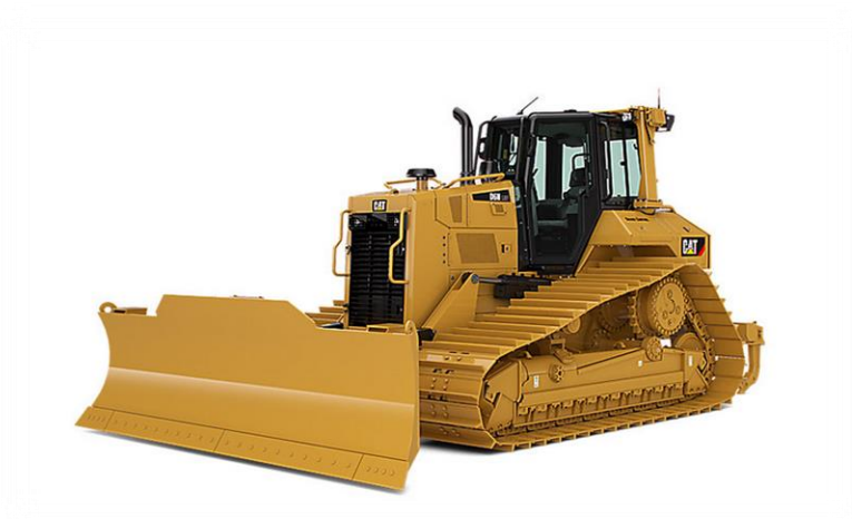
Slika 4.1 Dozer D6N