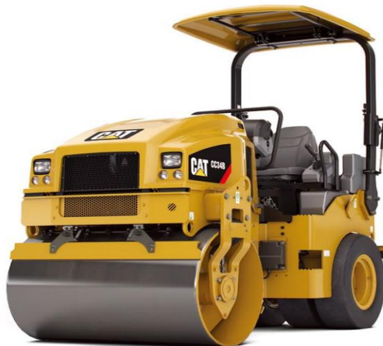
Slika 4.7 Valjak CAT