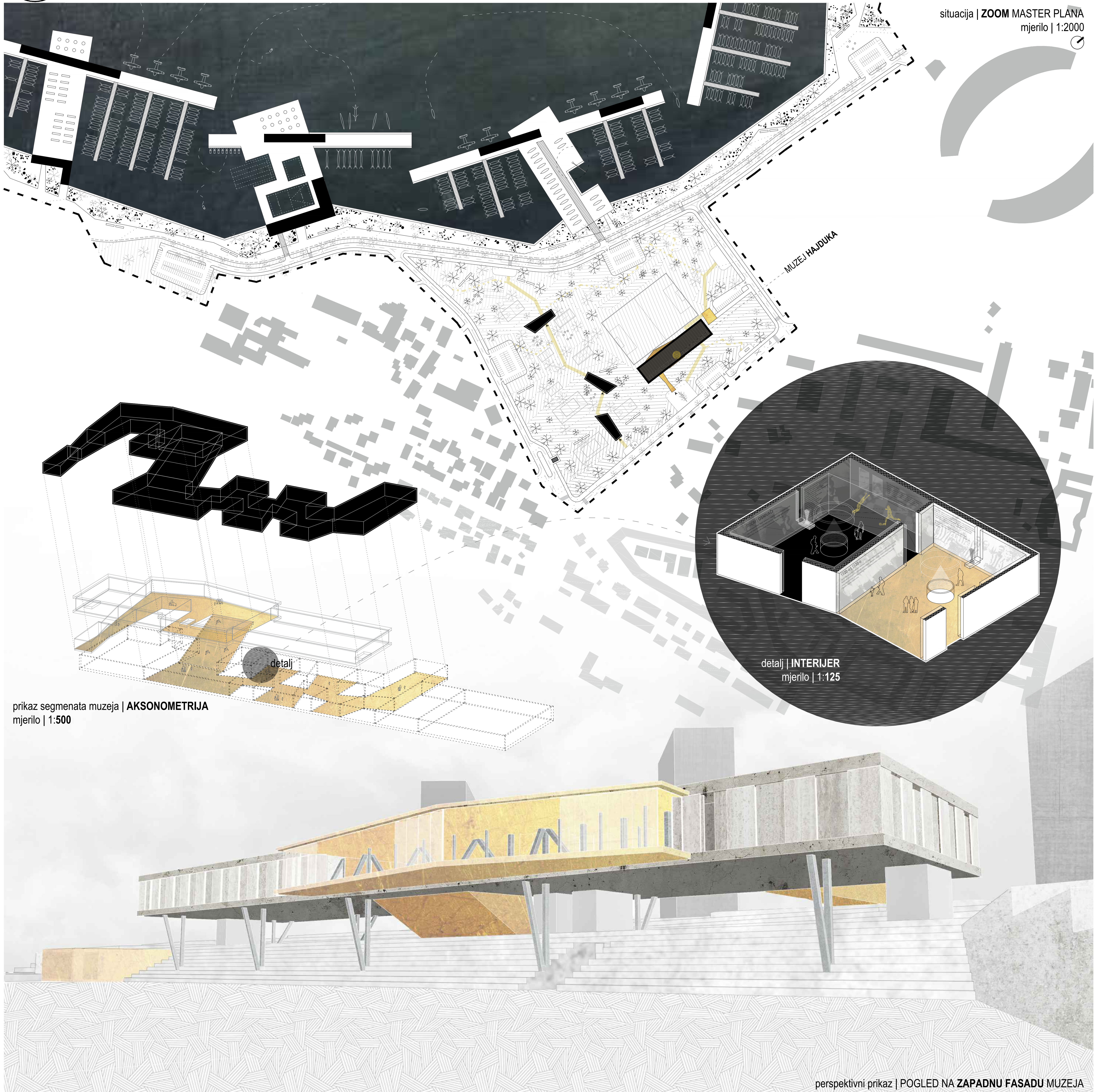
prikaz segmenata muzeja | AKSONOMETRIJA mjerilo | 1:500