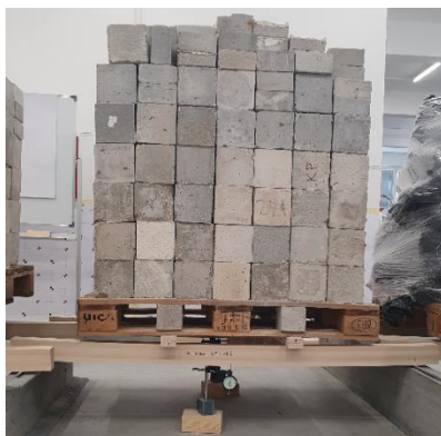
Slika 1. LLN opterećen silom od 0,3F_{max}