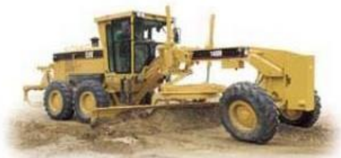
Slika 12, Grejder [12]