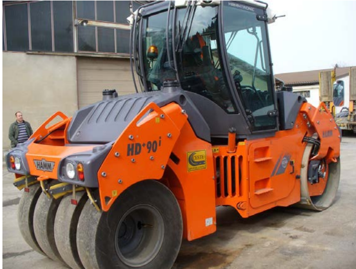
Slika 5: Valjak