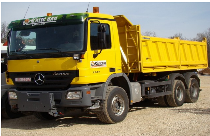
Slika 3: Transporter kiper