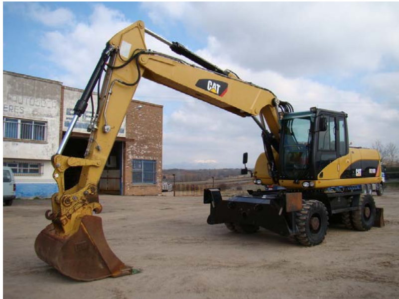
Slika 4: Jaružalo