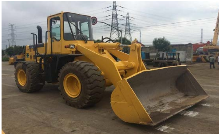
Slika 2: Utovarivač