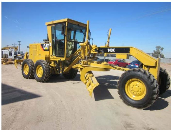
Slika 6: Grejder