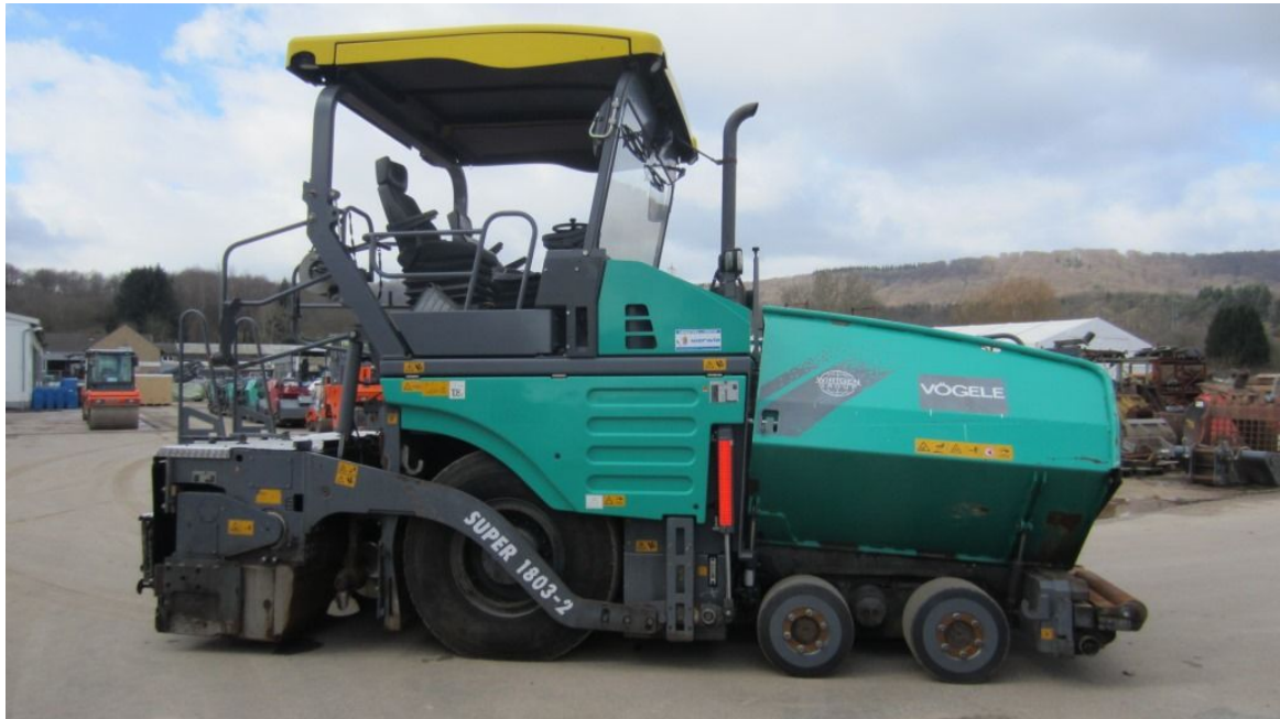
Slika 7: Finišer