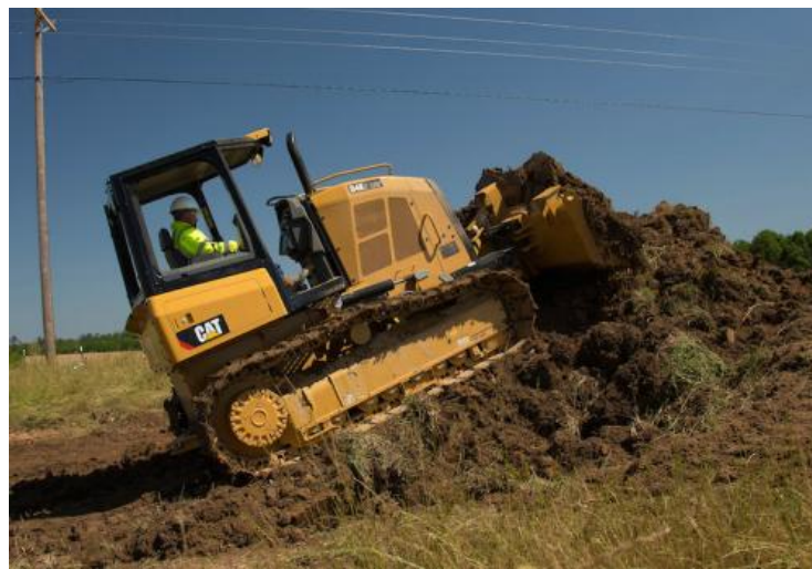
Slika 1: Buldozer