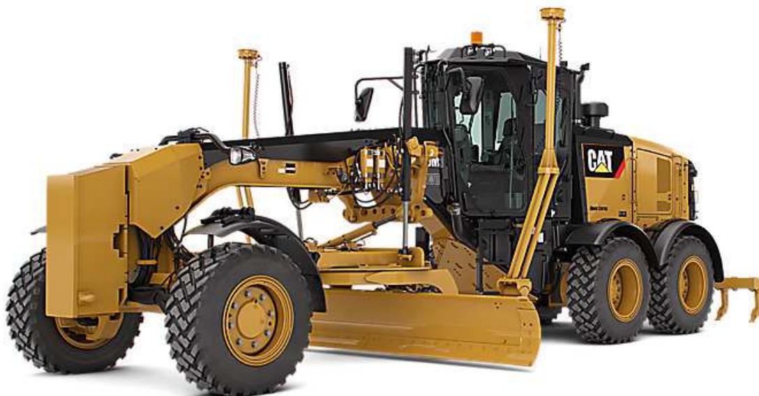
Slika 5.6: Grejder Caterpillar 160M3