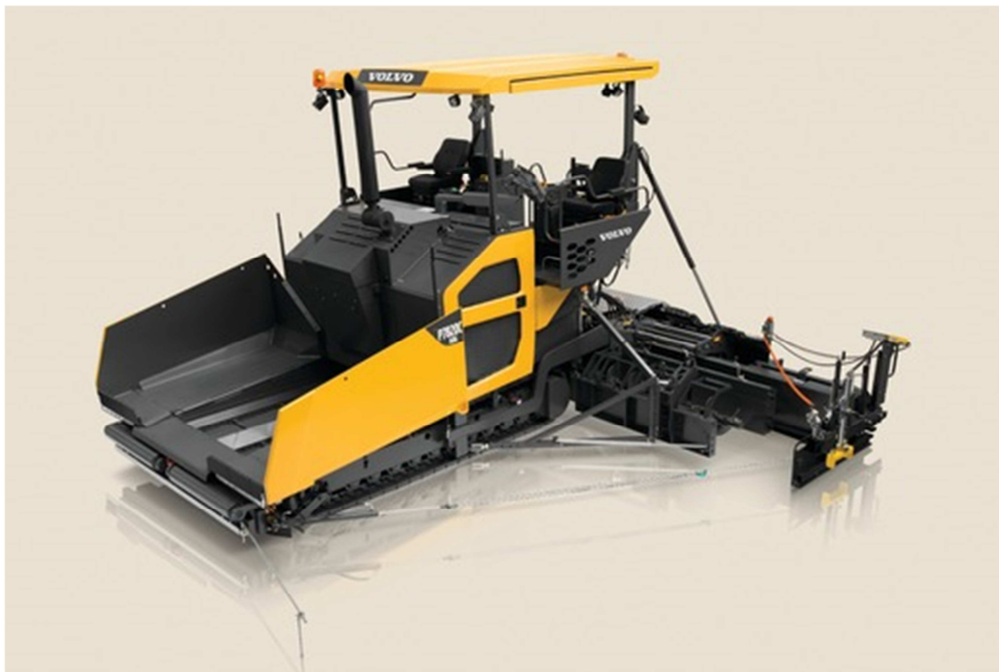
Slika 5.9: Finišer VOLVO P8820C ABG