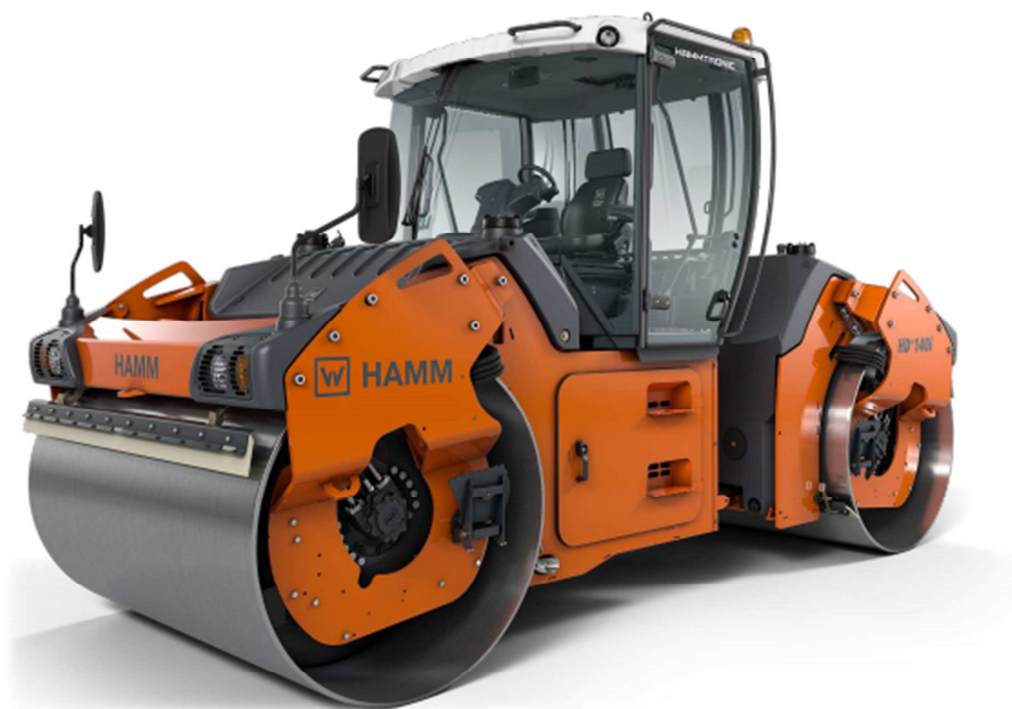
Slika 5.10: Valjak HAMM HD+140i VV

(izvor: https://www.hamm.eu/en/products/tandem-rollers/series-hd-tier-4/hd-140i-vv.182425.php )