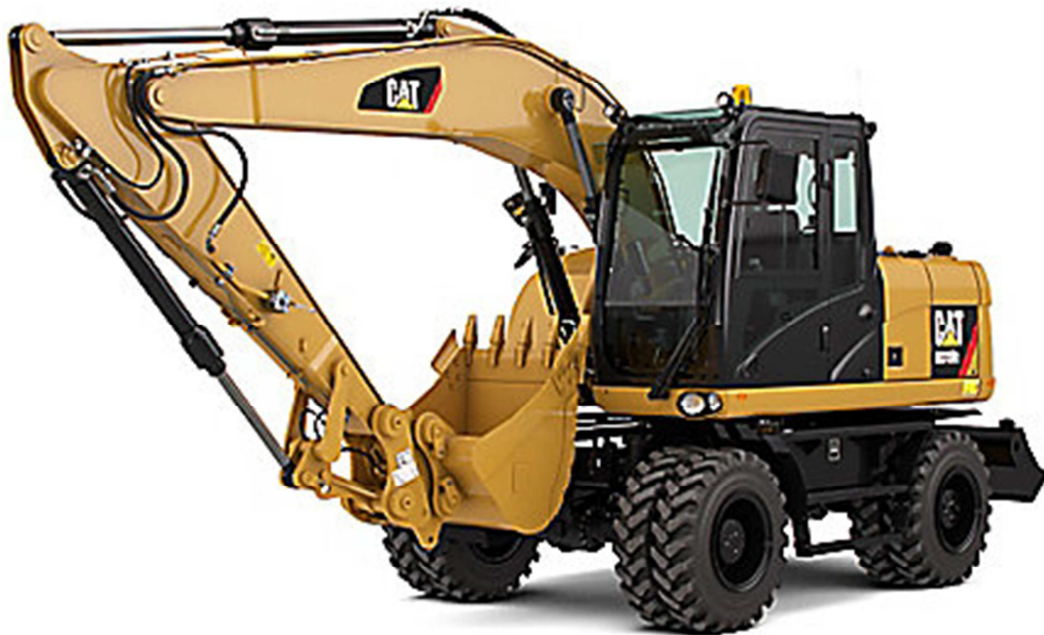
Slika 5.4: Jaružalo Caterpillar M316F