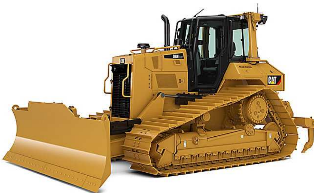
Slika 5.1: Buldozer Caterpillar D6N