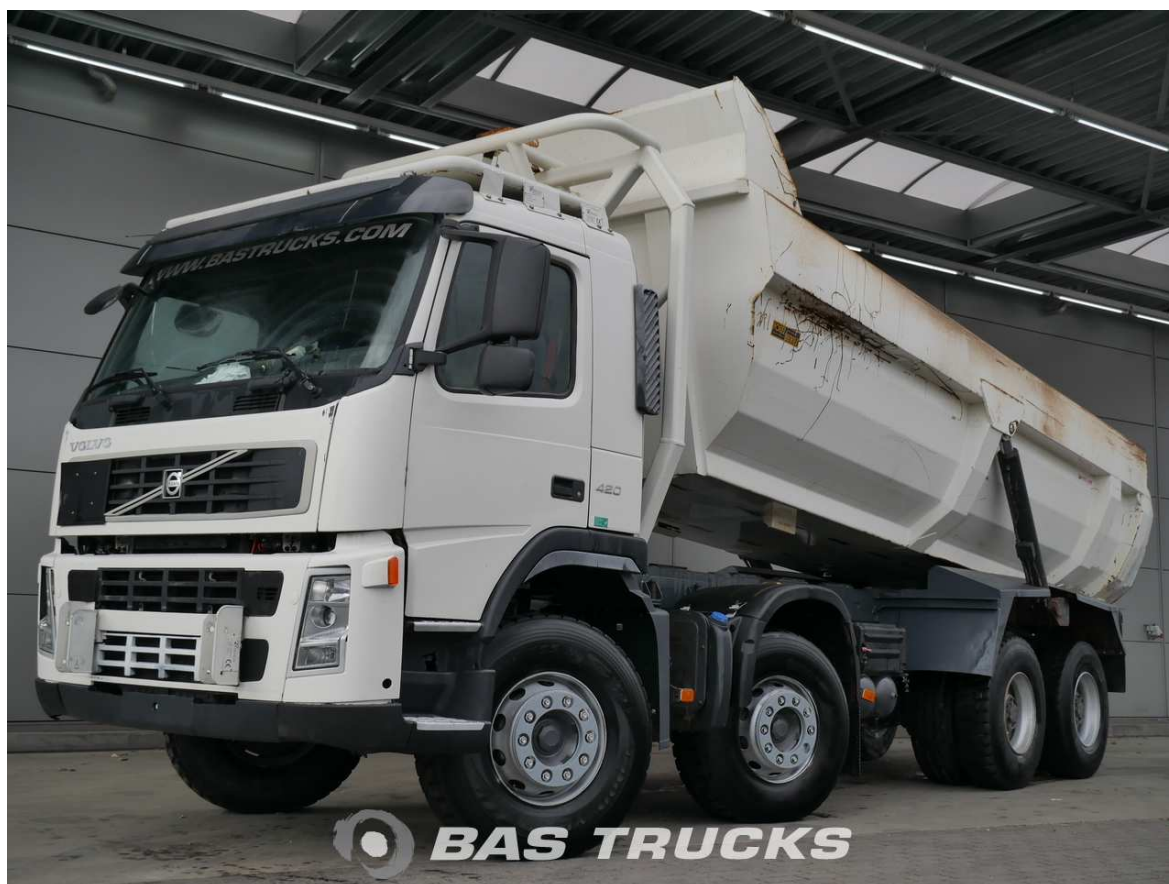
Slika 5.8: Kiper VOLVO FM 420 8x4