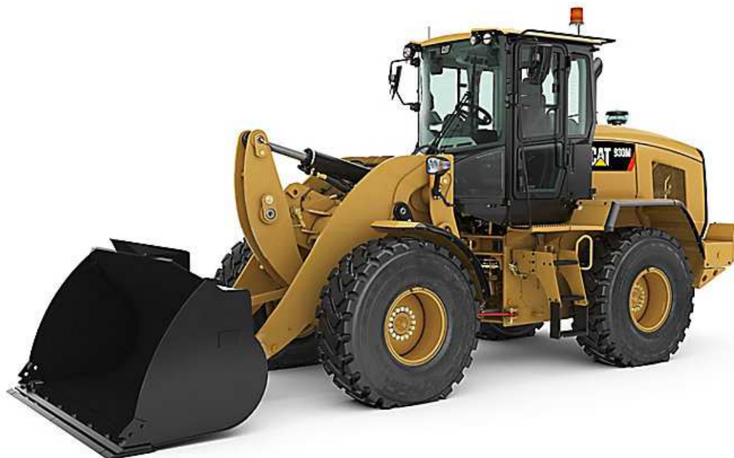
Slika 5.2: Utovarivač Caterpillar 930M