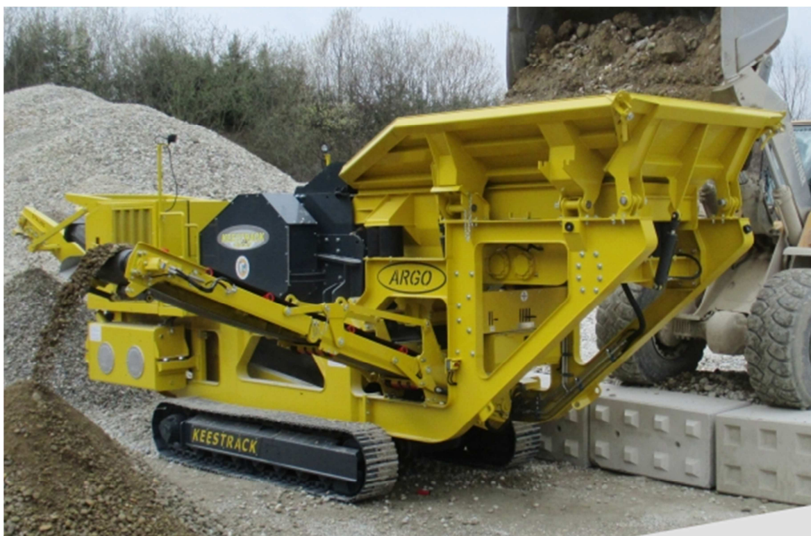
Slika 5.7: Mobilna čeljusna drobilica KEESTRACK Argo