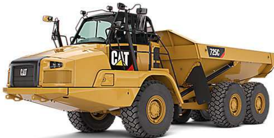
Slika 5.3: Damper Caterpillar 725C