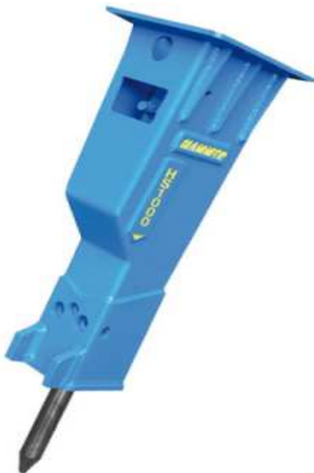
Slika 5.5: Hidraulički čekić Hammer HS 1000