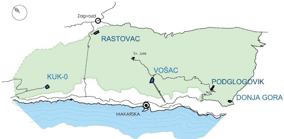
Slika 3. Prikaz analiziranih lokacija u PPB-u

U skladu s prostornim planom, na temelju analize odabrano je pet potencijalnih lokacija unutar PPB-a (Slika 3) i dan je prijedlog razvoja za dvije lokacije. U razmatranju potencijalnih lokacija u obzir je uzeto stanje prirodnog ambijenta, prometna povezanost, dopušteni opseg gradnje po Prostornom planu PPB-a te mogućnost priključka na energetska i vodovodna mreža. Istražene su i evidentirane atrakcije: prirodne atrakcije kao špilje i šume, arheološka nalazišta te povijesni graditeljski sklopovi (pastirska naselja i suhozidi). Pri odabiru lokacije razmatrani su i postojeći ugostiteljski kapaciteti.