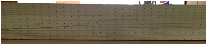
Slika 6. Uzorak S3