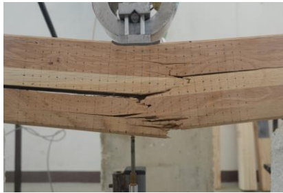
Slika 5. Uzorak S1