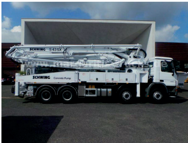
Slika 19. Mercedes Benz 3541B [19]

Karakteristike crpke Mercedes Benz 3541 (Slika 19.)