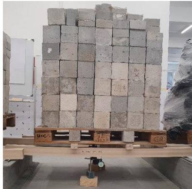
Slika 1. LLN opterećen silom od 0,3F_{max}