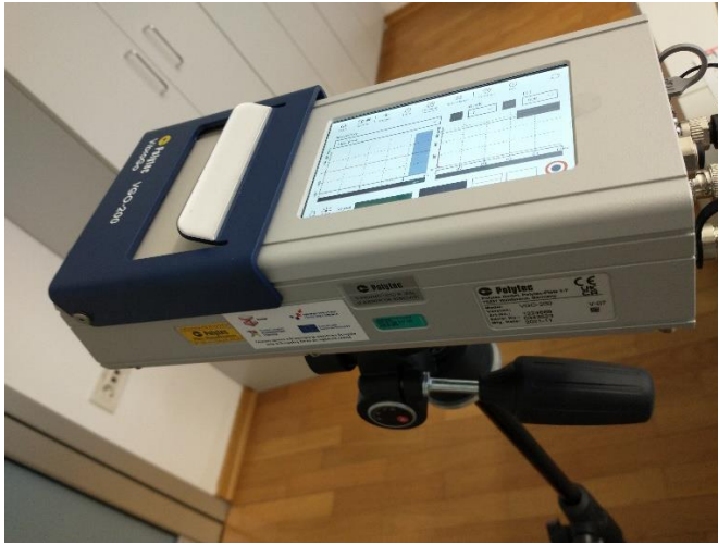
Slika 1. Laserski Doppler vibrometar