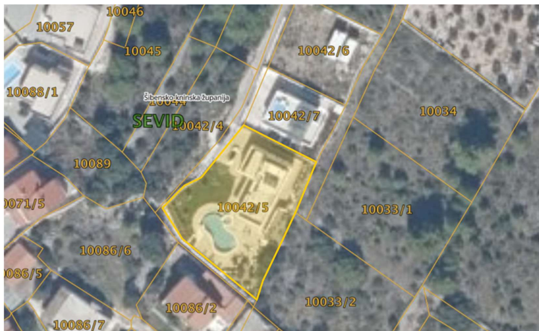
Slika 16. Kartografski prikaz položaja kuće

Kuća za odmor u funkciji je turističke vile za najam i nalazi se u naselju Sevid koje pripada Šibensko-kninskoj županiji. Vila se nalazi na kat.čest.10042/5 K.O. Sevid.