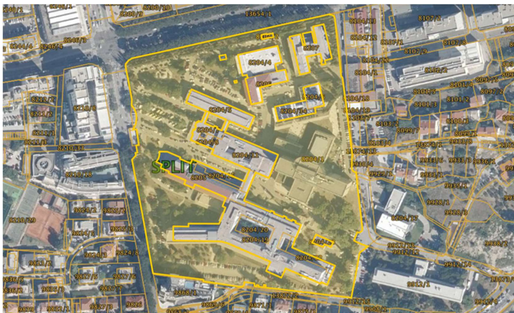
Slika 13. Kartografski prikaz položaja KBC

Ovaj projekt će biti jako zanimljiv za razmatranje na po završetku analize jer se razlikuje od ostalih. Jedini je u kojem se radi o sanaciji krova. Krov se mijenjao u potpunosti na dijelovima objekta.