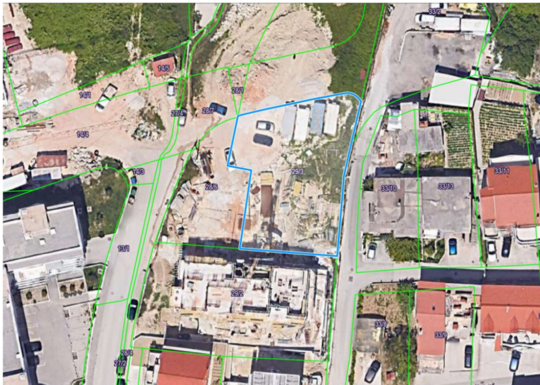
Slika 11. Kartografski prikaz položaja zgrade

Ova stambena građevina također je smještena u Splitu, na Barutani. Započeta je s gradnjom nakon što je zgrade A dobila svoj približno krajnji oblik. Zgrada se nalazi na kat. čest. 29/3.