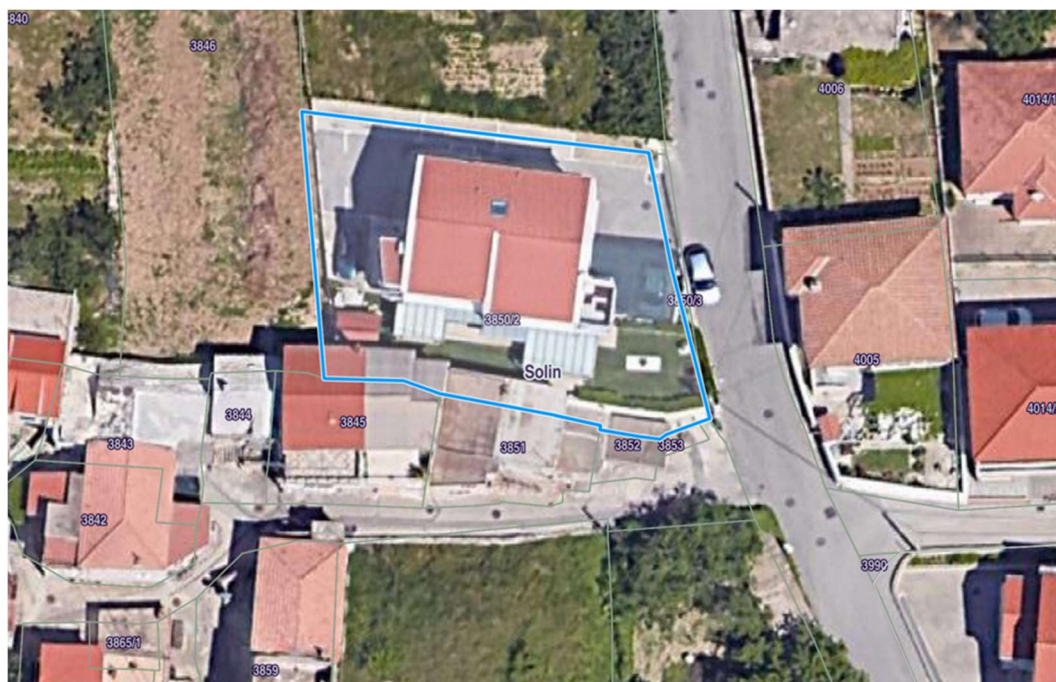
Slika 14. Kartografski prikaz položaja zgrade

Sljedeći projekt predstavlja manju stambenu zgradu koja se nalazi na kat. čest. 3850/2 u K.O. Solin na području Sv. Kaja. Vrlo atraktivna lokacija u okolici Splita i danas je puna novih gradilišta sa sličnim, manjim stambenim zgradama. Lokacija je privlačna kako zbog cijene, tako i zbog sadržaja koje ovo naselje kao dio Grada Solina nudi.