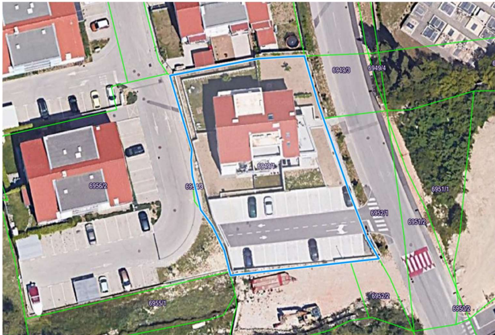
Slika 5. Kartografski prikaz položaja zgrade

Radovi na izgradnji ove zgrade započeli su 7.4.2020. Te godine cijeli svijet bio je pogođen pandemijom, pa je vrijeme gradnje bilo malo duže od predviđenog zbog procesa prilagodbe na nove uvijete rada. Kraj građenja definiran je datumom 6.4.2020.