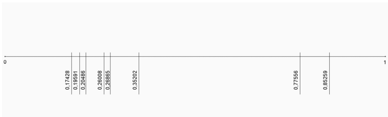
Slika 17. Prikaz rezultata na dužini od 0 do 1

Prvo i drugo rangirane alternative su P5 i P4. One su vrlo slične po načinu izvedbe i u stvarnosti su dio kompleksa od četiri približno iste stambene zgrade. Istaknute su ispred svih ostalih alternativa i razlika među ovom grupom i sljedećom po rangiranju je značajno velika. Potom slijedi alternativa P8 koja je u stvarnosti kuća za odmor. Vrlo blizu su alternative P3 i P2 koje su također slične jer se radi o manjoj stambenoj zgradi i kući za odmor. Nakon toga trebamo uočiti kako su P7 i P6 vrlo bliske te tako tvore sljedeću skupinu alternativa koje po ovoj analizi daju vrlo slične rezultate. Posljednje rangirana alternativa je prva koju smo analizirali u ovom procesu, P1, te nju definitivno isključujemo iz izbora za ulaganje u sljedeći projekt. Grafički prikaz rezultata koji se nalazi na slici ispod predočava grupiranje rezultata i bolje prikazuje veće i manje razlike među rezultatima. S lijeva na desno prikazani su rezultati analize po kojima je dobiven konačan rang.