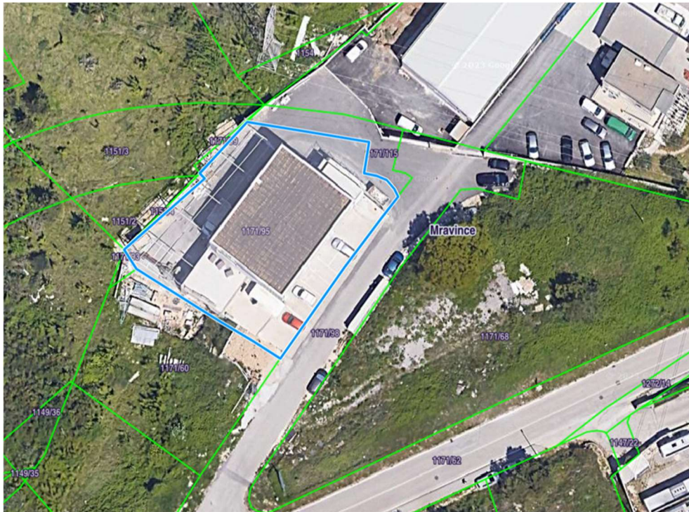
Slika 3. Kartografski prikaz položaja hale

Poslovna zgrada koja se koristi kao pogon za rad u vlasništvu je tvrtke koja je koristi i nalazi se u Mravincima, pored Solina. Zemljište na kojem je izgrađena hala pripada K.O. Mravince i identificira se kao kat. čest. 1171/95.