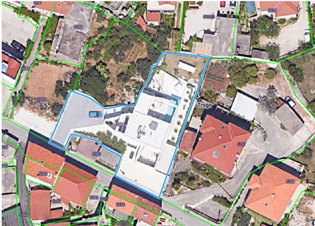
Slika 7. Kartografski prikaz položaja kuće

Stambena građevina smještena je u Trogiru na kat. čest. 5084. Projekt je koncipiran kao rekonstrukcija jer je na čestici postojala građevina koja nije zahtijevala adaptaciju već je potrebna bila samo rekonstrukcija i nadogradnja.