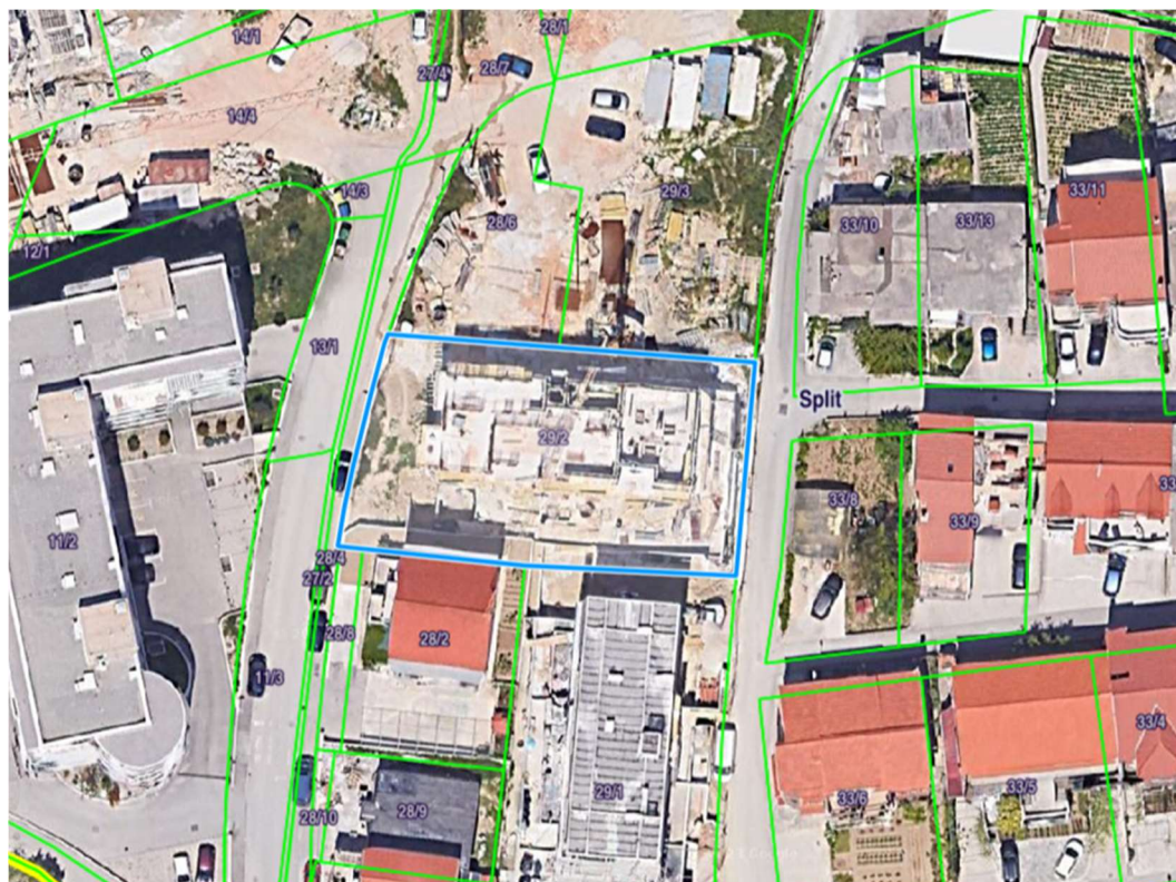
Slika 9. Kartografski prikaz položaja zgrade

Stambena građevina smještena je u Splitu, na Barutani, kat. čest 29/2. Zgrada je dio projekta koji je zamišljen kao 4 stambene zgrade u nizu. Zgrada A jedina je orijentirana u smjeru okomito na zgradu B.