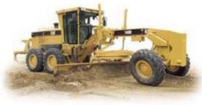
Slika 12, Grejder [12]