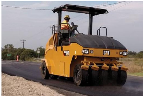
Slika 14. Valjak na kotačima s gumama [14]