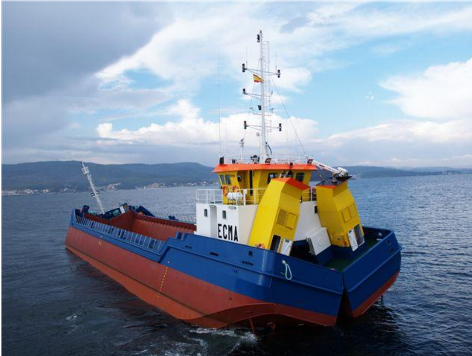
Slika 4.8: Plovna teglenica ECMA