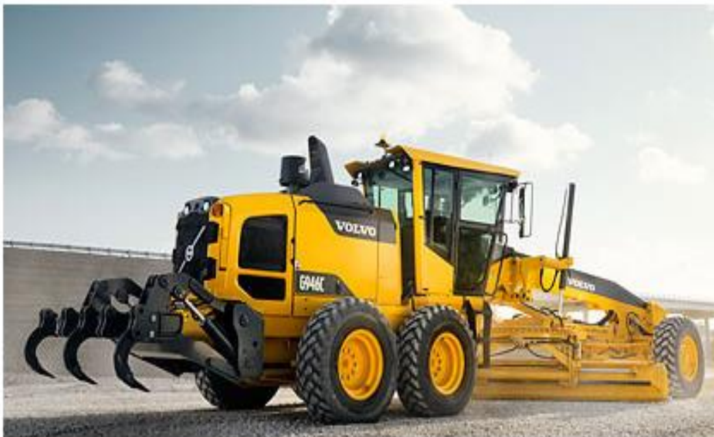
SLIKA 3.2 Grejder Volvo G-900