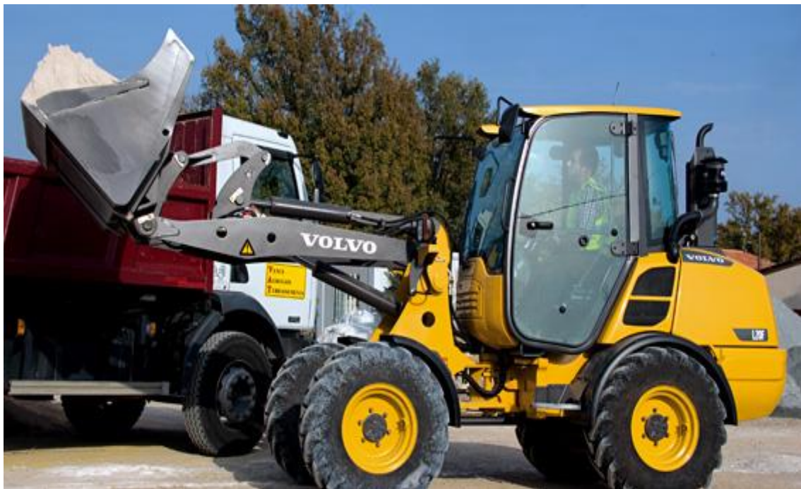
SLIKA 3.3 Utovarivač Volvo L20F