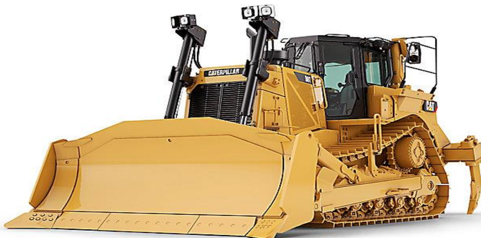
SLIKA 3.1 Buldozer Cat®C15 ACERT™