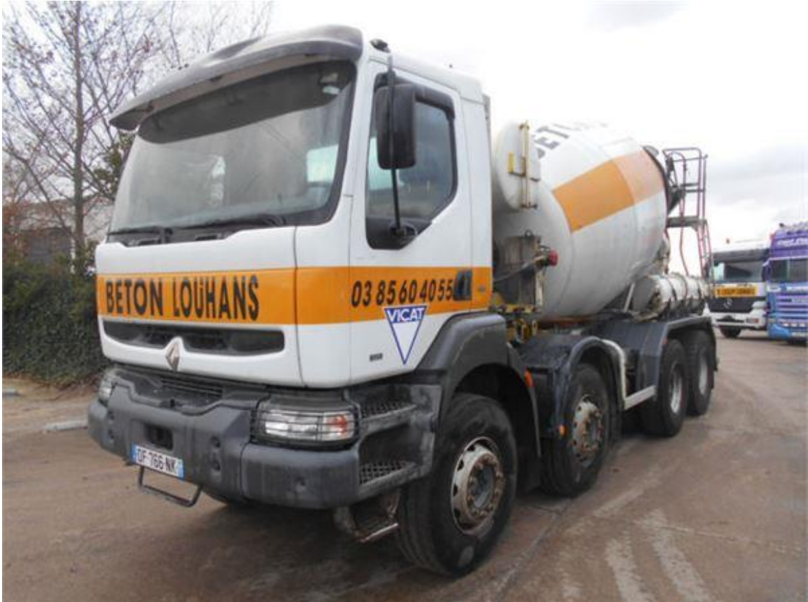
SLIKA 3.7 Automješalice Renault Kerax 385