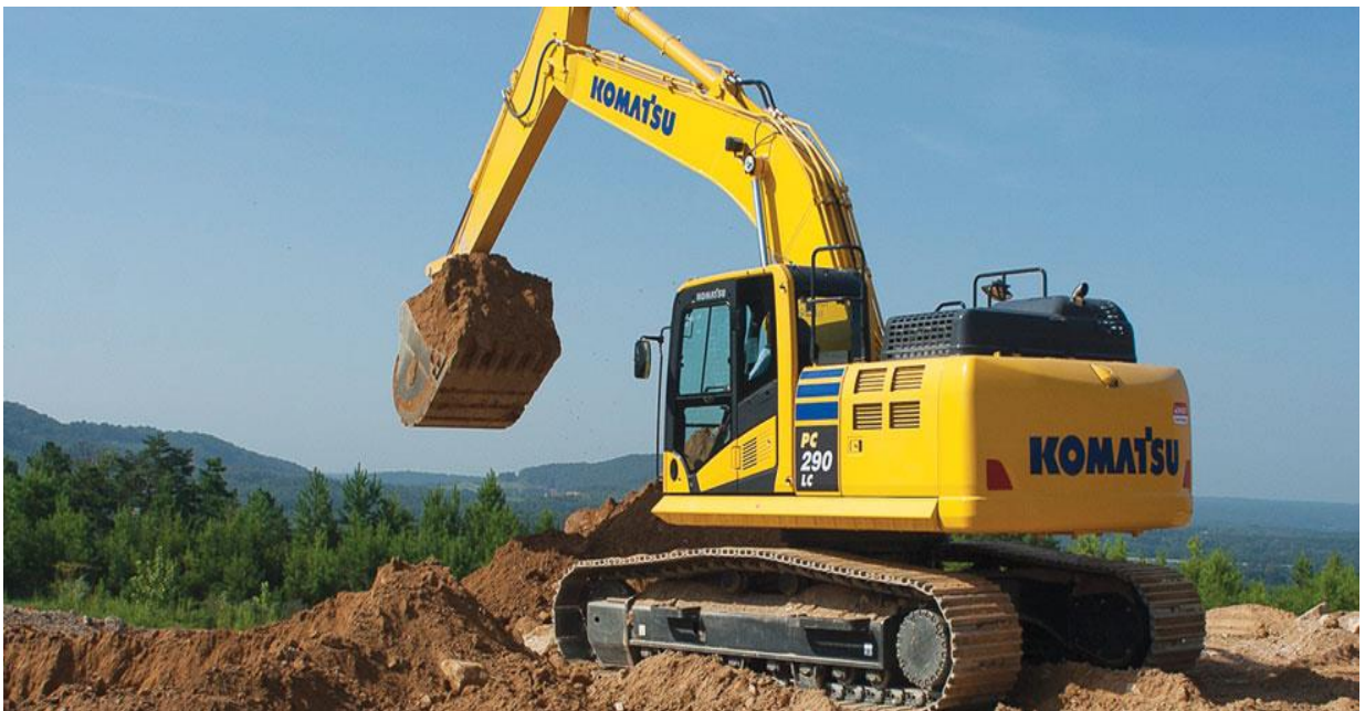
SLIKA 3.5 Jaružalo Komatsu PC290LC-11