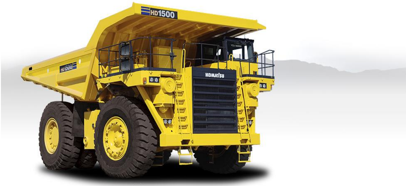
SLIKA 3.4 Kamion kiper HD 1500-7