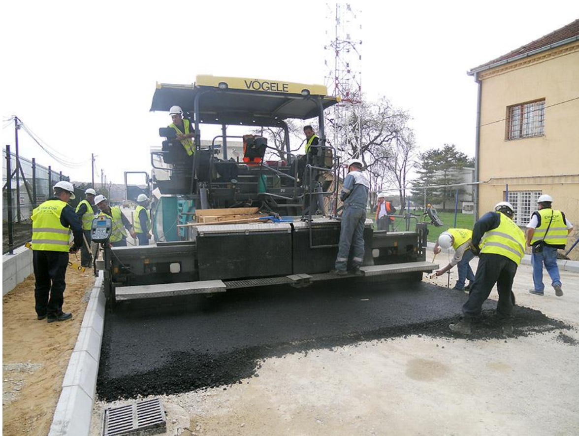
SLIKA 3.8 Finišer