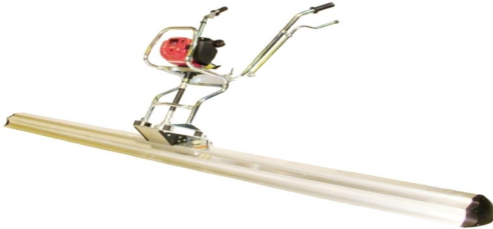
SLIKA 3.6 Vibroletva