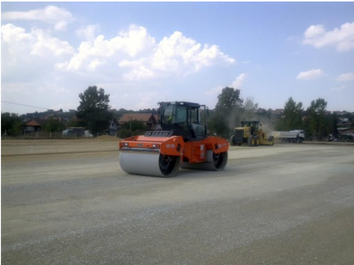
SLIKA 3.9 Valjak