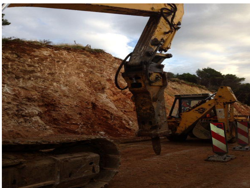
Slika 6.2 upotrijebljeni hidraulički čekić

( http://www.balavto.com.hr/hidraulicni_cekici_bat )