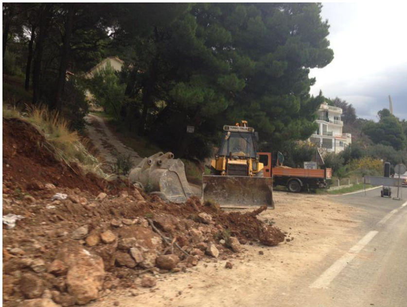
Slika2.6 utovarivač Komatsu težine 10 tona