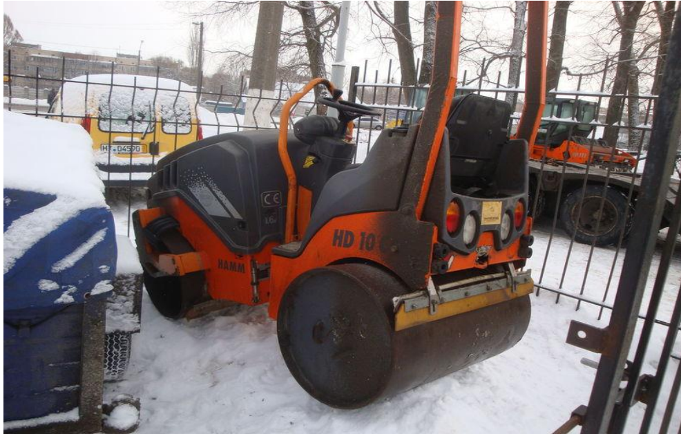
Slika2.8 valjak HAMM s vibro pločom

http://autoline-eu.rs/sf/gradevinske-masine-mali-valjak-HAMM-HD10-CV--13052416154347321200.html