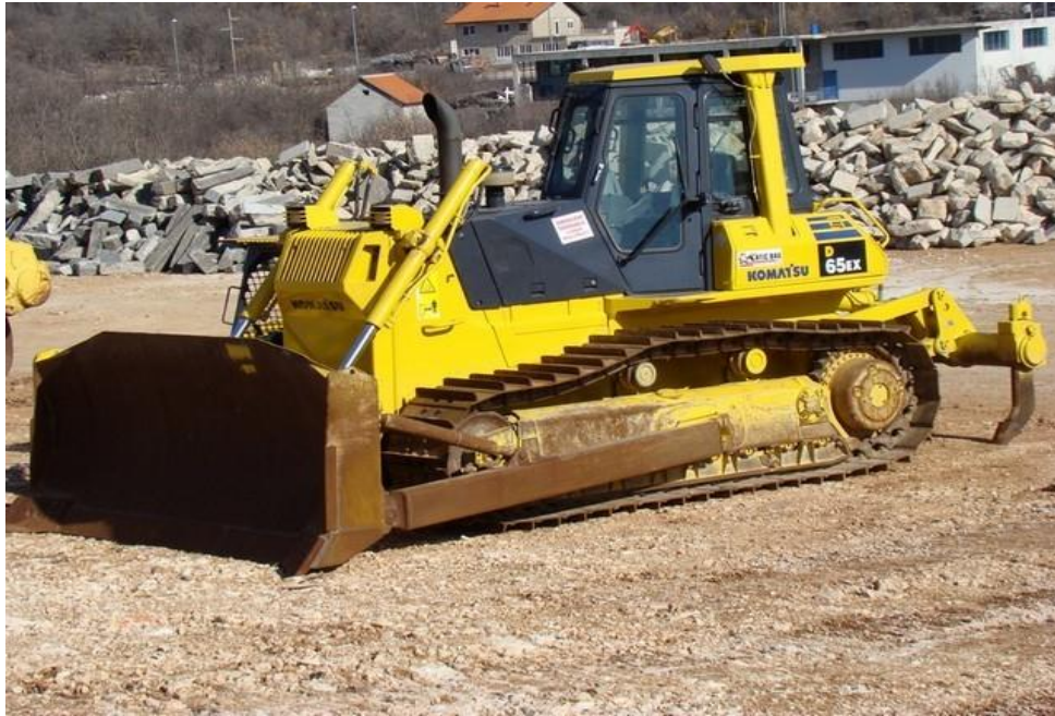
Slika 2.7 buldožer Komatsu