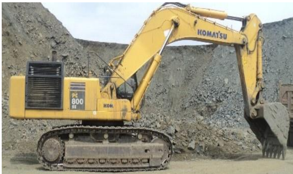
Slika 2.1 bager Komatsu PC800

https://www.google.hr/search?hl=hr&site=img&tbm=isch&source=hp&biw=1280&bih=632&q=bager+Komatsu+PC+800&oq=bager+Komatsu+PC+800&gs_l=img.3...2097.26182.0.26604.20.14.2.0.0.0.163.1483.3j11.14.0...0...1ac.1j2.43.img..10.10.990.gXBBJOH-qgA#imgdii=)