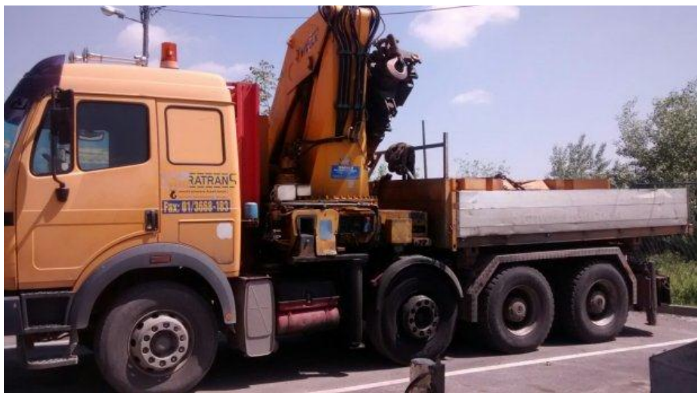
Slika 2.13 kamion s kranom 16 m

( http://www.njuskalo.hr/kamioni-tegljaci/kamion-kranom-oglas-11511948 )