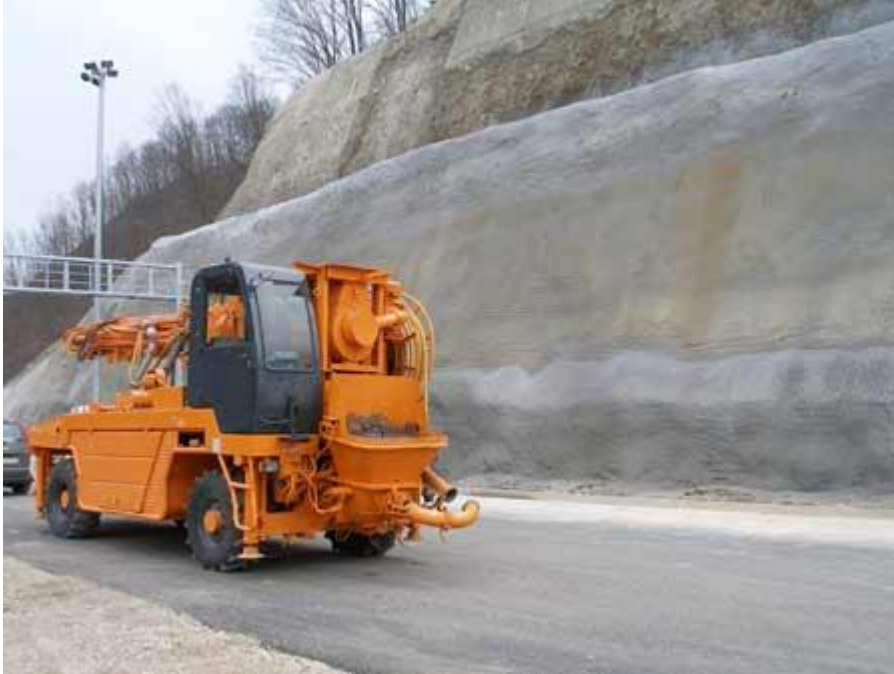
Slika 4.4 pumpa za prskanje betona

( http://www.gradimo.hr/clanak/uredaji-za-izradu-mlaznog-betona/21007 )