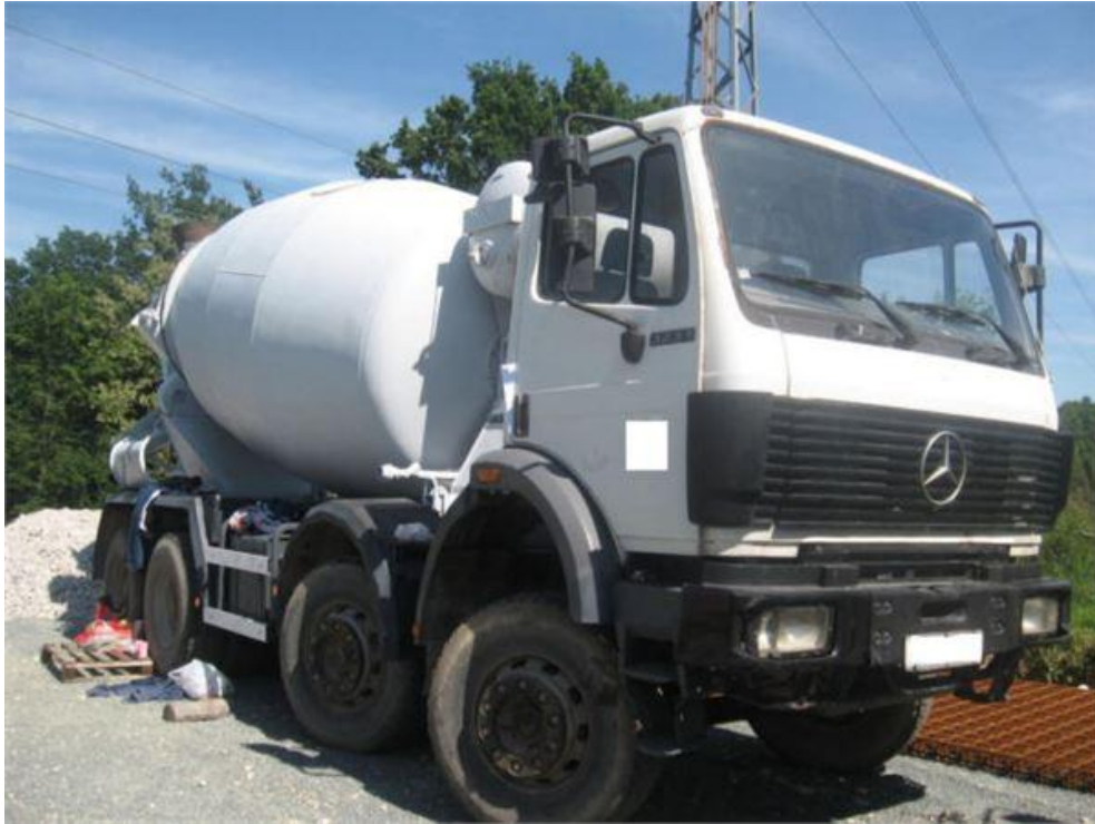
Slika 4.5 auto miješalica Mercedes-Benz 3234

( http://www.mascus.hr/transport/auto-mjesalica/mercedes-benz-3234/images/drmogx8p.html )