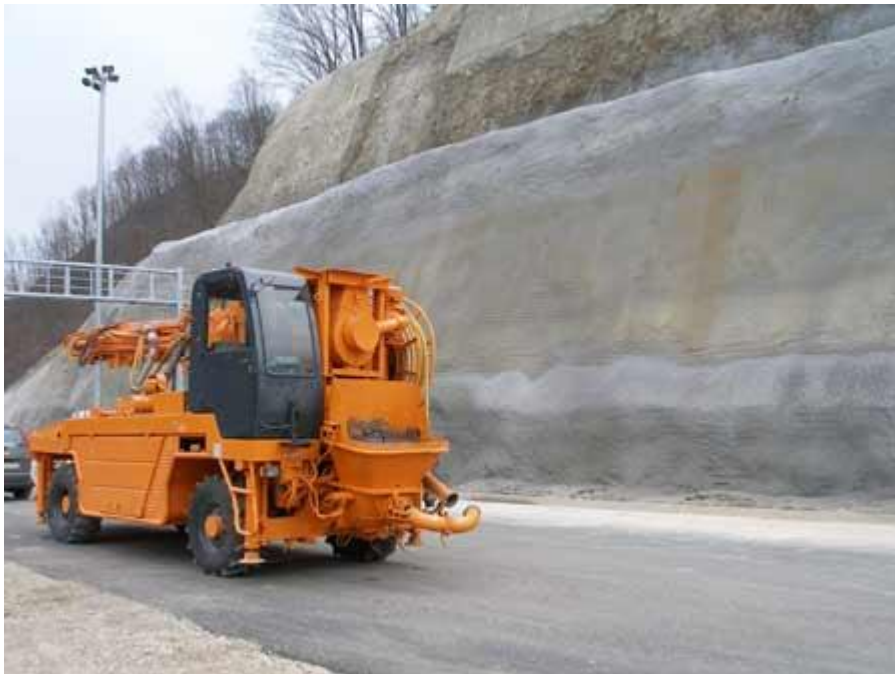
Slika 4.4 pumpa za prskanje betona

( http://www.gradimo.hr/clanak/uredaji-za-izradu-mlaznog-betona/21007 )