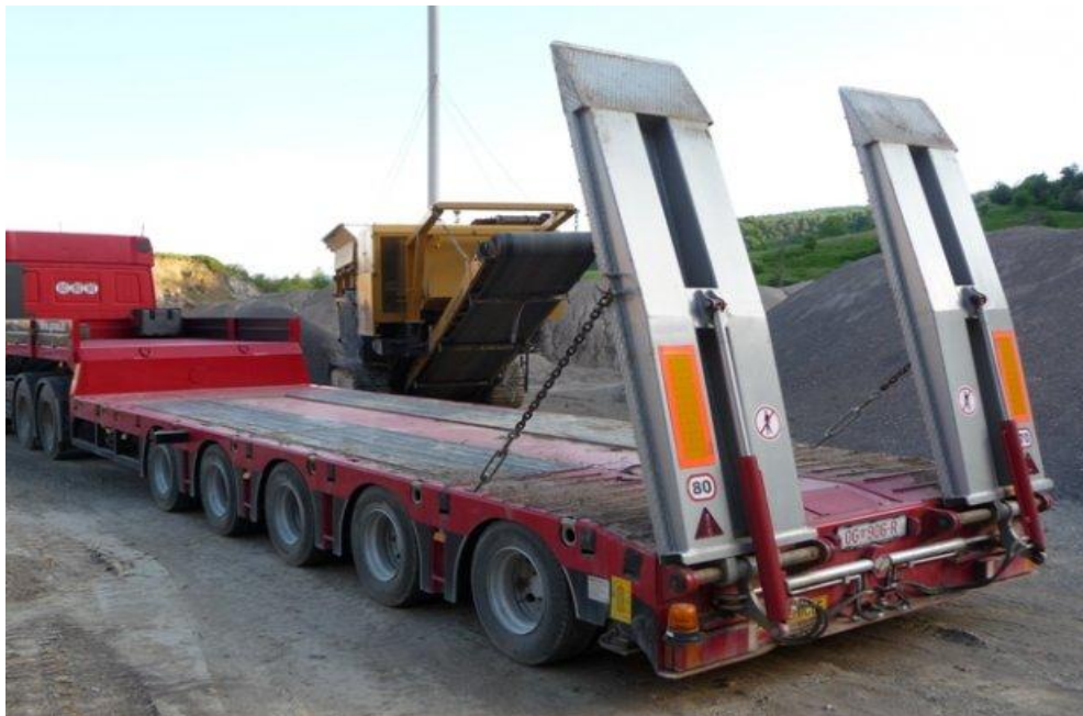
Slika 2.13 labudica od 30 tona nosivosti

( http://www.njuskalo.hr/kamioni-tegljaci/labudica-yuksel-oglas-2540022 )