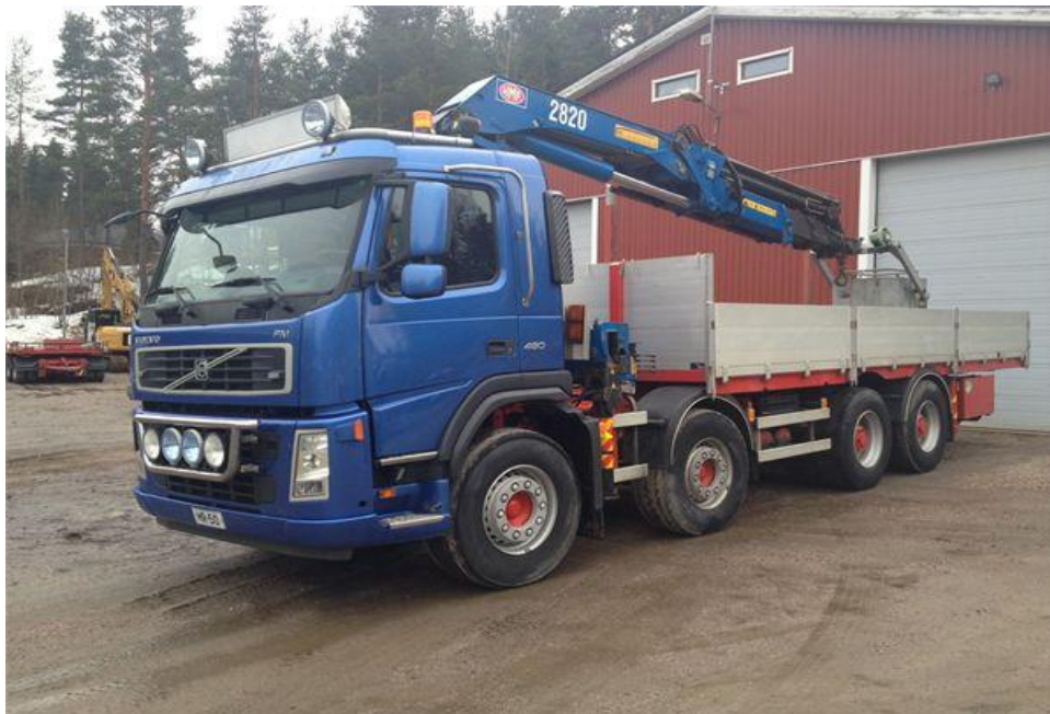
Slika 2.10 kamion VOLVO FM 13