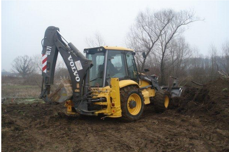
Slika 2.5 kombinirani stroj-volvo BL71

( http://www.njuskalo.hr/gradevinska-mehanizacija/volvo-bl-71-2003-god-oglas-2610525 )