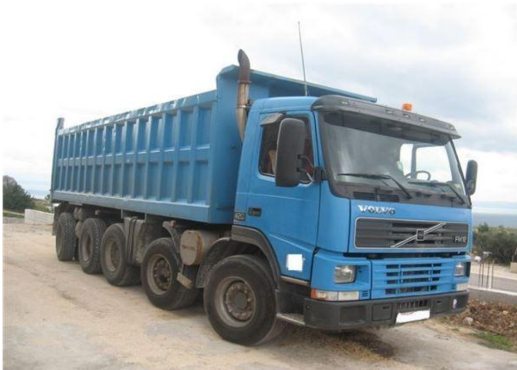
Slika2.9. kamion VOLVO FM 12

- kamioni Volvo FM 12 I FM 13 (slika2.9 i slika 2.10)