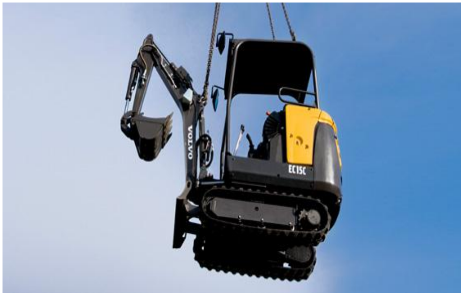
Slika 2.4 minibager

( http://www.goglas.com/frame?eid=53210624&q=slicni:2773481%20VOLVO%20bager )