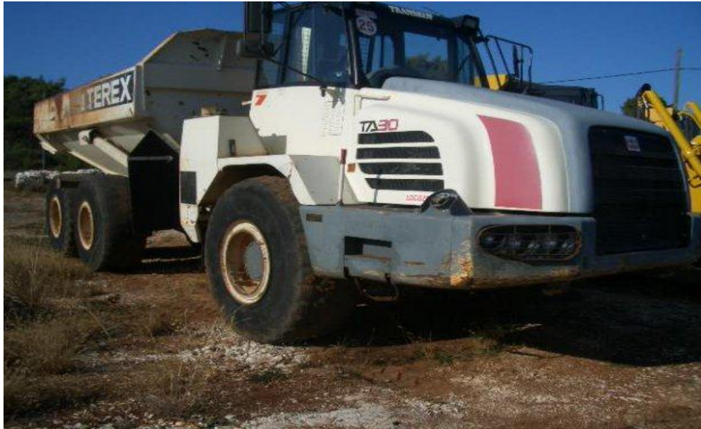
Slika2.11 kiper damperTirex TA 30

( http://www.njuskalo.hr/demperi/demper-terex-ta-30-oglas-3933038 )