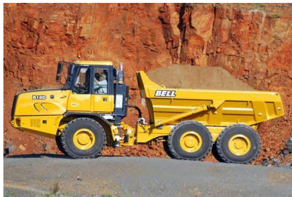
Slika 2.3. Kamion Bell B18D