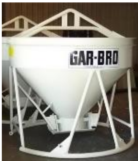
5.2. Košara za beton GAR –BRO 483-R

→ 1 Pumpa za beton Schwing S 24 X ( Slika 5.3. )