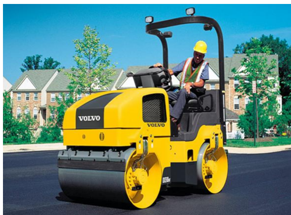
Slika 5.1. Valjak Volvo DD38HF