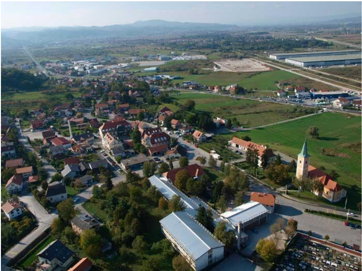
Slika 1.1. Prigradsko naselje gdje će se izgraditi objekt

Dan je mrežni plan kojim je grafički prikazana dinamika izvođenja radova, pomoću dijagrama koji se sastoji od niza podaktivnosti koje su međusobno povezane.