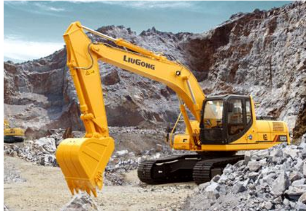
Slika 2.4. Jaružalo Liu Gong CLG920D