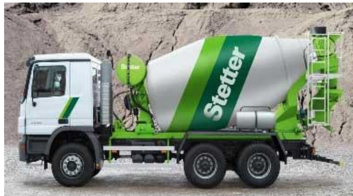
Slika 2.6. Automješalica Stetter F4L914