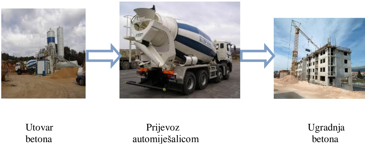
Slika 4.2. Shema korištenja strojeva za betonske radove

Betoniranje podne ploče, te vertikalnih i horizontalnih serklaža vrši se pomoću dizalice za beton i košare, jer je objekt visine 14 metara, pa je to najpovoljnije rješenje za dopremanje betona na te visine. Beton se doprema automiješalicom iz betonare udaljene 8 km od objekta. ( Slika 4.2.)