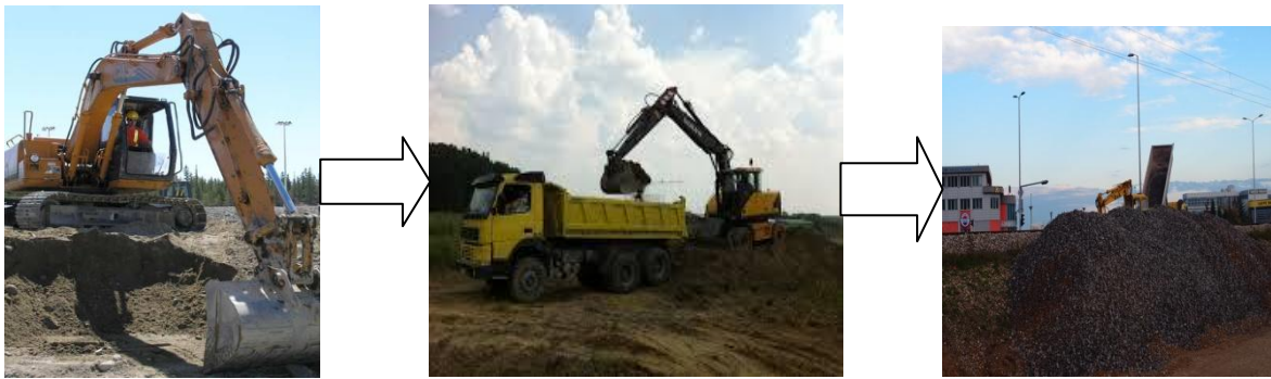
Široki iskop materijala

Skidanje humusa u debljini od 20 cm vrši se buldozerom , a odvoz materijala na deponij I udaljen 5km od gradilišta vrši se kamionom. Široki iskop tla kategorije III. obavlja se jaružalom malog obujma košare, tj. nema potrebe za većim kapacitetom iz razloga što su u pitanju manji zemljani radovi dubine iskopa 1,1 metar. ( Slika 4.1. )