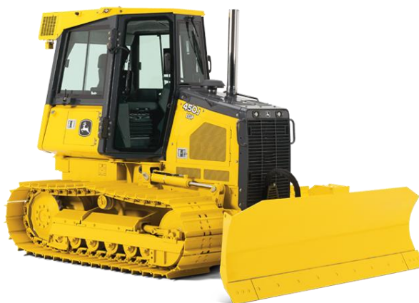
Slika 2.1. Buldozer John Deere 450J LT ( T3)