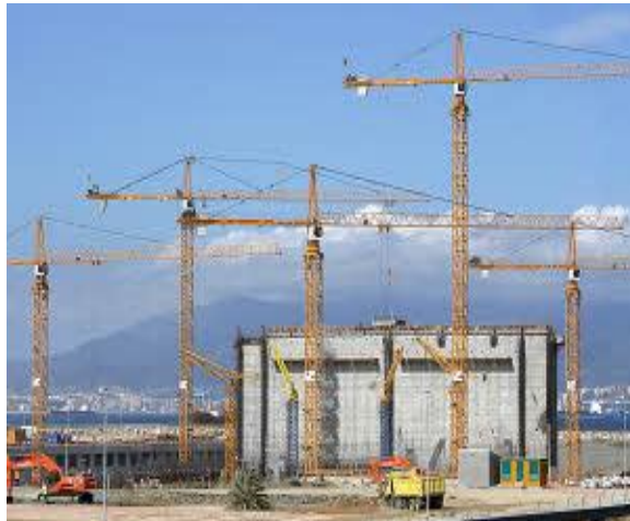
Slika 2.7. Toranjska dizalica Liebherr 200EC-H 10 FR.TRONIC

→ 1 Košara za beton BAR-BRO 483-R ( Slika 2.8. )