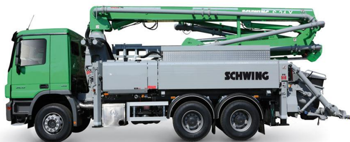
Slika 5.3. Pumpa za beton Schwing S 24 X