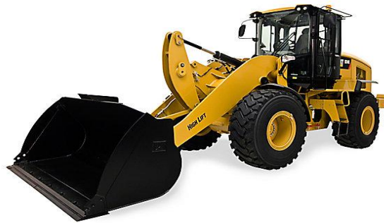
Slika 2.2. Utovarivač Cat 924K