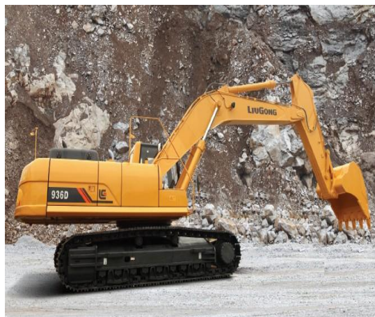
Slika 2.5. Jaružalo Liu Gong CLG936 D