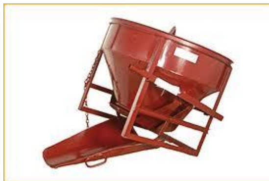
Slika 2.8. Košara za beton BAR-BRO 483-R