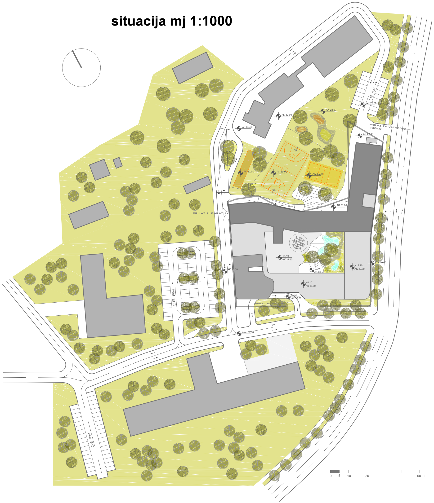
situacija mj 1:1000