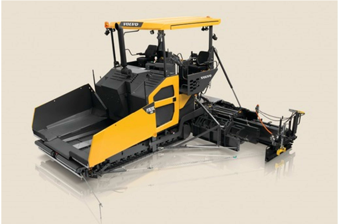
Slika 5.9: Finišer VOLVO P8820C ABG