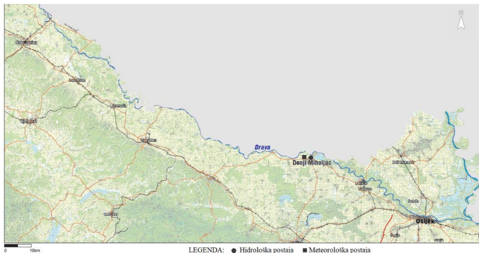
Slika 1. Prikaz rijeke Drave s analiziranom postajom Donji Miholjac

Područje istraživanja smješteno je u donjem toku rijeke Drave na mjestu hidrološke postaje Donji Miholjac (Slika 1). Prema Uredbi o standardu kakvoće voda (NN 73/2013), rijeka Drava je klasificirana kao nizinska vrlo velika tekućica koja ulazi u Hrvatsku kod Dubrave Križovljanske, ulijeva se u Dunav kod Aljmaša. Ukupne je dužine 725 km, od čega je 323 km u Hrvatskoj. Riječni režim Drave je pluvijalno-glacijalnog karaktera, s visokom vodostajima u proljetno-ljetnom razdoblju tijekom svibnja i lipnja, a najmanji vodostaji su u zimskom razdoblju u siječnju i veljači [2].