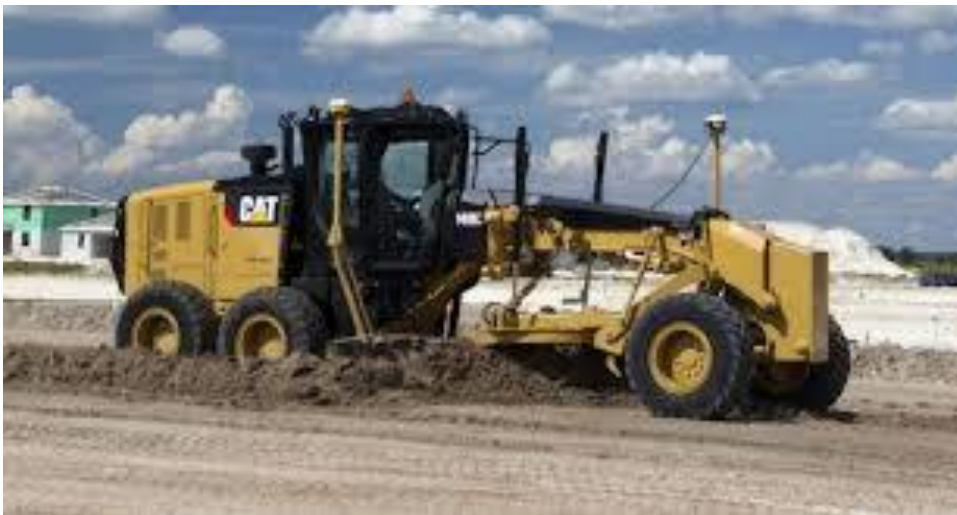
Slika 1.14 Grejder Caterpillar 12 M3/12 M3 AWD