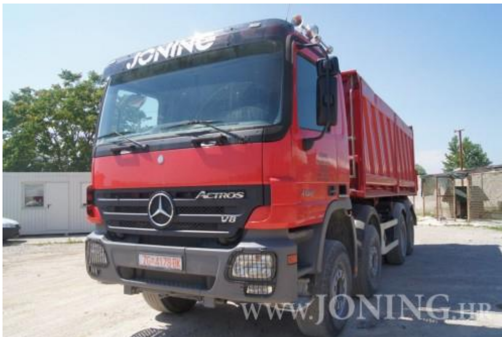
Slika 1.13 Kamion kiper Mercedes actors 4150

(izvor http://www.joning.hr/prodaja-kamioni-radni-strojevi-bageri-poluprikolice/kamioni/mercedes-benz-actros-4150-v8-kiper-8x4-909-116.html )