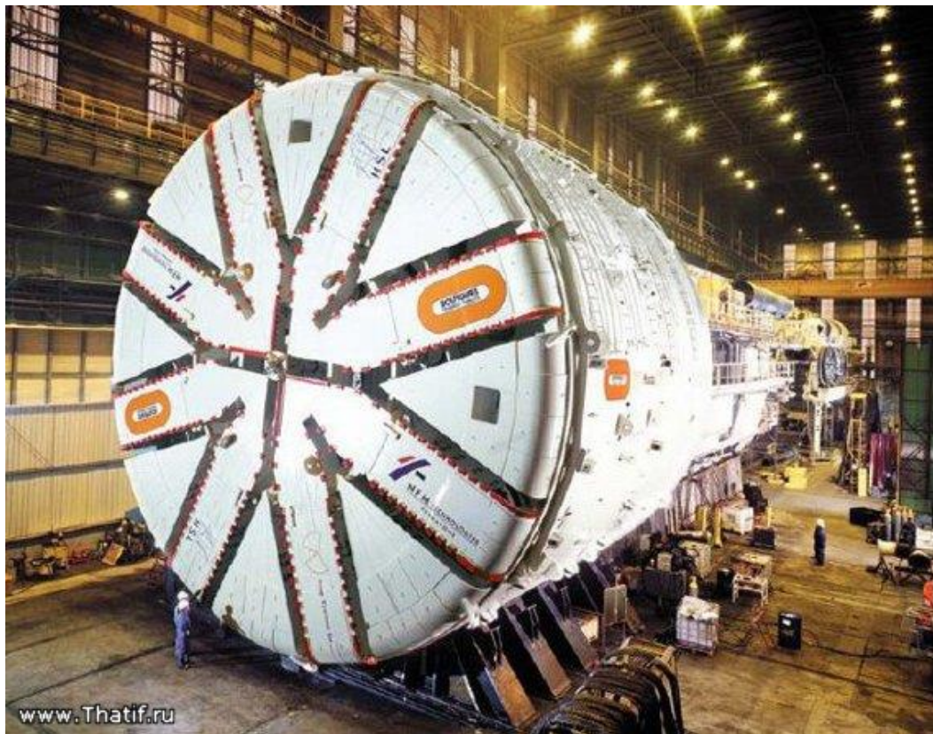
Slika 1.10 Krtica-Herrenknecht EBS shields

(izvor: http://thatif.ru/herrenknecht-epb-shield-s300-prokladyvaem-tuneli/ )