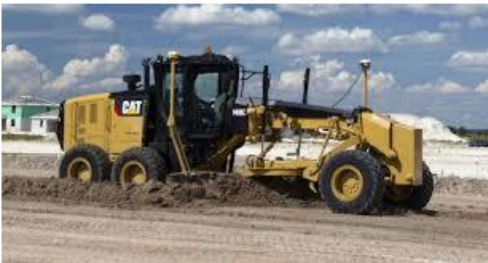
Slika 1.14 Grejder Caterpillar 12 M3/12 M3 AWD

(izvor: http://www.constructionequipment.com/caterpillar-m-series-3-motor-graders. )