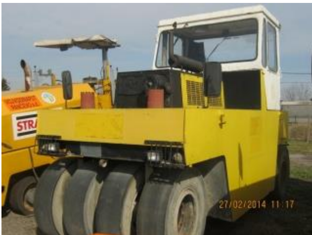
Slika 1.17 Valjak Riko VP 200