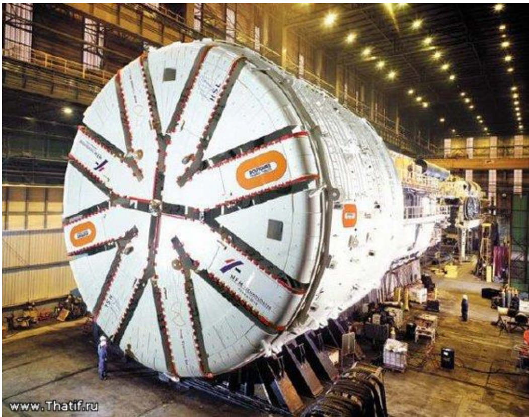
Slika 1.10 Krtica-Herrenknecht EBS shields