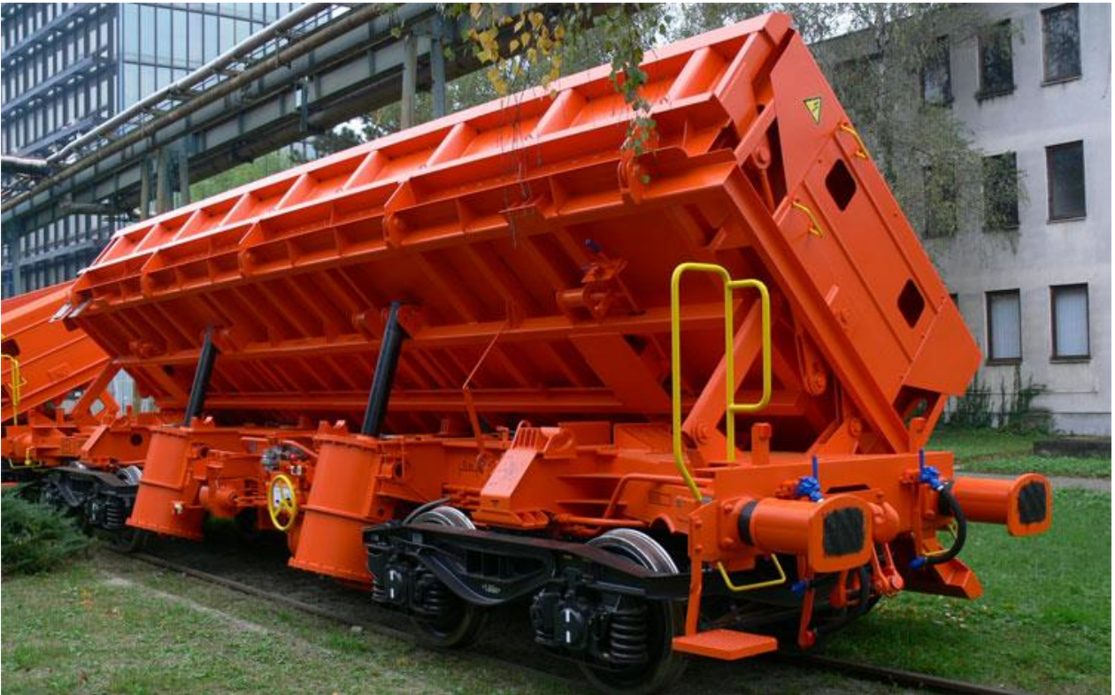
Slika 1.11 vagonete