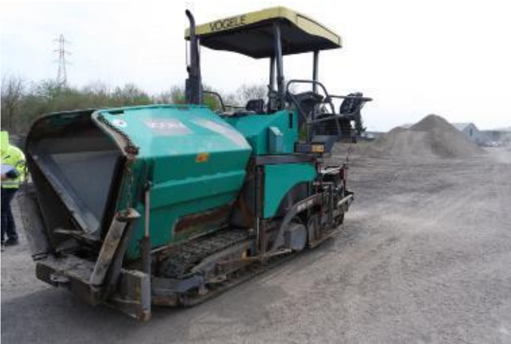
Slika 1.16 Vögele Super 1300-2 Ergoplus