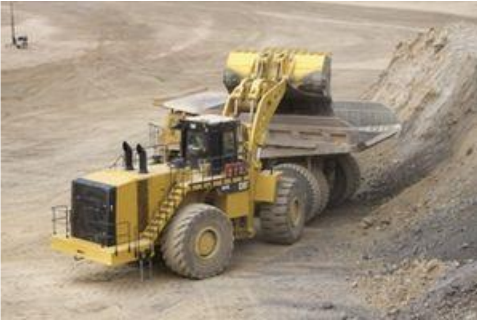
Slika 1.12 Utovarivač Caterpillar 982 M