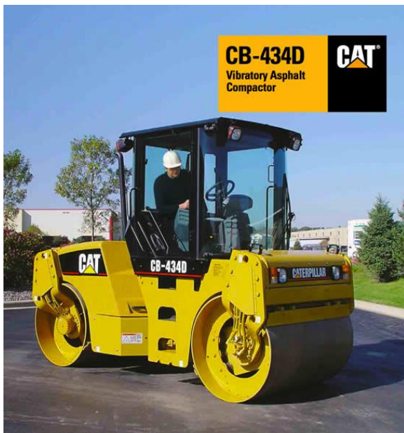
Slika 1.15 Valjak cb-434d