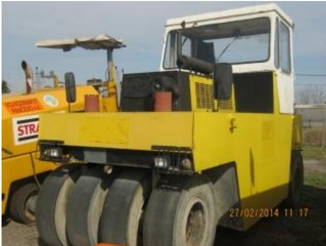
Slika 1.17 Valjak Riko VP 200