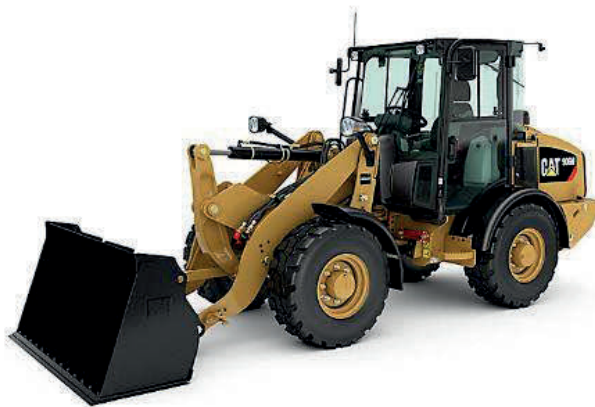
Slika 8. Utovarivač CAT 906 M [8]

Skinuti humus volumena 210 \text{ m}^3 ukrcaje utovarivač CAT 906 M (Slika 6.). Njegova zapremnina je 1,2 \text{ m}^3 , a maksimalna brzina 20 \text{ km/h} . Radijus okretanja je 2,24 \text{ m} .