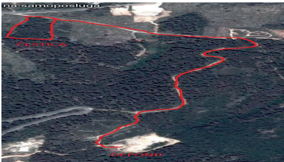
Slika 3. Udaljenost deponija od iskopa [3]