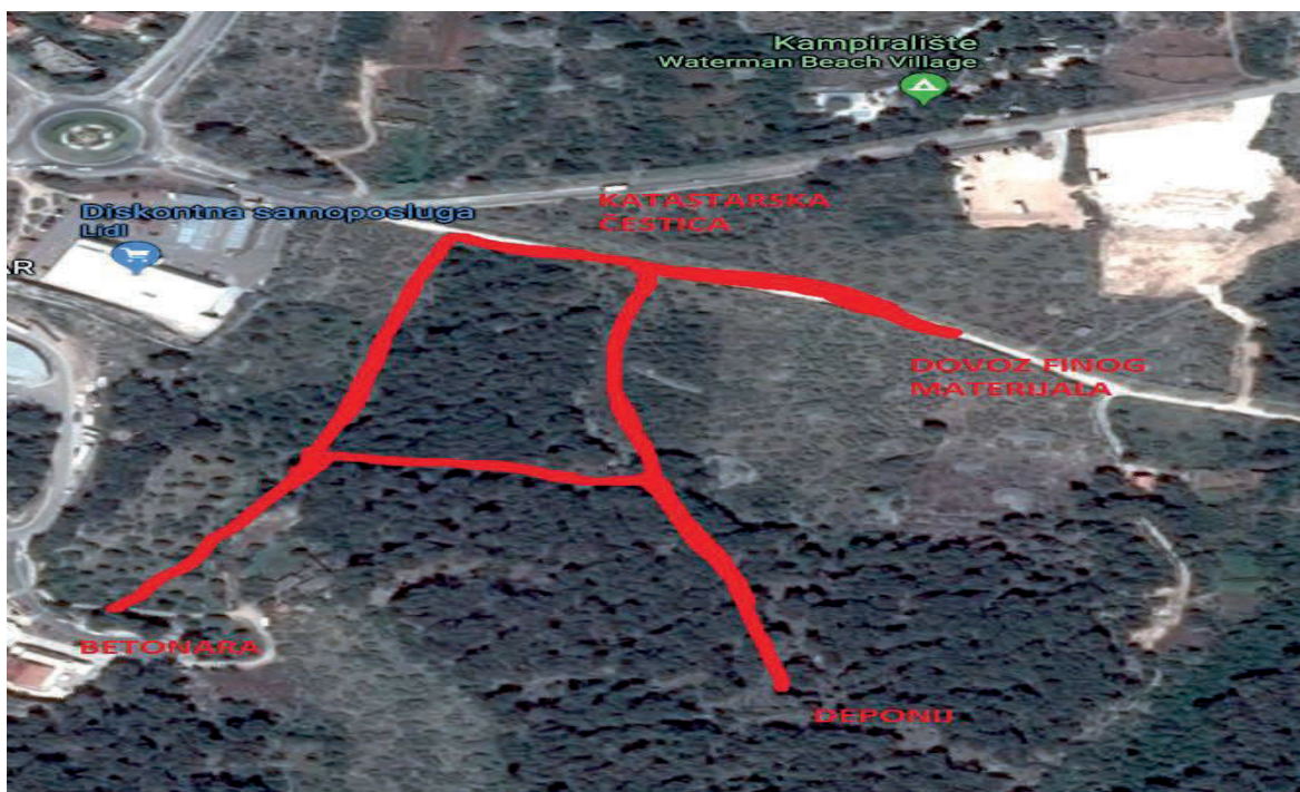
Slika 2. Izgled katastarske čestice [2]