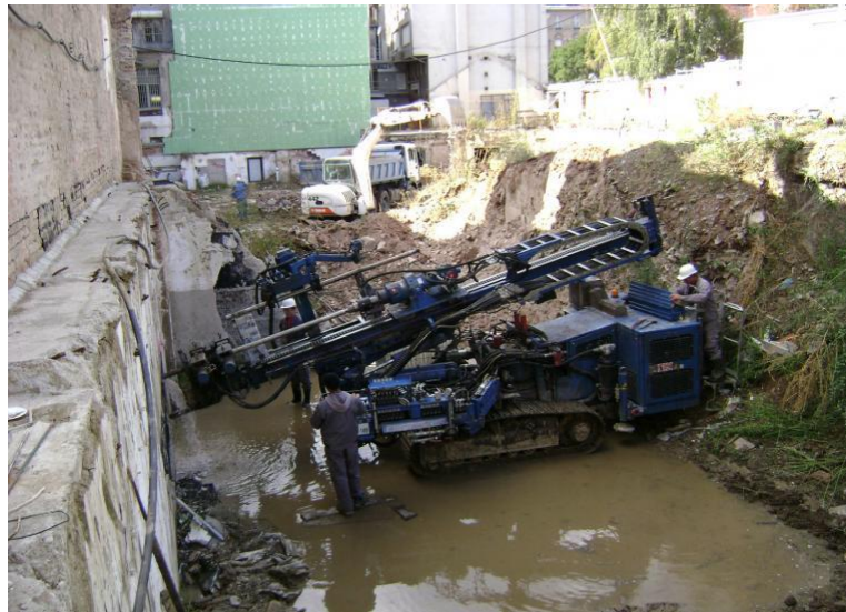
Slika 4.4. Rotaciona motorna bušilica

(izvor: http://www.geomasina.co.rs/prospekti_program/prospekti.pdf )