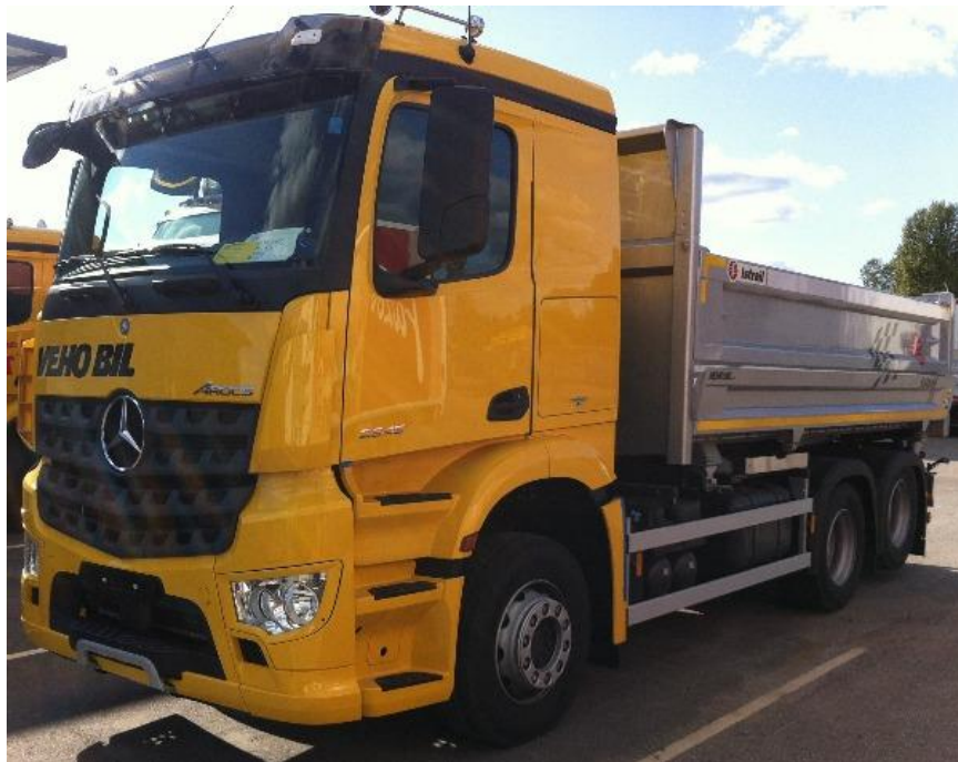
Slika 2.3. Kamion Mercedes-Benz Arocs