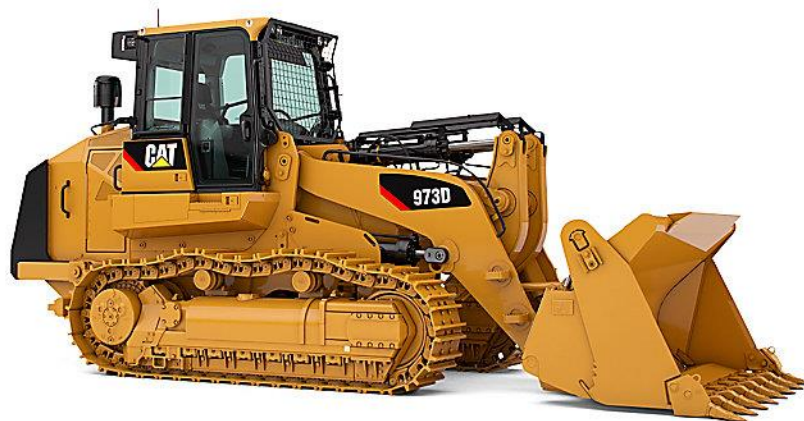
Slika 2.2. Utovarivač tvrtke Caterpillar 973D