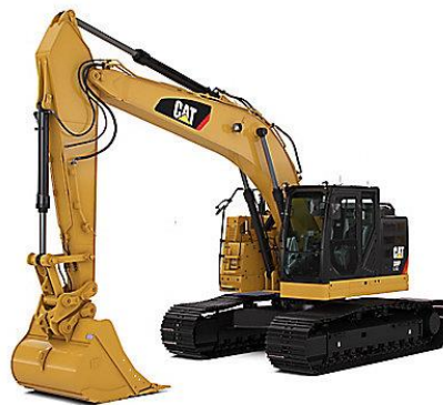
Slika 2.1. Jaružalo tvrtke Caterpillar 335F L CR