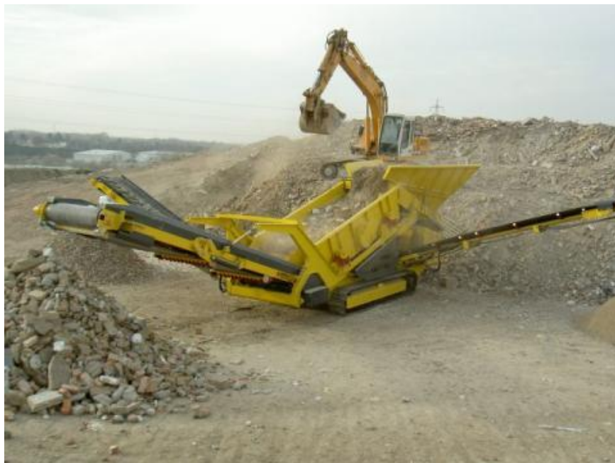
Slika 2.4. Mobilno sito tvrtke Frontier