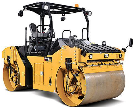
Slika 2.7. Valjak CB54B-Split Drum