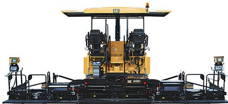
Slika 2.6. Finišer Caterpillar AS4252C