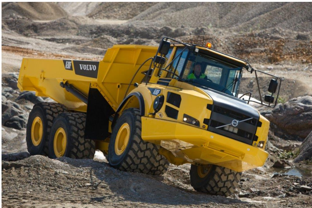
Slika 4.3. Damper tvrtke Volvo A25F

(izvor: http://www.volvoce.com/SiteCollectionDocuments/VCE/Documents%20Global/articulated%20haulers/ProductBrochure_A25F_A30F_EN_21A1006560.pdf )