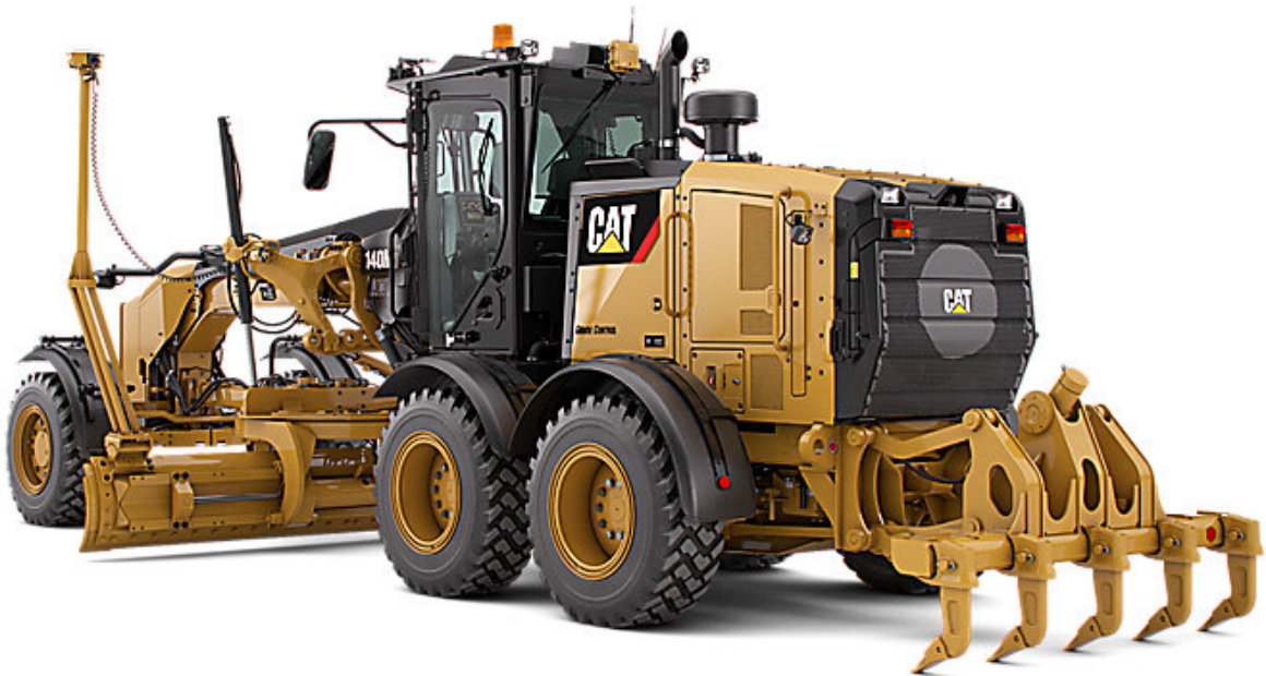
Slika 2.4. dozer CATERPILLAR D7E