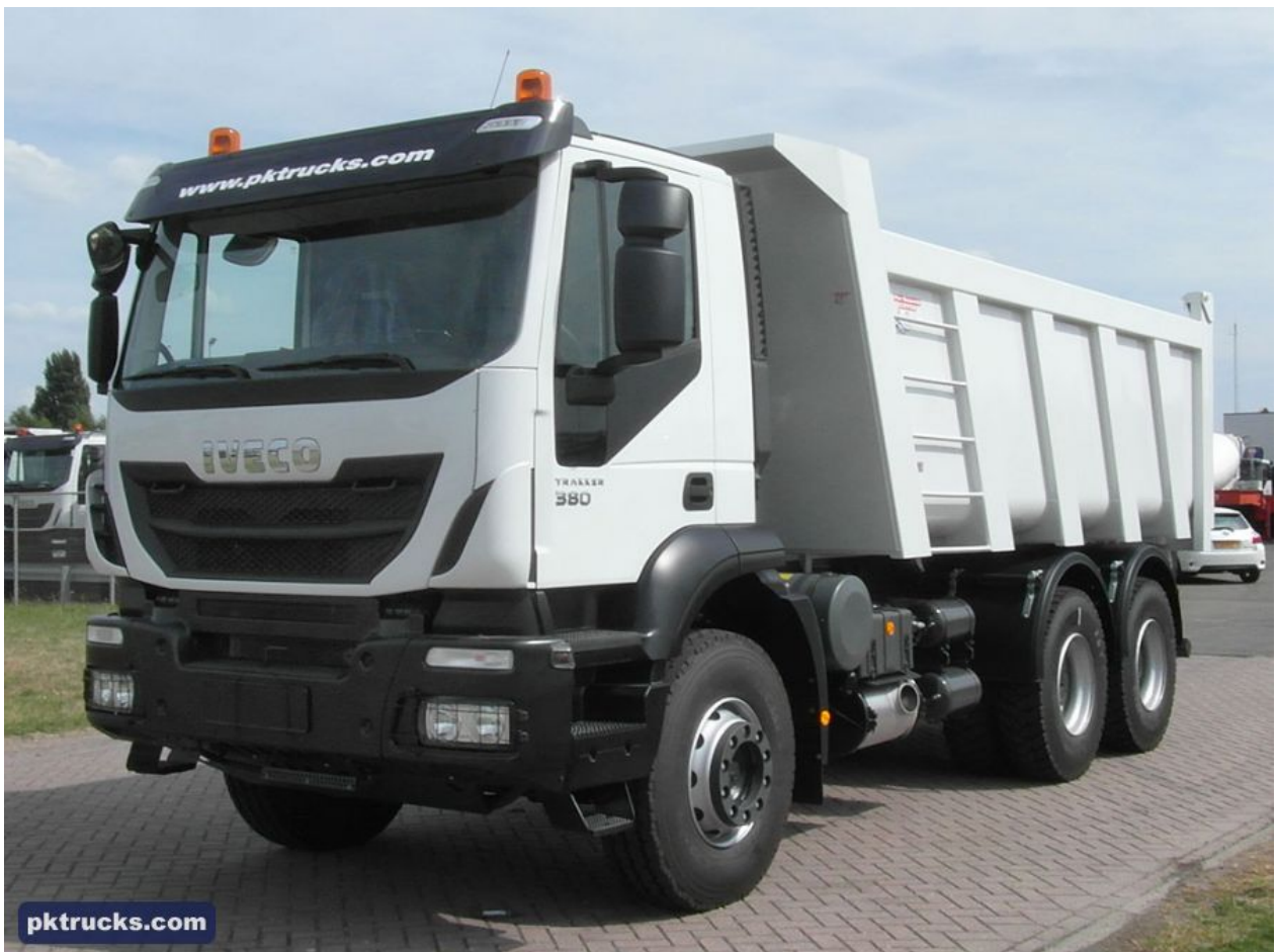
Slika 2.4. TRAKKER AD380T38H-3820 6x4