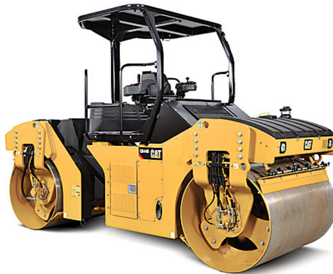
Slika 4.3. CC24B