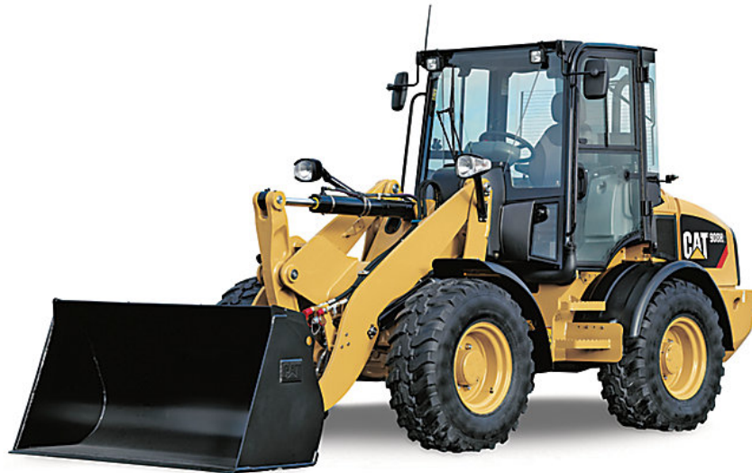
Slika 2.1. Utovarivač tvrtke Caterpillar 908H2 Wheel Loader