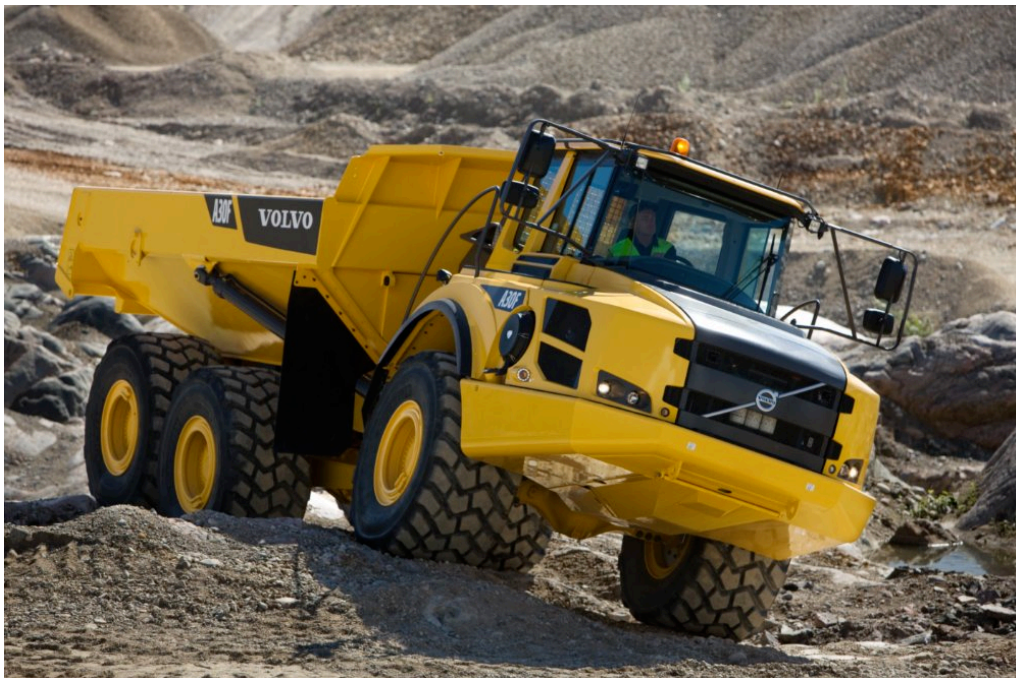
Slika 2.3. Damper tvrtke Volvo A25F