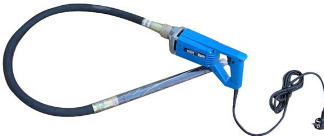
Slika 4.5. Pervibrator