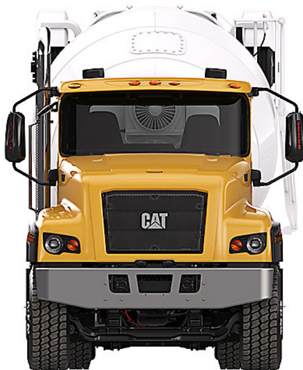
Slika 4.4. automješalica CAT CT681