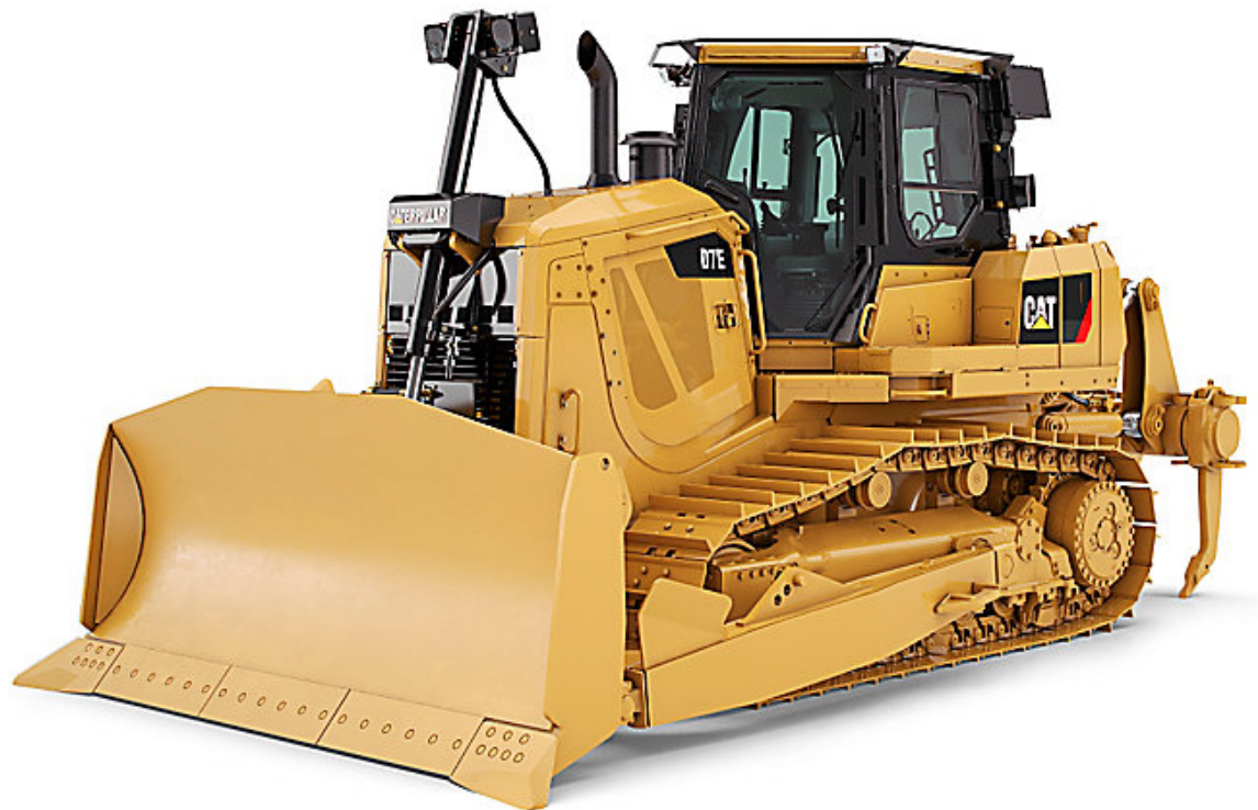
Slika 2.4. dozer CATERPILLAR D7E