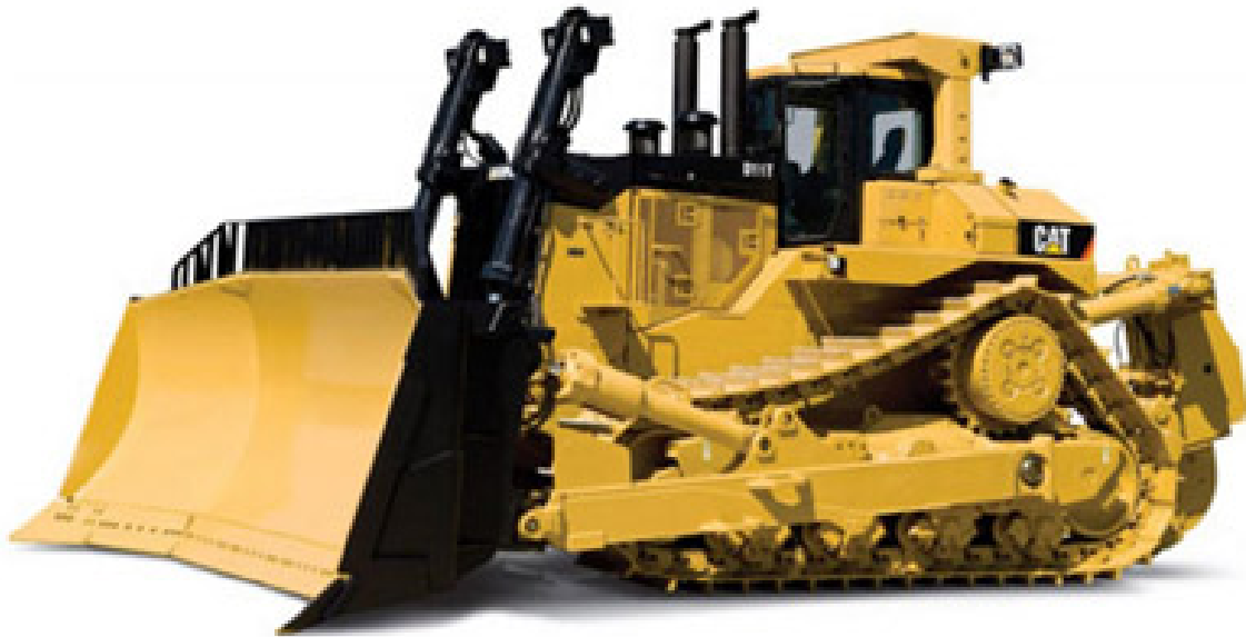
Slika 4.1. dozer CATERPILLAR D7E