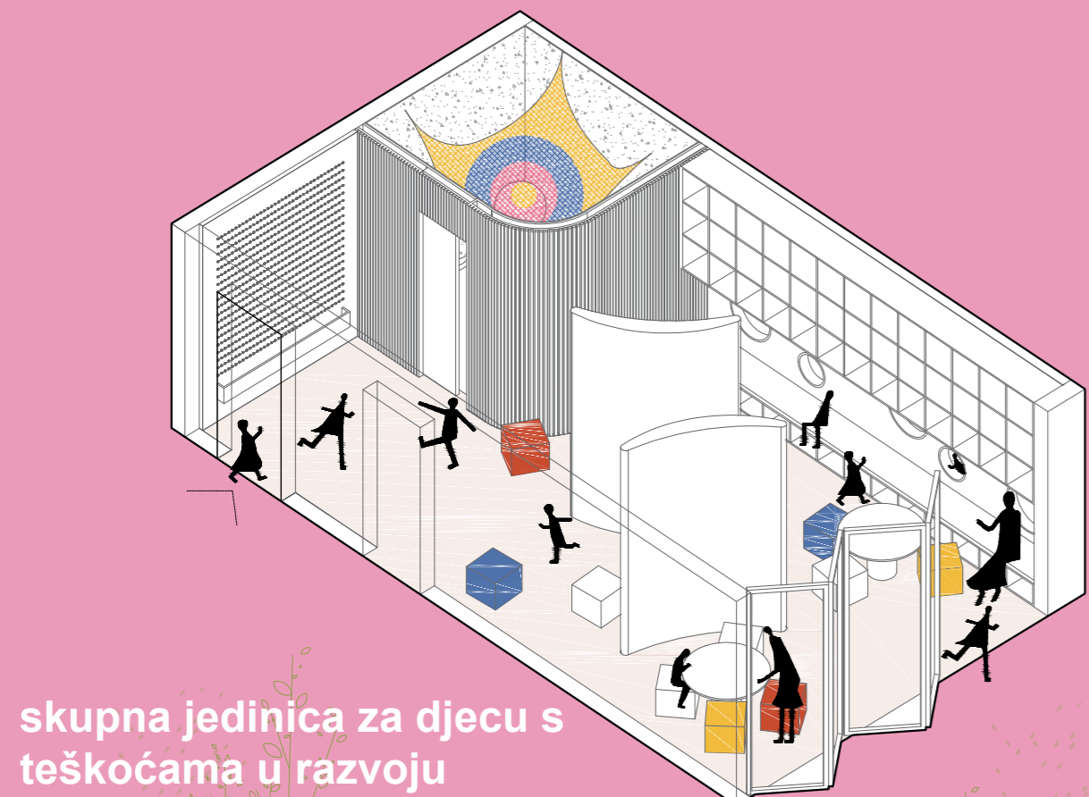
skupna jedinica za djecu s teškoćama u razvoju

Spajanjem elemenata iz okolnog konteksta (staklenik, vrt, kultivacija biljaka) sa sadržajem dječjeg vrtića, prostor vrtića postaje odgojno sredstvo, didaktički sustav koji u prvi plan stavlja ekološki odgoj, kontakt s prirodom i sadnju.