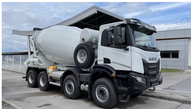
Slika 7. Automiješalica [7]