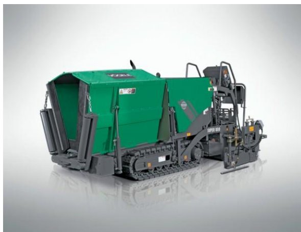
Slika 13. Finišer na gusjenicama [13]