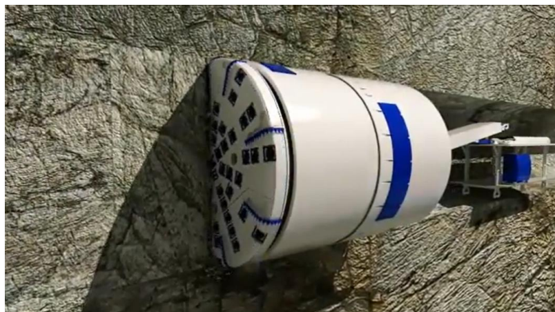
Slika 1. Primjer probijanja tunela [2]