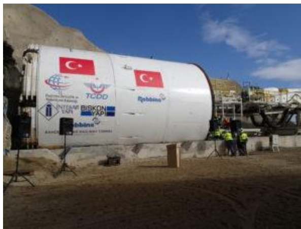
Slika 4. Tunelska krtica [4]