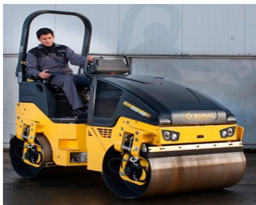
Slika 11. Vibrovaljak [11]