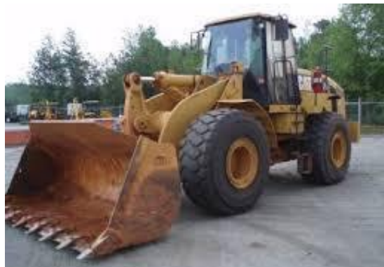
Slika 5. Utovarivač [5]