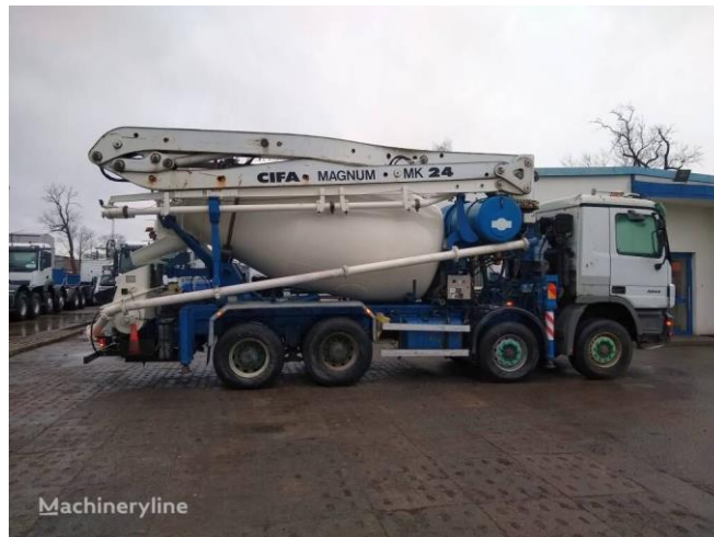
Slika 8. Pumpa za beton [8]