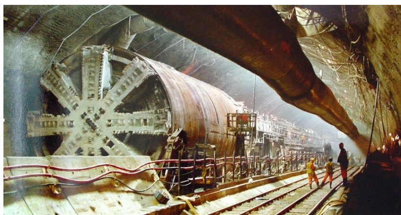
Slika 2. Primjer probijanja tunela [3]