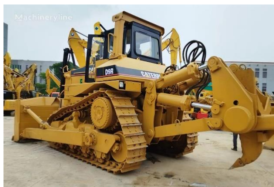
Slika 9. Bulldozer [9]