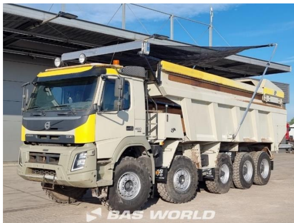
Slika 6. Kamion kiper [6]

-udaljenost gradilišta i deponija: 15 km