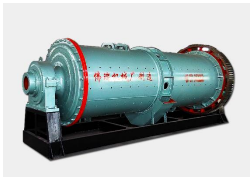
Slika 10. Mlin sa šipkama [10]