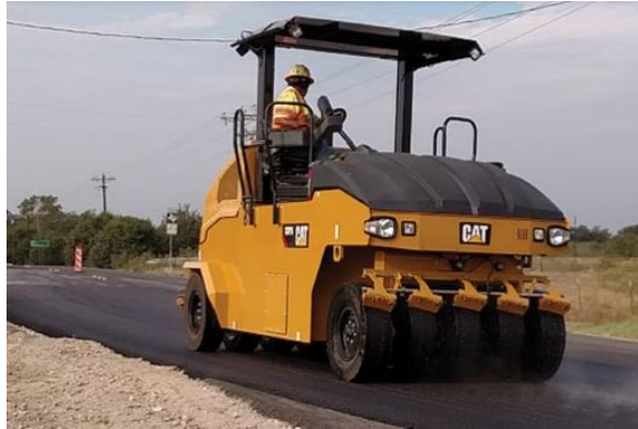
Slika 14. Valjak na kotačima s gumama [14]