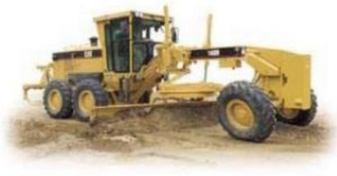
Slika 12, Grejder [12]