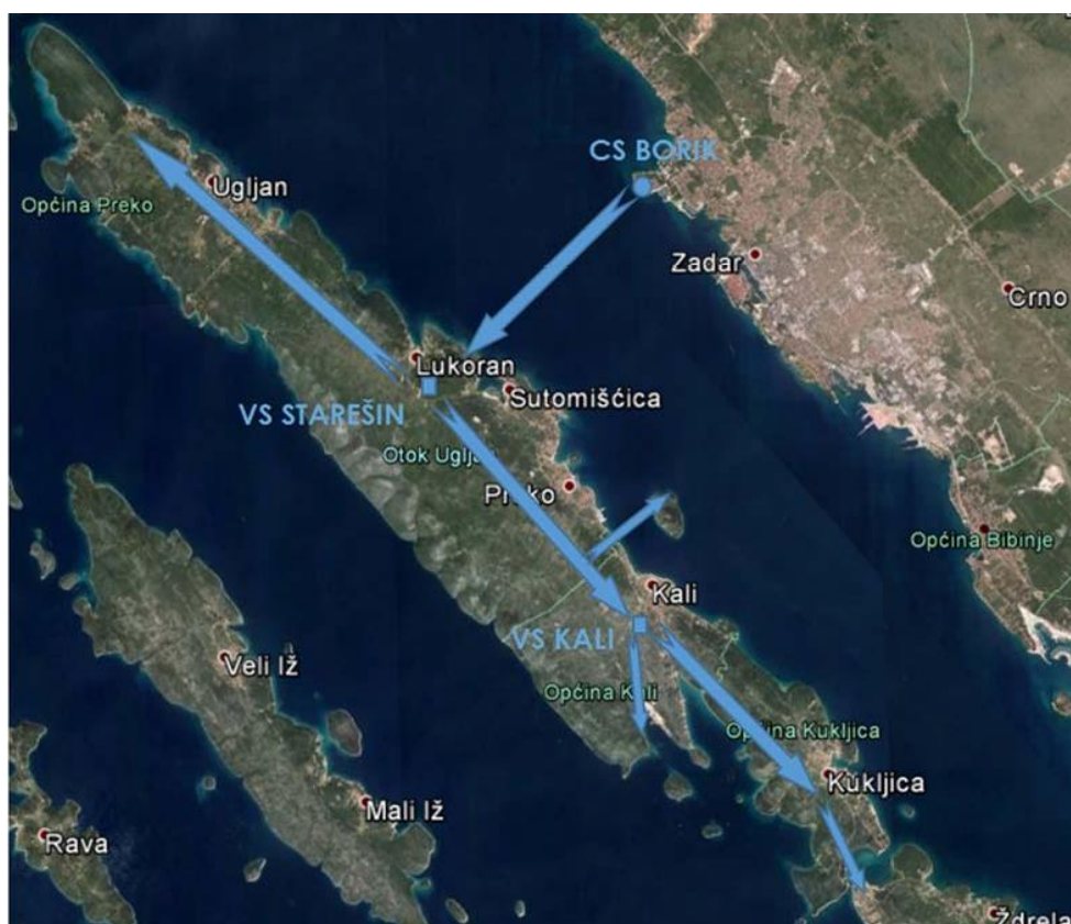
Slika 2. Vodoopskrbni sustav otoka Ugljana

Dio mreže uzet je iz glavnog projekta sustava vodoopskrbe aglomeracije Preko-Kali na otoku Ugljanu. Otok Ugljan nalazi se u zadarskom arhipelagu, sjeverozapadno od otoka Pašmana i jugoistočno od otoka Rivanj i Sestrunj. Od kopna ga dijeli Zadarski kanal, a s otokom Pašmanom povezuje most preko prolaza Mali Ždrelac. Ugljan se ubraja i među najnaseljenije hrvatske otoke. Sva naselja leže uz obalu istočne strane otoka. Područje otoka Ugljana obuhvaća tri općine, općinu Preko, općinu Kali i općinu Kukljica.