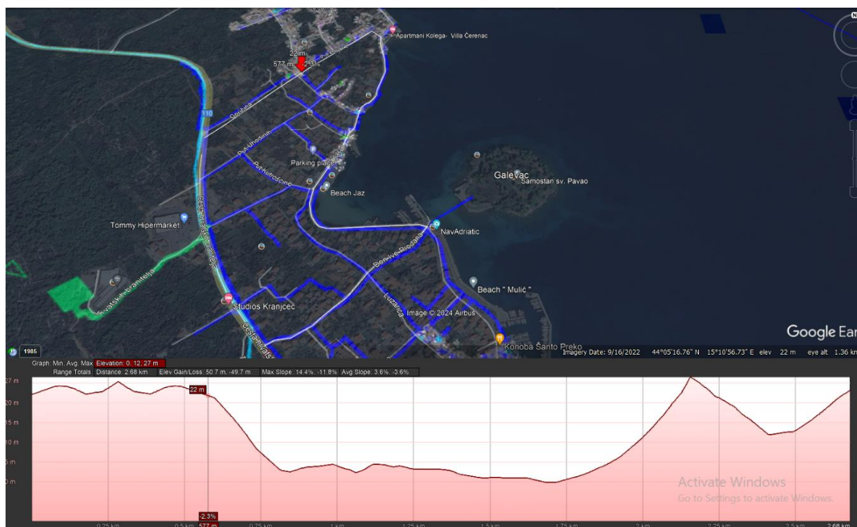
Slika 5. Uzdužni profil terena odabrane dionice vodovodne mreže preuzet s Google Earth-a

Također, za svaki čvor potrebno je odrediti vrijednost (položajne) visine z na kojoj se čvor nalazi. Budući da za predmetno područje u trenutku proračuna nije bila dostupna geodetska podloga, korištene su podgloge Google Earth programa kako bi se dobile visinske kote čvorova (Slika 5.).