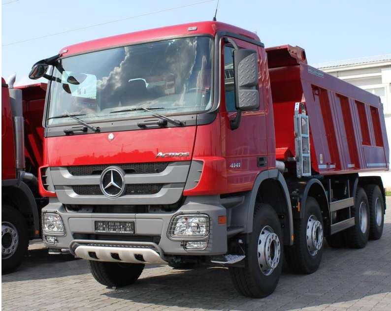
Slika 4.3: Kamion kiper Mercedes actros 4141