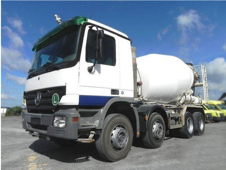
Slika 4.5: Automiješalica Mercedes-Benz ACTROS 3540-B