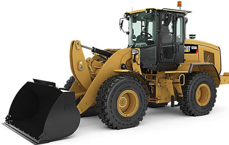
Slika 4.2: Utovarivač Caterpillar 926 M