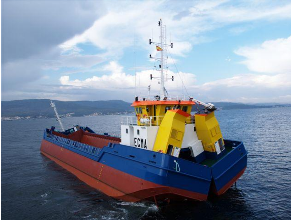
Slika 4.8: Plovna teglenica ECMA