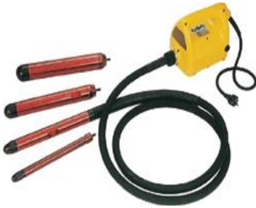
Slika 4.6: pervibrator AVMU AX 48