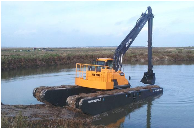
Slika 4.7: Plovno jaružalo Big Float 1400