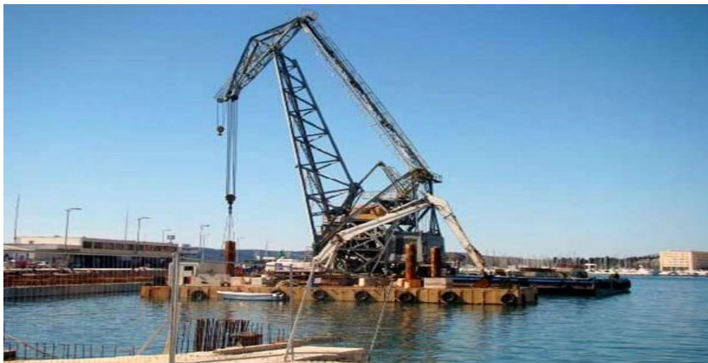
Slika 4.13: Plovna dizalica Marjanka