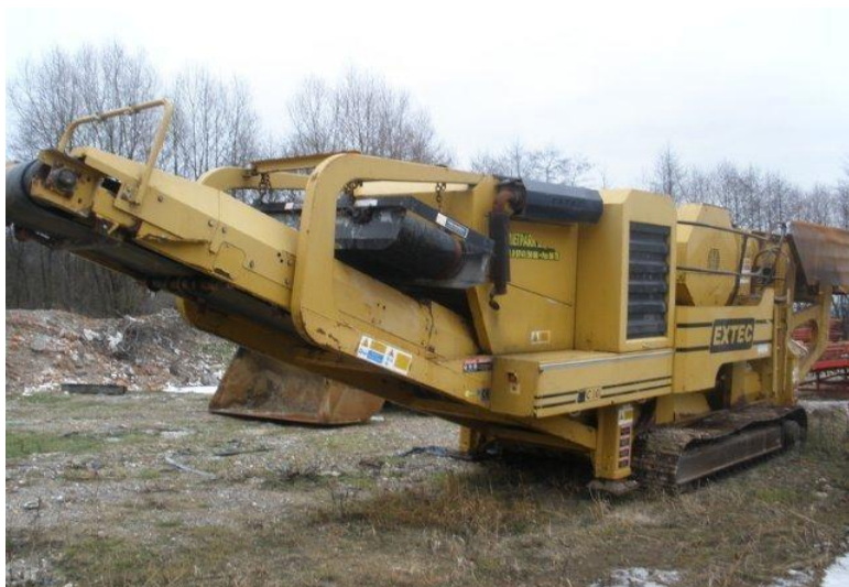
Slika 4.9: Čeljusna drobilica Extec C10