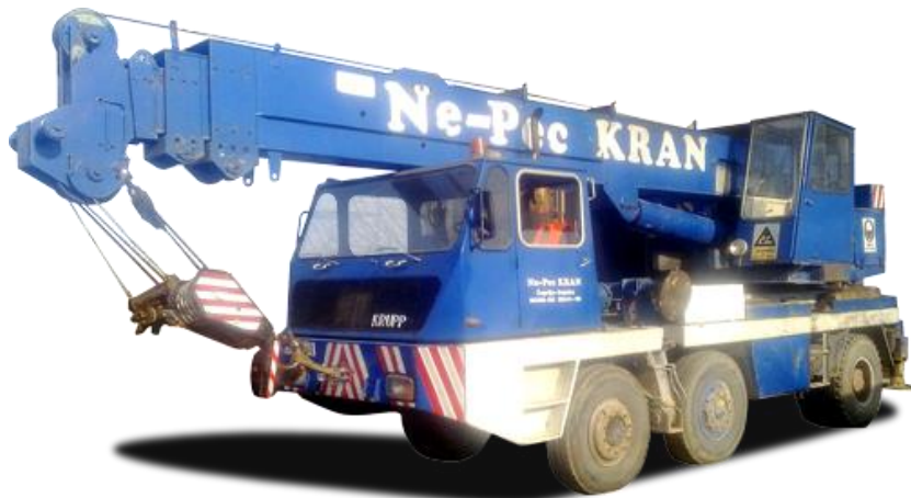
Slika 4.12: Autodizalica Krupp 25 GMT-AT