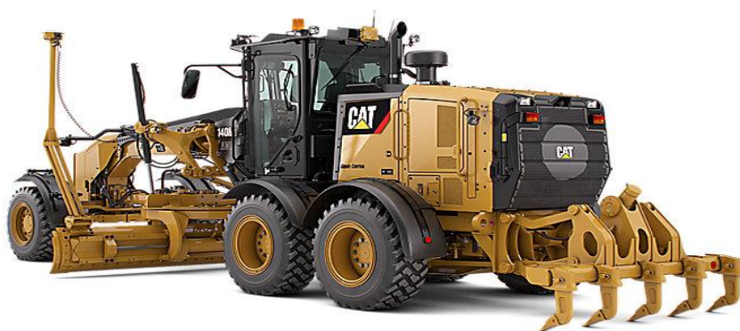
Slika 4.10: Grejder Caterpillar 12M3