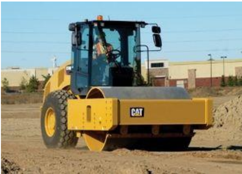
Slika 4.4: Vibrovaljak Cat CS44B