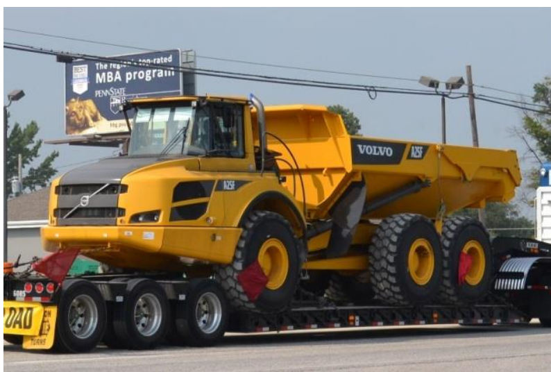
Slika 4.11: Damper Volvo A25F