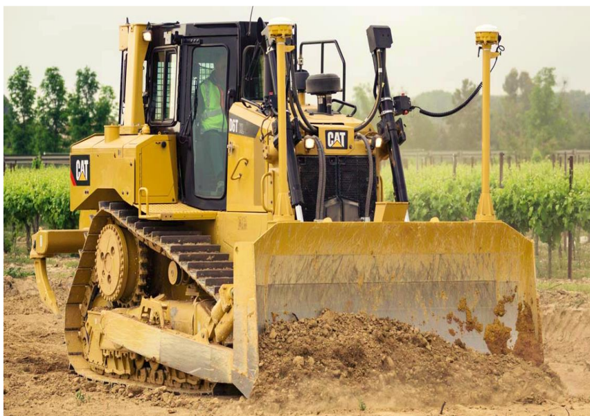
Slika 4.1: Buldozer Caterpillar D6T XW/VPAT