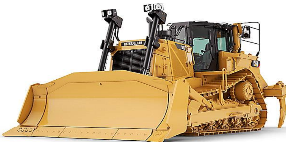
SLIKA 3.1 Buldozer Cat®C15 ACERT™