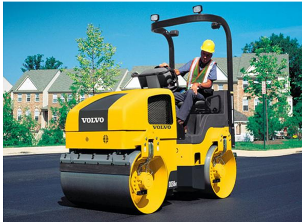
Slika 5.1. Valjak Volvo DD38HF