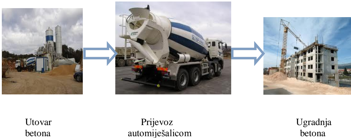
Slika 4.2. Shema korištenja strojeva za betonske radove

Betoniranje podne ploče, te vertikalnih i horizontalnih serklaža vrši se pomoću dizalice za beton i košare, jer je objekt visine 14 metara, pa je to najpovoljnije rješenje za dopremanje betona na te visine. Beton se doprema automiješalicom iz betonare udaljene 8 km od objekta. ( Slika 4.2.)