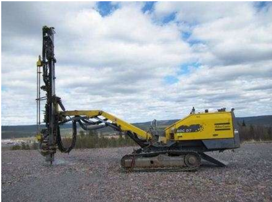
Slika 6. Samopokretna bušilica [7]

Samopokretne bušilice ili bušeća kola sastoje se od traktora na gusjenicama, s pogonom na stlačeni zrak. Na traktoru se nalazi dubinska bušilica koja pomoću hidraulike ili stlačenog zraka potiskuje šipku sa sječivom. Samopokretne bušilice (slika 6.) koriste se za bušenje rupa u koje se poslije postavlja eksploziv. Rad se sastoji od udaraca i rotacije šipke. Sila pritiska šipke iznosi 22 kN, a brzina bušenja ovisi o vrsti kamena koji se buši i obično iznosi do 3 m/min. Šipka za bušenje se može okretati u svim smjerovima. Za potrebe dubljeg bušenja produljuje se nastavcima. Sredinom presjeka šipke prolazi šupljina kroz koju se mogu utiskivati zrak ili voda radi potrebe ispuhivanja ili ispiranja bušotine. Sadrže i uređaj za skupljanje prašine s filterom. Promjer šipke ovisi o promjeru bušotine. Minimalni promjer šipke je 32 cm a maksimalni 104 cm. [1]