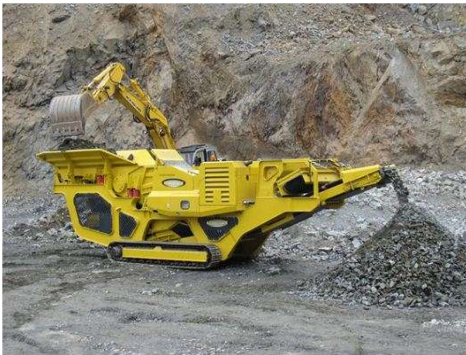
Slika 9. Čeljusna drobilica [11]