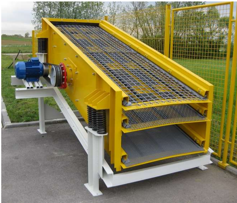
Slika 19. Vibracijsko sito [20]

U čeličnu konstrukciju vibracijskog sita smještene su 2 do 4 mreže od pletene mangan-čelične žice, pod kutom od 17 do 25 stupnjeva. Na slici 19. prikazano je vibracijsko sito. Radi na principu da se na početku na gornjoj mreži, pomoću vibracija koje proizvodi pogonski sklop s vibratorom, odvajaju zrna koja su veća od otvora na mreži. Postupak se ponavlja sve do zadnje mreže, gdje izlaze najsitnija zrna. Vibrator u minuti proizvede 1000 - 1500 vibracija. [1]