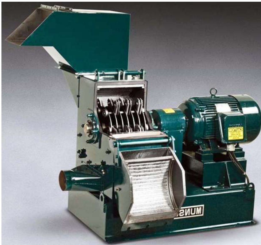
Slika 15. Mlin čekićar [16]

Konstrukcija mlinova čekićara sastoji se od čeličnog sanduka u kojem se nalazi rotor na čijem obodu su raspoređeni čekići. Čekići su raspoređeni u redovima, od 2 do 6, sa po 4 čekića u svakom redu. Mlin čekićar (slika 15.) ima naboranu kružnu oblogu. Rotor u minuti napravi 1500 - 2500 okretaja. Radi na principu da se kamena zrna pri ulasku u mlin zahvaćaju čekićima i odbacuju u oblogu, pri čemu dolazi do njihova usitnjavanja. Na dnu mlina nalazi se izlazni otvor koji je zatvoren čeličnom rešetkom kroz koju izlaze samo kamena zrna čija je veličina manja od veličine otvora na rešetki. [1]