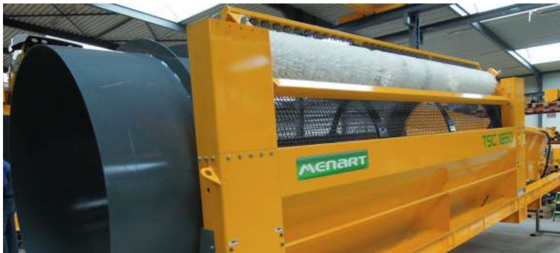
Slika 17. Rotacijsko sito [18]

Konstrukcija rotacijskog sita sastoji se od nagnutog čeličnog valjka u kojem se nalaze četiri perforirana čelična polja s otvorima 8, 12, 30 i 50 mm. Valjak je nagnut pod kutom od 10 stupnjeva i položen na čelične ležajeve. Rotacijsko sito (slika 17.) tijekom okretanja propušta samo kamena zrna čija je veličina manja od otvora na poljima. U minuti napravi 12 - 20 okretaja. Prosijavanje se obavlja tako da se najprije odvajaju najsitnija zrna, a potom ona krupnija. Zbog toga dolazi do oštećenja polja za sitne frakcije, te se zato vrlo rijetko koriste. [1]