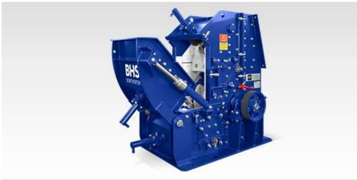
Slika 14. Udarni mlin [15]

Udarni mlin (slika 14.) radi tako da se kameni materijal odmah pri ulasku u mlin zahvaća udarnom gredom i odbacuje u čelične ploče, pri čemu se usitnjava. Kamena zrna koja izlaze iz udarnih mlinova kubičastog su oblika. Učinak iznosi 20 - 50 t/h. [1]