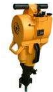
Slika 4. Zračna bušilica [5]

Na slici 4. prikazana je zračna bušilica.