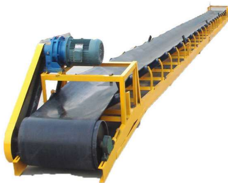
Slika 8. Transportna traka [9]

Transportna traka (slika 8.) je stroj koji se sastoji od čelične rešetke nosača. Poprečno na rešetku, svakih 0,9 do 1,2 m, postavljeni su noseći valjci. Preko valjaka je nategnuta neprekinuta gumena traka, koja je armirana adekvatnim vlaknima. Na jednom kraju nosača nalazi se pogonski valjak, a na drugom zatezni valjak, koji služi za zatezanje trake. Maksimalna duljina transportne trake iznosi 200 metara, a širina može biti od 300 do 1500 mm. [1]