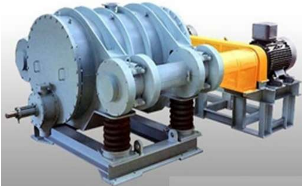
Slika 16. Vibracijski mlin [17]

Konstrukcija vibracijskog mlina sastoji se od 4 do 6 šupljih čeličnih valjaka koji su postavljeni na elastične gumene ležajeve. Funkcija ležajeva je da amortiziraju pomake koji nastaju od vibracija koje proizvodi ekscentar s pogonskim motorom. Vibracijski mlin (slika 16.) ima sposobnost drobljenja u više stupnjeva prerade. U unutrašnjosti valjaka nalaze se čelične kugle ili šipke (ovisno o potrebnoj finoći mliva). Princip rada je da čelične kugle ili šipke trenjem i udaranjem usitnjuju kamena zrna. Prerađena kamena zrna izlaze kroz otvore na čeličnoj rešetki. Maksimalno zrno koje može ući u mlin veličine je 30 mm. Veličina izlaznih zrna je 0,02 - 6 mm. Učinak iznosi 7 - 55 t/h. [1]