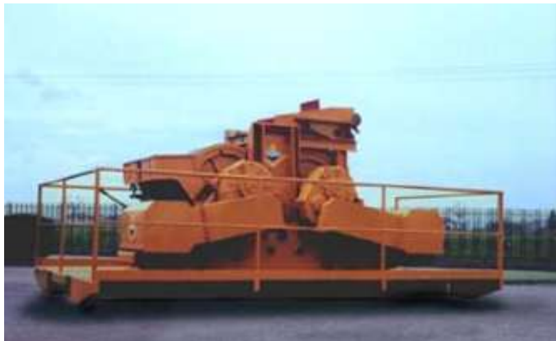
Slika 12. Mlin s valjcima [10]