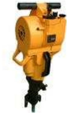
Slika 4. Zračna bušilica [5]

Na slici 4. prikazana je zračna bušilica.