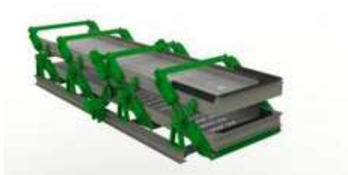
Slika 18. Rezonantno sito [19]

Konstrukcija rezonantnog sita (slika 18.) sastoji se od dva vodoravna čelična okvira. Na svaki okvir su postavljena pletiva s dvije veličine otvora. Okviri su međusobno povezani pomičnim čeličnim polugama i kosim vodilicama s gumenom oblogom. Pogonski sklop s ekscentrom stvara vibracije. Vibracije se s pletiva prenose na kamena zrna i dospijevaju u rezonantno stanje. Zbog vibracija kameni materijal na pletivu poskakuje i povećava učinak. Prednosti ovog sita su: ujednačen i ekonomičan učinak, mala visina, pristupačnost te svojstvo da se površina sita može prilagoditi granulometrijskom sastavu kamena koji se prosijava. [1]