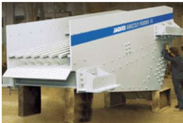
Slika 20. Gruba rešetka [10]

Gruba rešetka (slika 20.) sastoji se od čelične konstrukcije u koju su, na razmacima od 100 do 150 mm, uzdužno postavljene čelične nosači. Tako poredani nosači tvore sustav rešetke. Iznad rešetke nalazi se sandučasti čelični lijevak u koji se dostavlja kameni materijal koji zatim klizi prema rešetki. Ispod rešetke nalazi se još jedan čelični lijevak, koji služi za prihvat kamenog materijala koji prođe kroz otvore između rešetaka. [1]