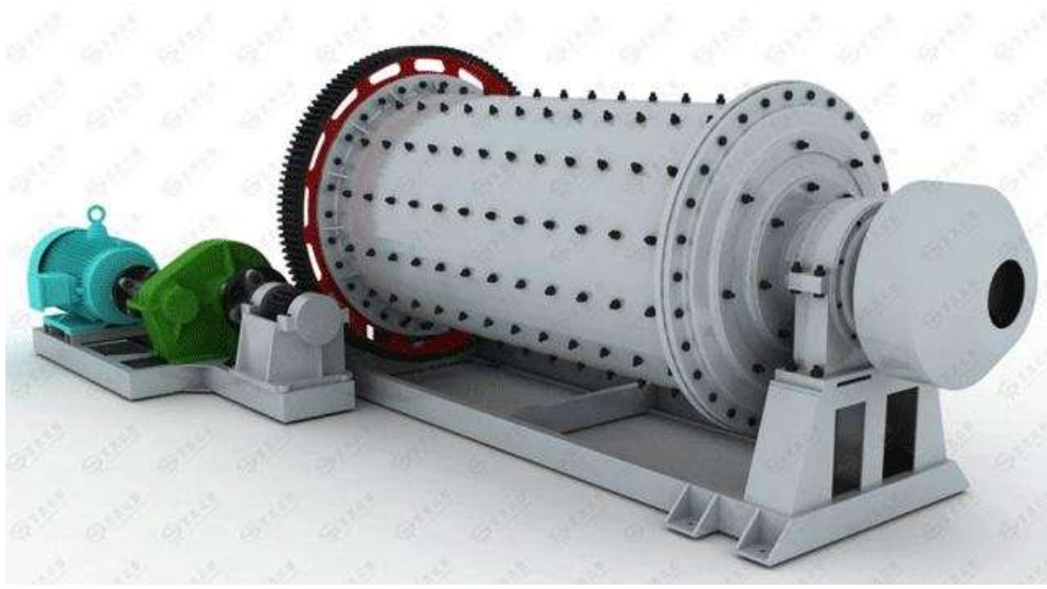
Slika 11. Mlin s kuglama [13]

Radi na principu da čelične kuglice međusobnim pritiskom i pritiskom s oblogom valjka gnječe i usitnjuju kamena zrna. Usitnjena kamena zrna izlaze kroz izlazni otvor kao kameno brašno (filer). Učinak iznosi 3 - 20 t/h. [1]