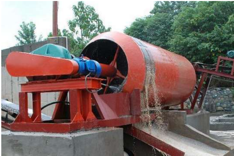
Slika 22. Stroj za pranje s bubnjem [22]

Kotači s vjedricama iz vode izvlače oprana kamena zrna čija veličina može biti i manja od 1 mm. Za razliku od strojeva za pranje s noževima, kod ovih strojeva kroz preljev s vodom izađe puno manje uporabljivih zrna. [1]