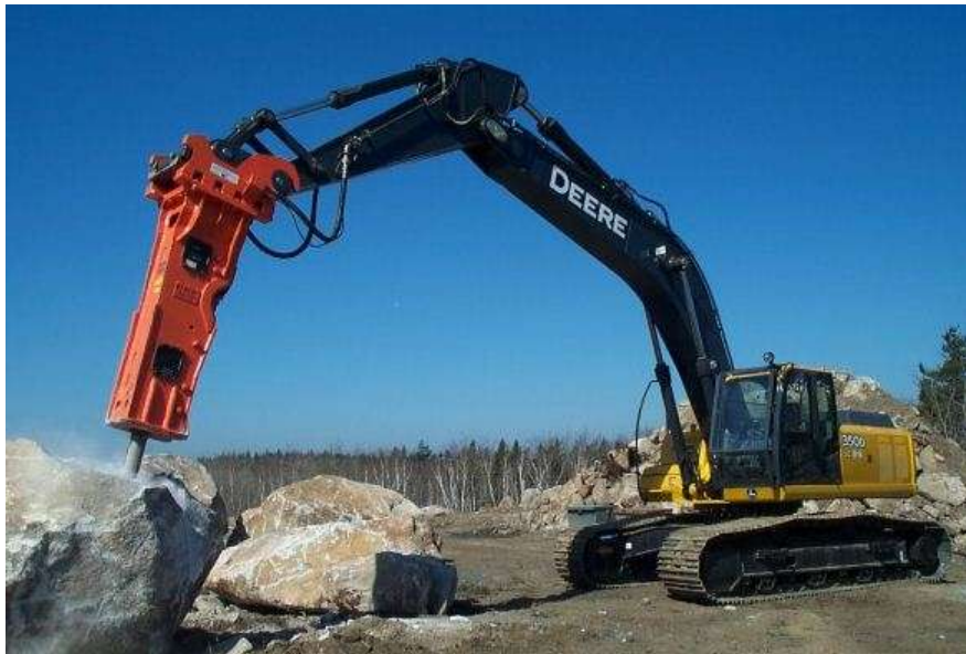
Slika 5. Hidraulični čekić montiran na ruku jaružala [6]

Hidraulični čekić (slika 5.) montira se na radnu ruku jaružala te se uz pomoć hidraulike razbija kamen. Hidraulični čekići većeg opsega koriste se za razbijanje, odnosno odvajanje kamene stijene od kamene gromade, dok se oni manjeg opsega koriste za razbijanje već odvojene kamene stijene.