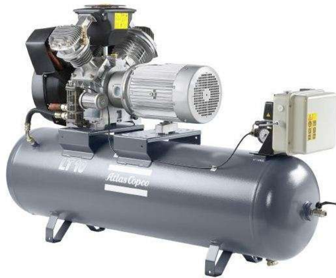
Slika 3. Stapni kompresor [4]

Stapni kompresori (slika 3.) su vrsta kompresora koja se najčešće upotrebljava. Rade na principu tlačenja zraka u stublini pomoću stapa. Imaju sposobnost reguliranja tlaka zraka pomoću automatskog regulatora, koji gasi motor nakon što se postigne tlak od 650 do 700 kPa. Ovi kompresori imaju vlastiti spremnik za stlačeni zrak. [1]