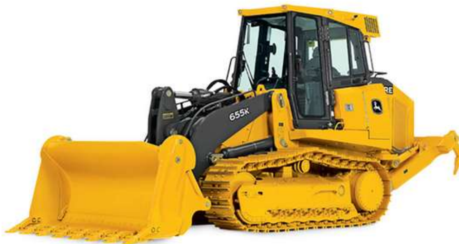
Slika 7. Utovarivač na gusjenicama [8]

Utovarivači manjeg opsega, neovisno o tome jesu li na gusjenicama ili kotačima s gumama, koriste se za prijenos usitnjenog kamenog materijala iz jednog procesa prerade u drugi.