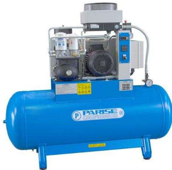
Slika 2. Spiralni kompresor [3]

Spiralni kompresori se nazivaju još i vijčanim kompresorima. Sastoje se od čeličnog kućišta u kojem se dvije usporedne osovine sa spiralnim navojem ujednačeno okreću u suprotnim smjerovima. Rade na principu potiskivanja zraka strujanjem u prostoru između spirala i plašta. Spiralni se kompresori (slika 2.) upotrebljavaju kad je potrebno proizvesti veću količinu stlačenog zraka. Zauzimaju malo prostora, a mogu raditi u jednom i u dva stupnja tlačenja. [1]