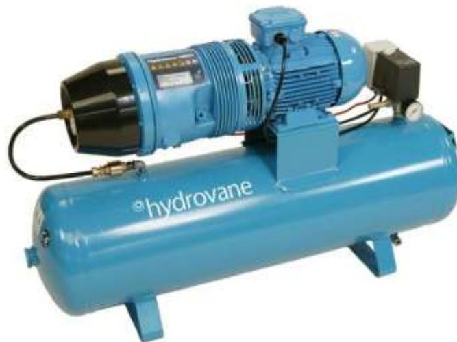
Slika 1. Rotacijski kompresor [2]

Rotacijski kompresori rade na principu tlačenja zraka pomoću rotora koji je ekscentrično postavljen u čelični valjak. Okretanjem rotora sprječava se prolazak zraka u prostor između lamele i plašta valjka. U valjku se zbog njegove ekscentričnosti smanjuje prostor između lamela i pritom se tlači zahvaćeni zrak. Rotacijski kompresori (slika 1.) rade u dva stupnja tlačenja. U prvom stupnju tlačenja tlače zrak do 400 kPa, a zatim od 600 do 700 kPa. Pri radu proizvode malo buke. [1]