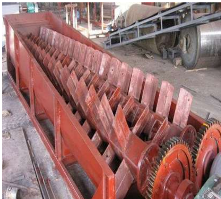
Slika 21. Stroj za pranje s noževima [21]

Radi na principu da se kameni materijal pri pranju nastoji što više raščlaniti pomoću čeličnih noževa ili spirala. Kotač s vjedricom iz vode izvlači oprana kamena zrna veća od 3 mm. Mulj i ostale nečistoće izlaze s vodom na preljev. Nedostatak ove vrste stroja je što s muljem i vodom kroz preljev izlaze i uporabljive veličine kamenih zrna. [1]