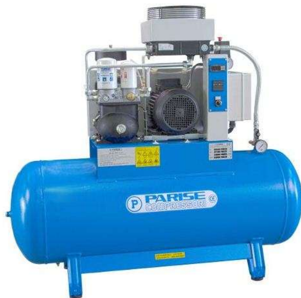
Slika 2. Spiralni kompresor [3]

Spiralni kompresori se nazivaju još i vijčanim kompresorima. Sastoje se od čeličnog kućišta u kojem se dvije usporedne osovine sa spiralnim navojem ujednačeno okreću u suprotnim smjerovima. Rade na principu potiskivanja zraka strujanjem u prostoru između spirala i plašta. Spiralni se kompresori (slika 2.) upotrebljavaju kad je potrebno proizvesti veću količinu stlačenog zraka. Zauzimaju malo prostora, a mogu raditi u jednom i u dva stupnja tlačenja. [1]