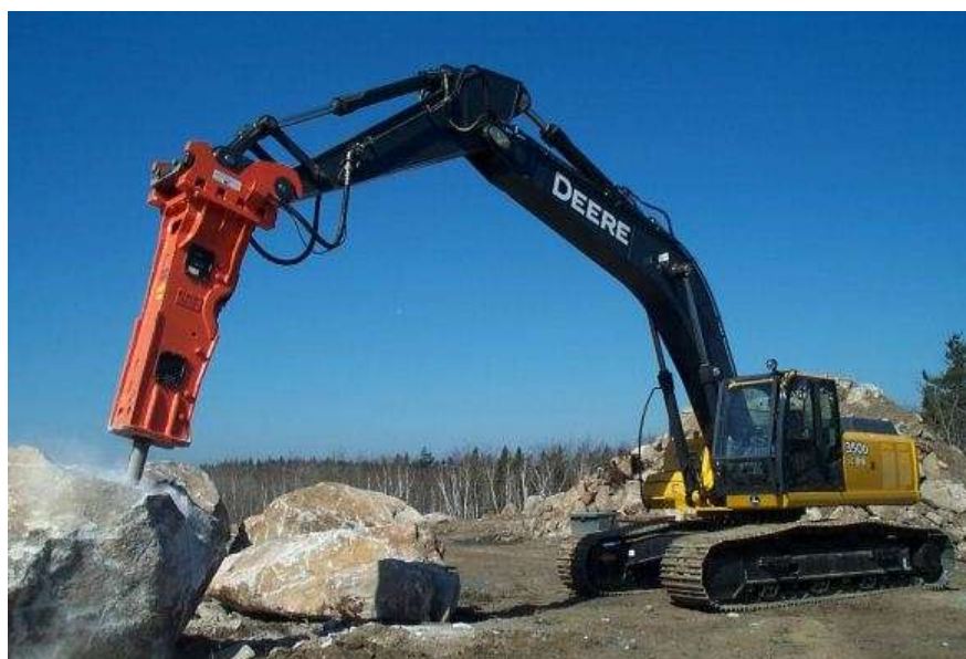
Slika 5. Hidraulični čekić montiran na ruku jaružala [6]

Hidraulični čekić (slika 5.) montira se na radnu ruku jaružala te se uz pomoć hidraulike razbija kamen. Hidraulični čekići većeg opsega koriste se za razbijanje, odnosno odvajanje kamene stijene od kamene gromade, dok se oni manjeg opsega koriste za razbijanje već odvojene kamene stijene.