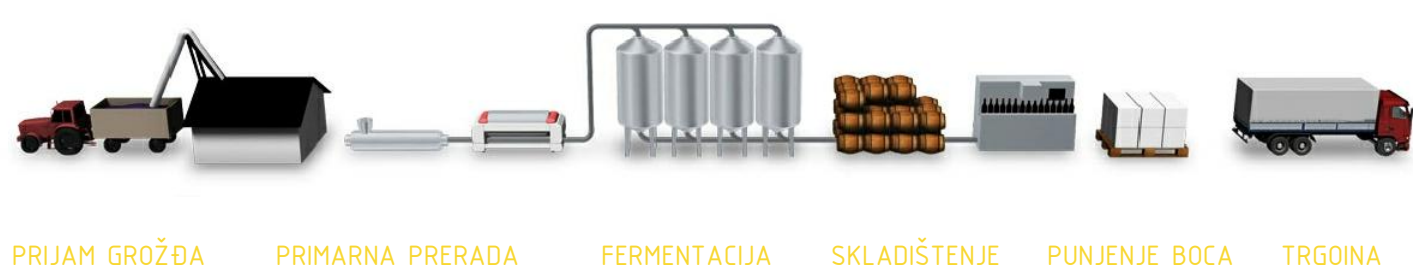
PRIJAM GROŽĐA PRIMARNA PRERADA FERMENTACIJA SKLADIŠTENJE PUNJENJE BOCA TRGOVINA