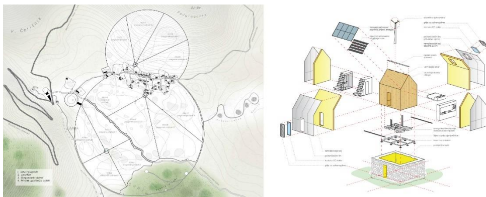
Slika 5. Lijevo: Podglogovik, pregoni pašnjaci; desno: smještajna jedinica

Rastovac (Slika 6) je zamišljen kao više sklopova sastavljenih od nekoliko smještajnih jedinica. Smještaj je projektiran za obitelji s djecom. Svaka jedinica je dostatna za najmanje četiri osobe. Urbanistički postav i koncepcija građevina inspirirani su lokalnim tipologijama i projektirani da potiču interakciju posjetitelja. Razvoj lokaliteta uključuje reparaciju postojećih suhozida i sadnju vinograda te gradnju vinarije za proizvodnju i plasman autohtonih vina. Postojeće, prirodno formirane vrtače okružile bi se suhozidnim terasama. Uz rub svake vrtače postavljena su po dva smještana sklopa. Kultivirane vrtače su u kontrastu s nekontroliranom vegetacijom koja ih okružuje. Namjena postojećih zgrada predviđena je za prijem, servis i administraciju.