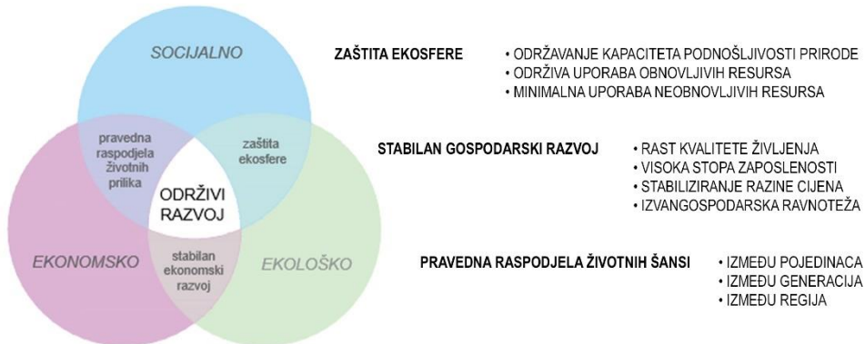
Slika 1. Dijagram međuovisnosti sfera

Ustaljeni modeli razvoja temeljeni su na eksploataciji resursa ne uzimajući u obzir njihovu obnovljivosti. Takvo upravljanje resursima rezultira različitim konfliktima. Međuovisnost primarnih polja konflikta može se predočiti dijagramom prikazanim na Slici 1.