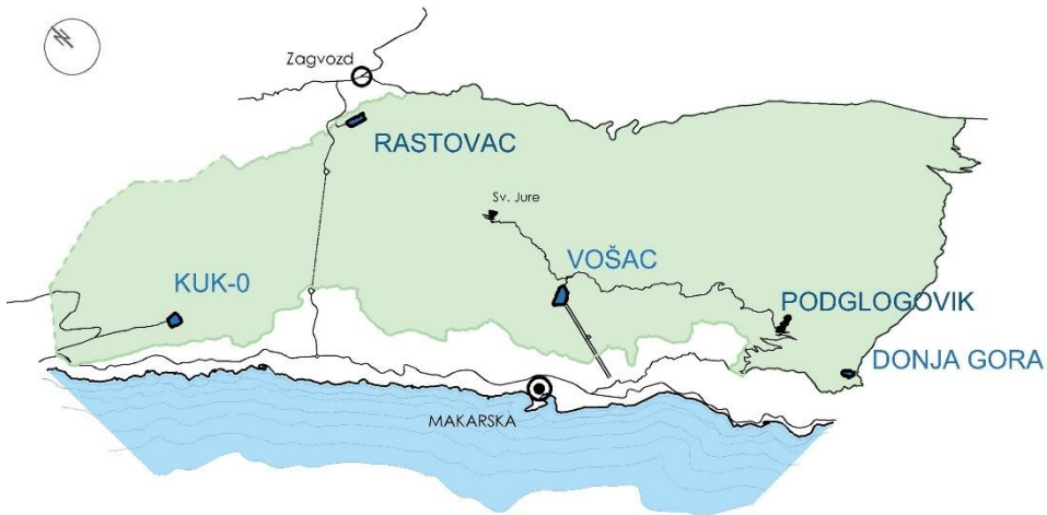
Slika 3. Prikaz analiziranih lokacija u PPB-u

U skladu s prostornim planom, na temelju analize odabrano je pet potencijalnih lokacija unutar PPB-a (Slika 3) i dan je prijedlog razvoja za dvije lokacije. U razmatranju potencijalnih lokacija u obzir je uzeto stanje prirodnog ambijenta, prometna povezanost, dopušteni opseg gradnje po Prostornom planu PPB-a te mogućnost priključka na energetska i vodovodna mreža. Istražene su i evidentirane atrakcije: prirodne atrakcije kao špilje i šume, arheološka nalazišta te povijesni graditeljski sklopovi (pastirska naselja i suhozidi). Pri odabiru lokacije razmatrani su i postojeći ugostiteljski kapaciteti.