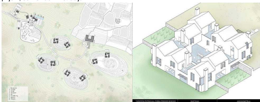
Slika 6. Lijevo: situacija Rastovac; desno: prikaz smještajnog sklopa

Rastovac (Slika 6) je zamišljen kao više sklopova sastavljenih od nekoliko smještajnih jedinica. Smještaj je projektiran za obitelji s djecom. Svaka jedinica je dostatna za najmanje četiri osobe. Urbanistički postav i koncepcija građevina inspirirani su lokalnim tipologijama i projektirani da potiču interakciju posjetitelja. Razvoj lokaliteta uključuje reparaciju postojećih suhozida i sadnju vinograda te gradnju vinarije za proizvodnju i plasman autohtonih vina. Postojeće, prirodno formirane vrtače okružile bi se suhozidnim terasama. Uz rub svake vrtače postavljena su po dva smještana sklopa. Kultivirane vrtače su u kontrastu s nekontroliranom vegetacijom koja ih okružuje. Namjena postojećih zgrada predviđena je za prijem, servis i administraciju.