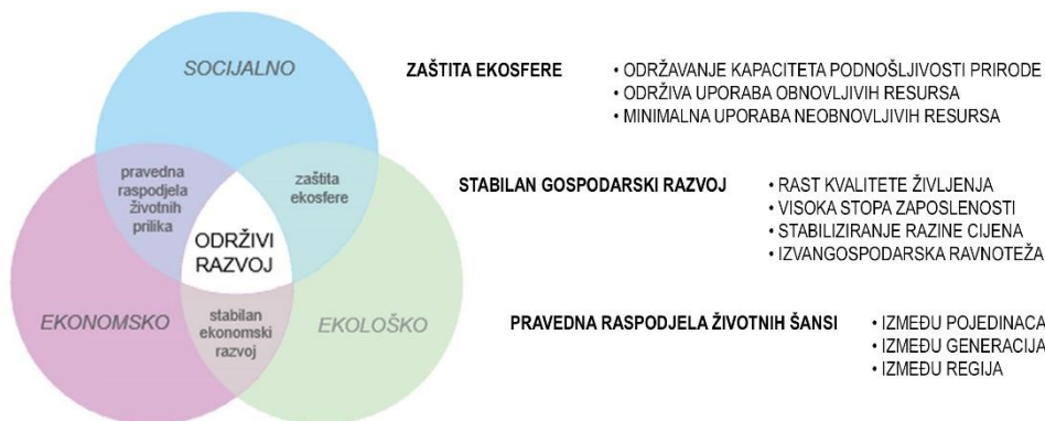
Slika 1. Dijagram međuovisnosti sfera

Ustaljeni modeli razvoja temeljeni su na eksploataciji resursa ne uzimajući u obzir njihovu obnovljivosti. Takvo upravljanje resursima rezultira različitim konfliktima. Međuovisnost primarnih polja konflikta može se predočiti dijagramom prikazanim na Slici 1.