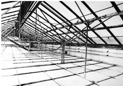
Slika 4. Fotografija nadsvjetla nad blagajničkom dvoranom u zgradi Gradskih poduzeća (iz arhive Arhitektonskog studija Mistrinja).

Velika dvorana u Radničkoj komori je prema projektu iz 1934. arhitekata Grupe KKK (Jovana Korke, Đorđa Krekića i Georgija Kiveorva) i arhitekta Vladimira Šterka zaobljene trapezne forme (linija stropa dvorane bila je zaobljena u uzdužnom smjeru), rebrastog armiranobetonskog stropa na rasponu od 23 do 40 m (Slika 3). Iz nepoznatih razloga ova se konstrukcija na kraju izvodi od čelika. Ova je građevina također jedna od rijetkih s pravim armiranobetonskim skeletnim sustavom na rasponima od 7,3 m te se i u funkcionalnom rješenju građevine primjenjuju datosti ovog konstruktivnog rješenja.