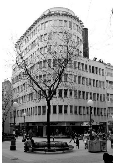
Slika 2. Napretkova zadruga. (fotografija: autor).