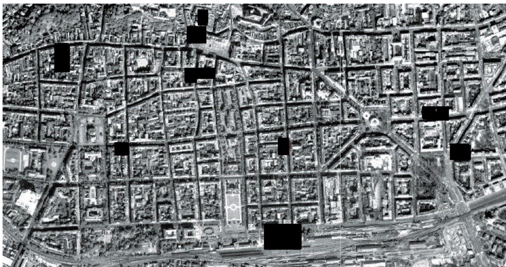
Slika 1. Prikaz Donjeg grada (centra Zagreba) s obilježenim pozicijama analiziranih građevina (karta preuzeta s Google earth aplikacije).

Cilj je ovog rada predstavljanje doktorske disertacije Arhitektura, konstrukcija i konzervacija: reprezentativna palača tridesetih godina u Zagrebu obranjene na Sveučilištu Roma "Tor Vergata" , Rim, Italija 2010. godine. U radu je analizirana kompleksna tipologija zgrada, pretežno poslovne namjene, nastale na vrhuncu zagrebačkog modernog pokreta - tridesetih godina dvadesetog stoljeća u Donjem gradu, današnjem središtu Zagreba (Slika 1). Razmatrana tipologija prerasta prvotnu inačicu poslovnih građevina s funkcionalnom podjelom po etažama i postaje kompleksan spoj raznolikih sadržaja za veliki broj korisnika; zajednička karakteristika odabranih građevina je da su sve kao predstavništva poduzeća ili udruga građana građene kako bi predstavile svoje naručitelje u skladu sa suvremenim arhitektonskim tendencijama, radi čega su u istraživanju nazvane reprezentativna palača . Analiza objedinjuje desetak palača koje danas čine antologijsko tkivo grada te otkriva Zagreb kao konzervativnu sredinu po pitanju konstruktivnih karakteristika građevina, primjene suvremenih materijala i njihovih mogućnosti (Tablica 1).