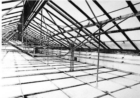
Slika 4. Fotografija nadsvjetla nad blagajničkom dvoranom u zgradi Gradskih poduzeća.

Velika dvorana u Radničkoj komori je prema projektu iz 1934. arhitekata Grupe KKK (Jovana Korke, Đorđa Krekića i Georgija Kiveorva) i arhitekta Vladimira Šterka zaobljene trapezne forme (linija stropa dvorane bila je zaobljena u uzdužnom smjeru), rebrastog armiranobetonskog stropa na rasponu od 23 do 40 m (Slika 3). Iz nepoznatih razloga ova se konstrukcija na kraju izvodi od čelika. Ova je građevina također jedna od rijetkih s pravim armiranobetonskim skeletnim sustavom na rasponima od 7,3 m te se i u funkcionalnom rješenju građevine primjenjuju datosti ovog konstruktivnog rješenja.