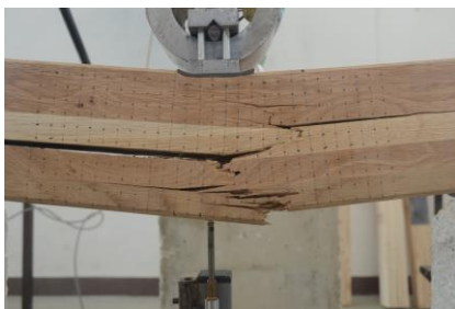
Slika 5. Uzorak S1