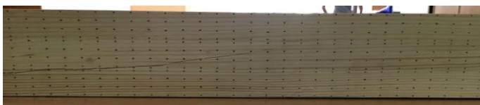
Slika 6. Uzorak S3